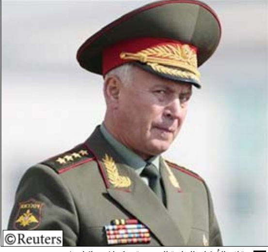
قائد الأركان العامة الروسية نيكولاي ماكاروف

قصف بيونجيانج لجزيرة كورية جنوبية في الشهر الماضي الذي أسفر عن سقوط قتلى يستحق التنديد لكنه أشار أيضا إلى أن تدريبات عسكرية كورية جنوبية أمريكية مشتركة أدت إلى تصعيد التوتر. كما أبدى لافروف «قلقًا بالغًا» لروسيا إزاء قدرات كوريا الشمالية في مجال تخصيب اليورانيوم وهي وسيلة أخرى لصنع أسلحة نووية إلى جانب برنامج البلوتونيوم.