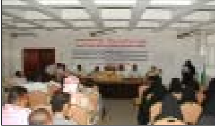
■ من اختتام الدورة التعريفية

إلى أن مفهوم الصحة ينطلق من التوعية والتثقيف قبل العلاج متمنيا أن تسهم مخرجات الدورة في تحسين الفهم للوقاية والتوعية لدى المواطنين، وبين أن الكثير من الأمراض التي تم مكافحتها كانت الوقاية والخدمات المجتمعية هي الركن الأساس في القضاء عليها. من جهة أخرى كرم مكتب الصحة العامة والسكان بحضور مأمس 20 قابلة شاركن في دورة قابلات الأكاديمية للسكان. وفي الحفل الذي أقيم تحت شعار "مكتبة الصحة للمكلا بدعم من صندوق الأمم المتحدة للسكان" وقيادته من قبل مدير مكتب الصحة والسكان بمديريات الساحل ومكتب الصحة الانجابية على الجهود التي بذلوها متمنا دعم صندوق الأمم المتحدة للسكان وإقامة مثل هذه البرامج والدورات الهادفة إلى رفع المستوى الصحي في اليمن وحضروم.