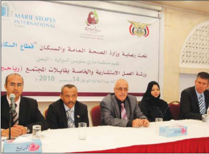
من ورشة العمل الاستشارية الخاصة بقابلات المجتمع