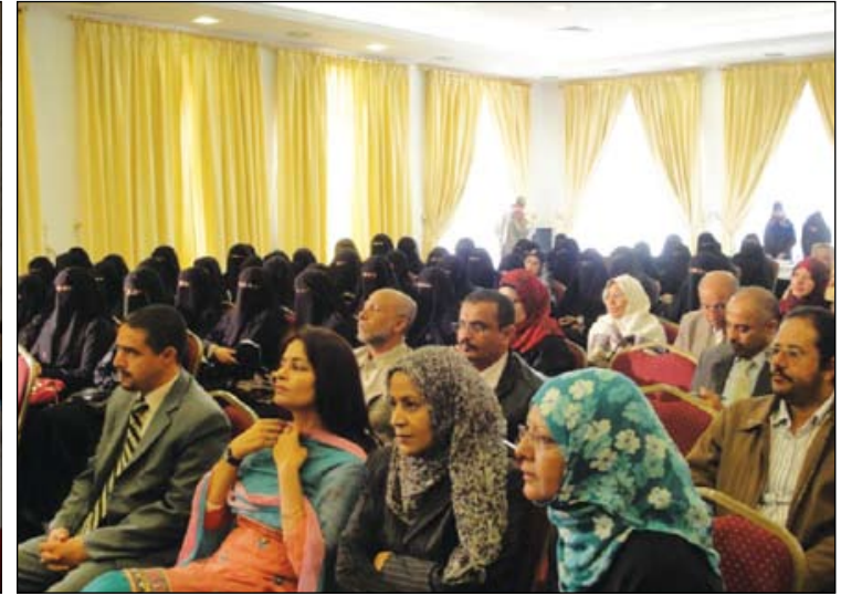
جانب من الحضور في الورشة