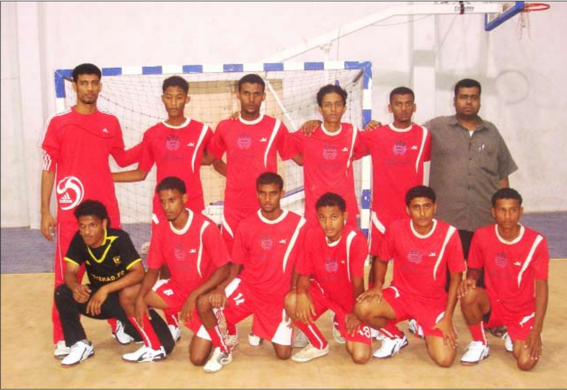
فريق الوحدة لكرة اليد