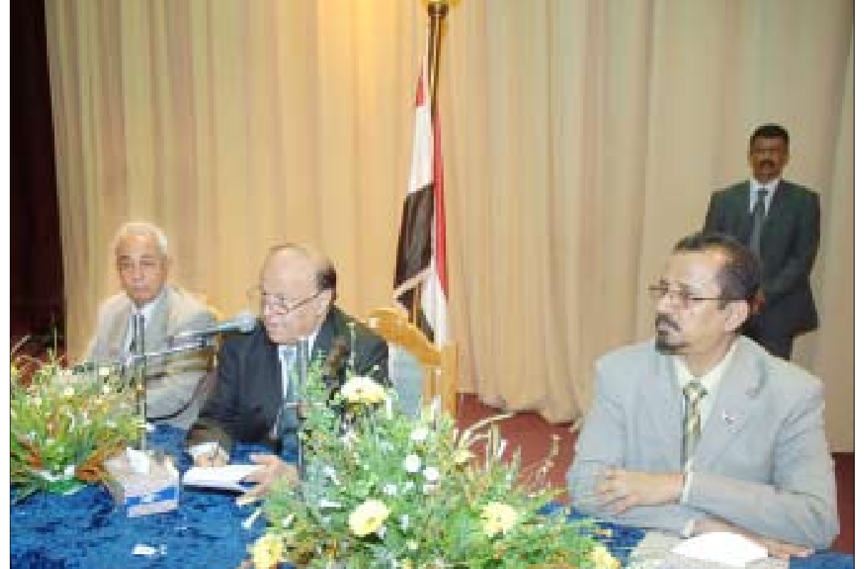
نائب الرئيس خلال لقائه قيادة محافظة الحديدة