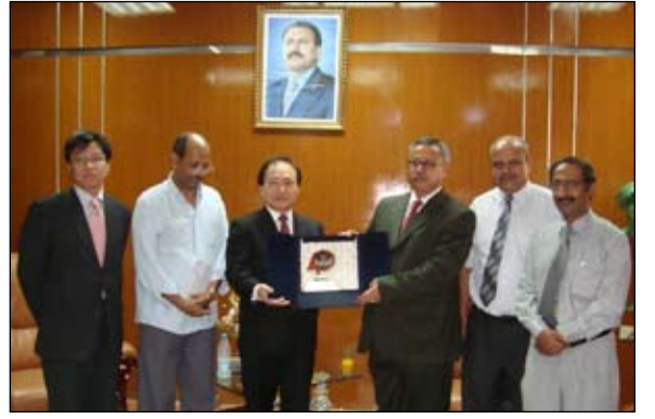
■ د.بن حبتور يمنح السفير الكوري الجنوبي درج جامعة عدن