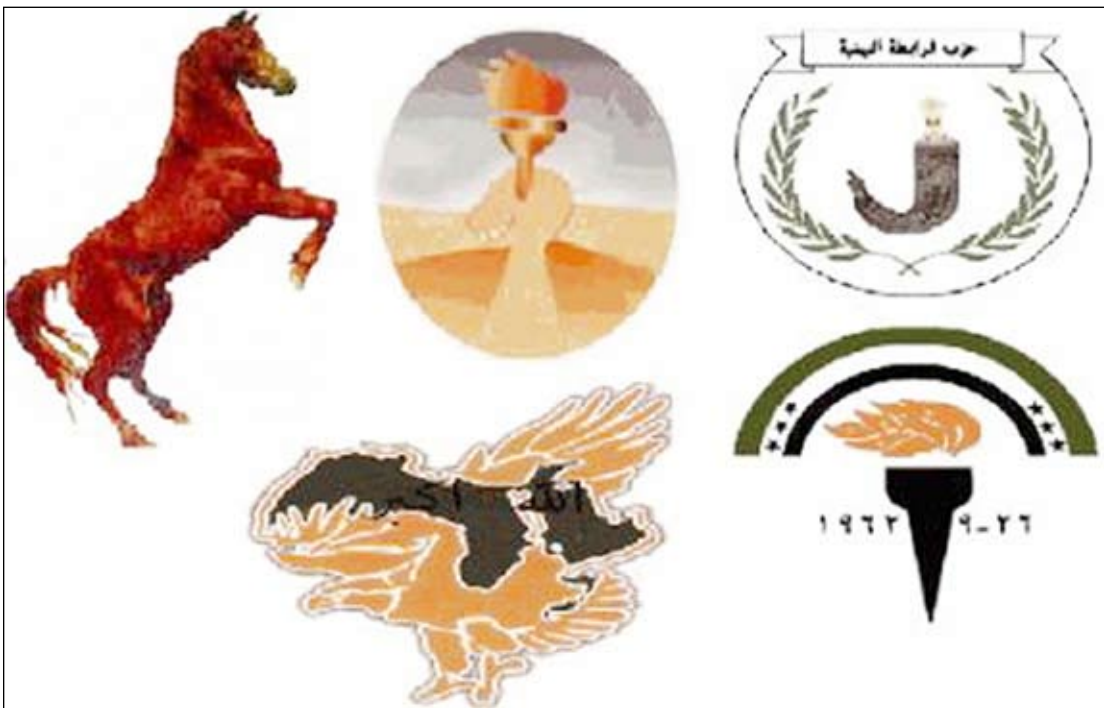
■ شعار أحزاب التحالف الوطني