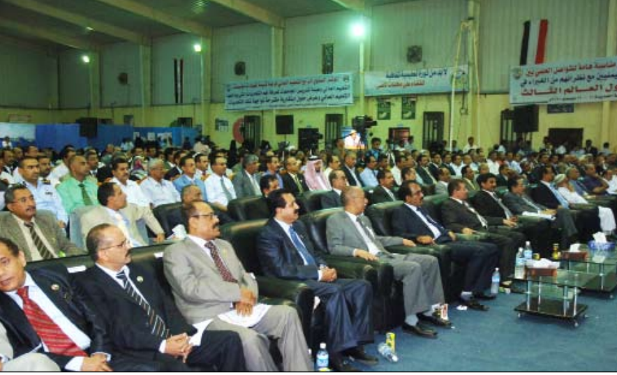
■ جانب من الحضور