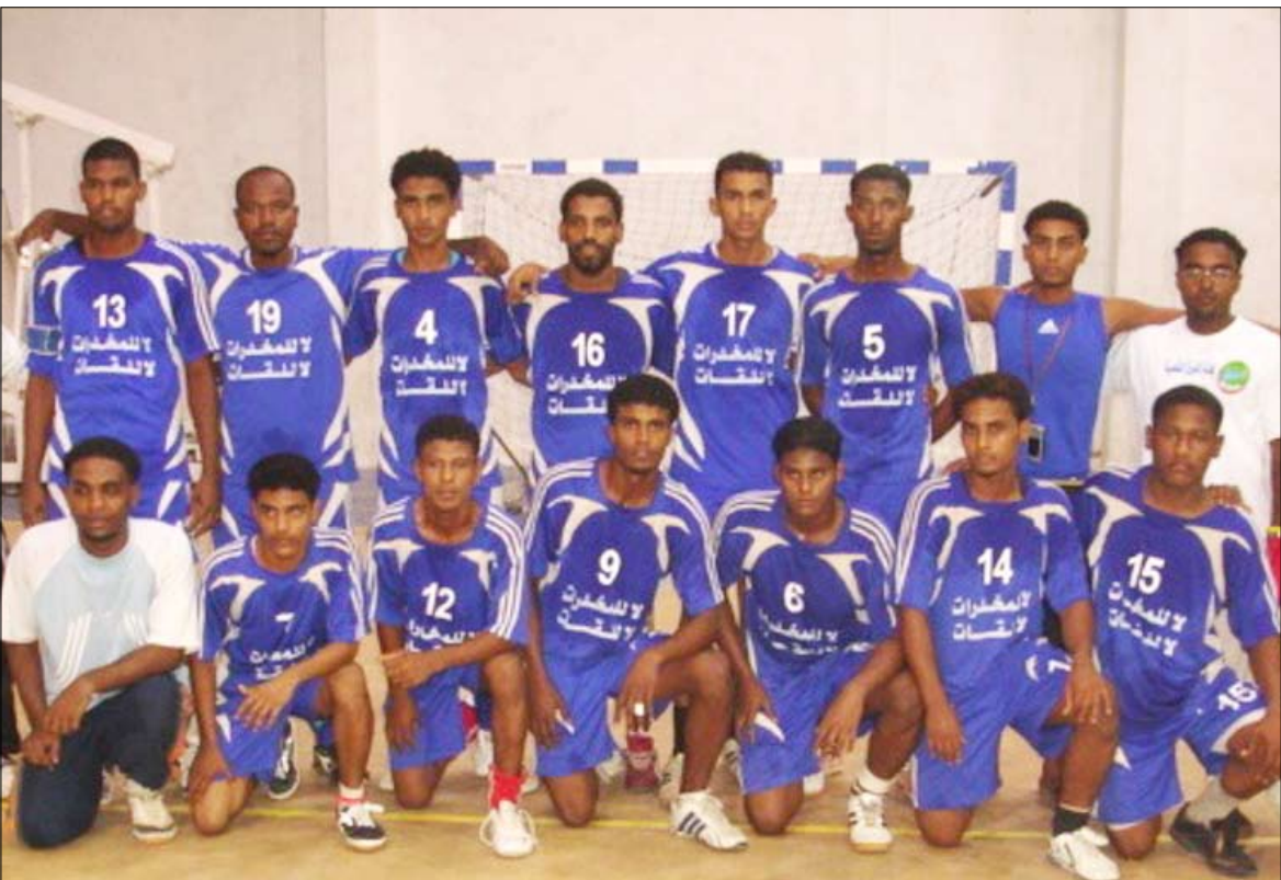
فريق التضامن لكرة اليد