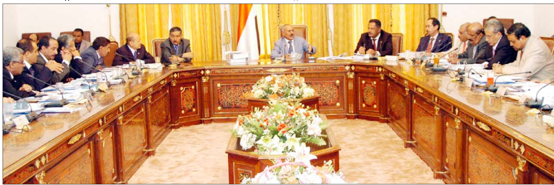
رئيس الجمهورية لدى ترؤسه اجتماع مجلس الوزراء وقيادات السلطة المحلية في محافظات عدن ولحج وأبين

عدن / سبأ وجه فخامة الرئيس علي عبدالله صالح رئيس الجمهورية الحكومة بالاستمرار في سياسة التقشف وترشيد الإنفاق وإنهاء حالات الإزدواج الوظيفي وتصحيح أي أوضاع مالية أو إدارية أينما وجد خلل فيها، ومكافحة أي حالات تنسب في العبث بالأموال العامة. وأكد فخامته خلال ترؤسه أمس في محافظة عدن جانباً من اجتماع مجلس الوزراء وقيادات السلطة المحلية في محافظات عدن، أبين، ولحج، ضرورة تطبيق الرقابة السليمة واللاحقة على عمليات الإنفاق وبخاصة ما ينصل بتنفيذ المشاريع والتأكد من مدى الحاجة الفعلية للمشاريع من عدمها، و تشديد الرقابة على المؤسسات ذات الاستقلال المالي والإداري وإخضاعها للتقييم المستمر. وشدد رئيس الجمهورية على ضرورة الاهتمام بالمنشآت الرياضية والمرافق الخدمية ومشاريع البنى التحتية التي تم إنشاؤها في إطار خليجي 20، والحفاظ عليها وصيانتها. وتطرق فخامته إلى الاجتماع القادم لمجموعة أصدقاء اليمن المقرر عقده في الرياض بالملكة العربية السعودية الشقيقة في الربع الأول من العام القادم.. موجهها الحكومة بالإعداد الجيد للأولويات التنموية التي سيتم عرضها على هذا الاجتماع وفقاً للاحتياجات وضرورات الواقع ومستقيم التنمية والتركيز بدرجة أساسية على قطاع الطاقة وزيادة حجم التوليد إلى 7 آلاف ميغاوات.. كما تضمنت توجيهات فخامته للحكومة تطوير البنية التحتية للمنطقة الصناعية بالمنطقة الحرة بـعدن وتحديد مصافي عدن وتحتية مياه البحر لإمدادات المياه لأمانة العاصمة صنعاء من الحديدة، وكذا تحلية المياه لمدينتي تعز واب، وإنشاء المزيد من المدن السكنية لذوي الدخل المحدود والإسراع في تجهيز كلية الهندسة بجامعة عدن. ( التفاصيل من 3 )