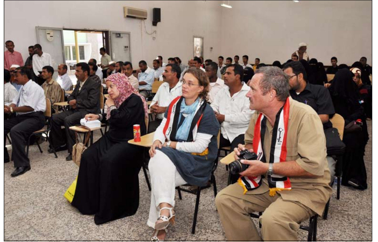
إعدان/نبيل غالب

في مجال طرق التدريس الحديثة بمركز تدريب المدربين لتكون نواة لسلسلة من ورش أخرى لتدريب المدربين في عدة محافظات. كما ألقى كذلك السيد الدكتور رودولف ممثل مؤسسة التعاون الفني (G.T.Z) كلمة استعرض فيها جوانب التعاون الثنائي الألماني في مجال التعليم الفني والتدريب المهني. يذكر أن المشاركين سيتلقون عددا من المعارف عن تحسين كفاءات المدربين والتركيز على برامج تدريب المدربين والتطوير الإداري والأداء لمدراء المعاهد والعمداء والاهتمام بالتخطيط للتعليم الفني ورفع القدرات المؤسسية للتعليم الفني والتدريب المهني.