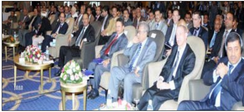
■ جانب من فعاليات المؤتمر العالمي الثاني من البن

الأصغر التابعة للصدوق الإجتماعي للتنمية، بمشاركة أكثر من 300 مشارك ومشاركة من المتخصصين في صناعة البن والمهتمين بالجودة في صناعة القهوة من أنحاء العالم وتجار البن وعدد من المزارعين- العديد من أوراق العمل والمدخلات في مجال تطوير وتنمية زراعة البن مقدمة من قبل خبراء ومهتمين محليين ودوليين في مجال زراعة البن وتصنيعه. وتعتبر اليمن الدولة الوحيدة في العالم التي تزرع فيها شجرة البن في ظل ظروف مناخية وبيئية لا تتماثل مع تلك التي تزرع فيها أشجار البن زراعة مرفهة في مناطق