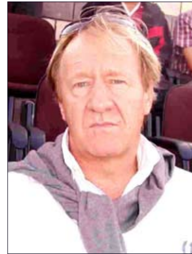
المدرب الكرواتي يوري ستريشكو

وأكد ستريشكو أن اتحاد كرة القدم لم ينفذ برنامج الإعداد الذي قدمه، وأنه لم يتمكن من العمل وفق أي برنامج قام بإعداده. وقال "الاتحاد لم يعمل على تنفيذ برامجي بالشكل المطلوب والمستوى المأمول وأجريت تعديلات كثيرة على البرامج والغيت أخرى وعدلت كثيراً مع المباريات الودية".