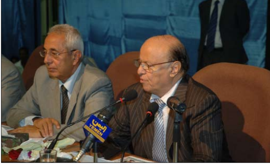
■ نائب الرئيس خلال حضوره افتتاح المؤتمر

وتطوير جوانب القوة والمحافظة عليها وتبني إنشاء لدعم الابتكار في التعليم العالي بما يمكن الجامعات من الوفاء بالتزاماتها في إعداد طلبة مبتكرين وباحتين مبدعين وبحث علمي متميز يؤسس لقدرة تنافسية عالية لليمن وأن يكون عنوان المؤتمر الخاص للتعليم العالي عن البحث العلمي في العام القادم (البحث العلمي في الوطن العربي: التحديات .. الرهائنات .. الفرص المستقبلية). وهدف المؤتمر - الذي نظّمته وزارة التعليم العالي على مدى يومين في جامعة الحديدة تحت شعار "تحديات التعليم العالي في الوطن العربي .. حلول ابتكارية" وافتتحه نائب رئيس الجمهورية عبدربه منصور هادي بحضور عدد من الوزراء ورؤساء الجامعات اليمنية والحكومية والخاصة بقاعة كلية التربية البدنية - إلى مناقشة مواضيع تقنيات المعلومات والاتصال الحديثة في التعليم العالي والابتكار في ضمان جودة التعليم العالي وتطوير نظام الموازنة ورفع كفاءة الجودة والاعتماد الأكاديمي في الجامعات اليمنية وترسيخ ثقافة الابتكار كمدخل لنقدية مشاريع التعليم العالي وتقديم موجهات التعليم العالي لاحتياجات التنمية ومتطلبات القطاع الخاص. ورفع المشاركون في اختتام فعاليات وأعمال المؤتمر برقية شكر وعرفان لفخامة الأخ علي عبدالله صالح رئيس الجمهورية على عانيته ودعمه للمؤتمر واهتمامه المتواصل بقطاع التعليم العالي في اليمن.