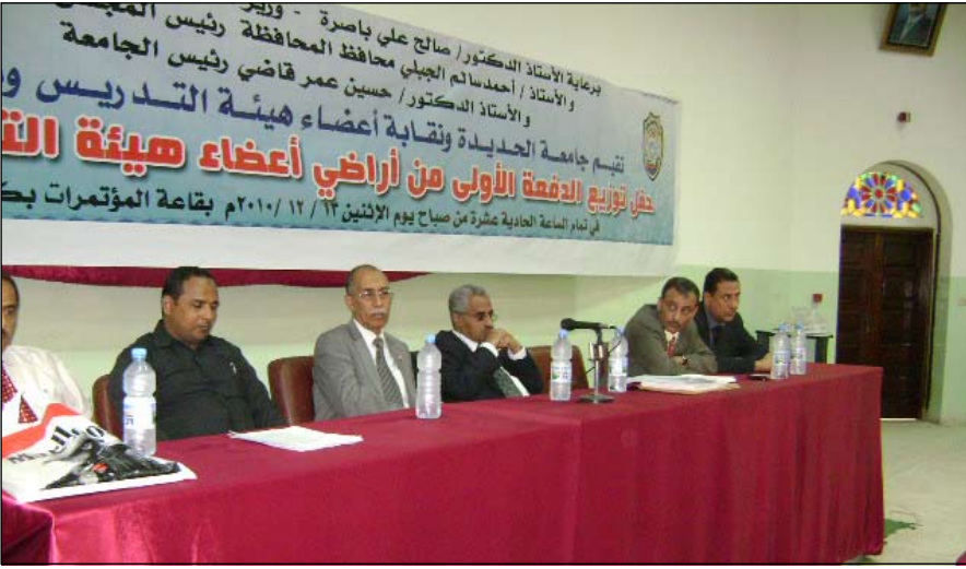
■ خلال تدشين توزيع عقود الاراضي