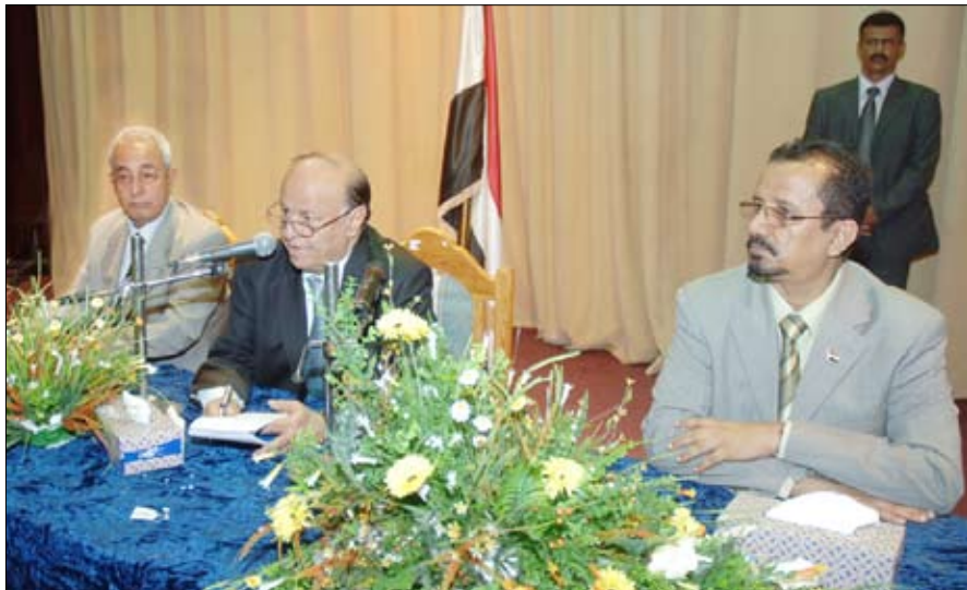
نائب الرئيس خلال لقائه السلطة المحلية بمحافظة الحديدة

الحديدة / سبأ: التقى الأخ عبد ربه منصور هادي نائب رئيس الجمهورية أمس بقاعة الفقيد يوسف الشحاري بالمركز الثقافي بالحديدة، رؤساء وأعضاء المجالس المحلية ومديري عموم المكاتب الحكومية ومديري عموم مديريات المحافظة والقيادات الإدارية والعسكرية والأمنية. وقال : " بعد اتفاق فبراير عام 2009م طلبوا تأجيل الانتخابات من أجل تهئية المسرح السياسي للانتخابات وبعدها طرحوا مشاكل بعض مديريات صعدة التي أثارها الحوثي، ومن ثم تحدثوا عن الحراك بصورة المختلفة ومطالبه المتنوعة التي يصل البعض منها إلى الخروج عن القانون والنظام وقطع الطرقات وكل له حساباته الخاصة " وأشار الأخ نائب الرئيس إلى أن المعارضة في العالم تقدم برامجها على أساس وطني وتطرحها