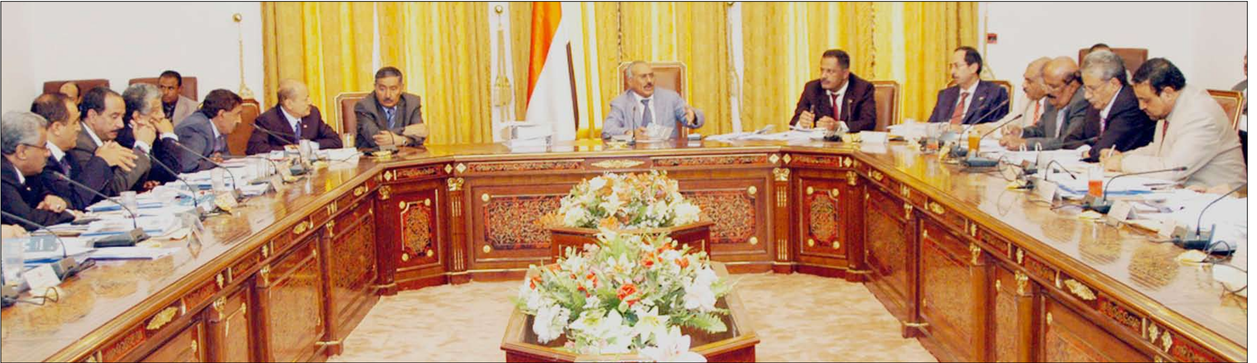
رئيس الجمهورية يترأس اجتماع مجلس الوزراء وقيادات السلطة المحلية في محافظات ( عدن وأبين ولحج )