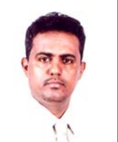
عبد القادر محوري

في زيارة استثنائية ويوم استثنائي تجلت فيها كل معاني الحب والوفاء .. كان وعد اللقاء والاتقاء بقاء ووطن حين حل ضيفا كبيرا وفعيا على أبنائه الأوفياء في أبنان الوحدة والوفاء .. بوابة النصر الودودي التي تعزز أيماننا بهذه الزيارة وهذا الوصف الذي أطلقه عليها فخامته.