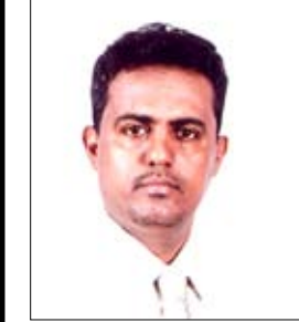
عبد القادر محوري

في زيارة استثنائية ويوم استثنائي تجلت فيها كل معاني الحب والوفاء .. كان وعد اللقاء والالتقاء بقاء ووطن حين حل ضيفاً كبيراً وفاقياً على أبنائه الأوفياء في أبنان الوحدة والوفاء .. بوابة النصر الودودي التي تعزز أيماناً بهذه الزيارة وهذا الوصف الذي أطلقه عليها فخامته.