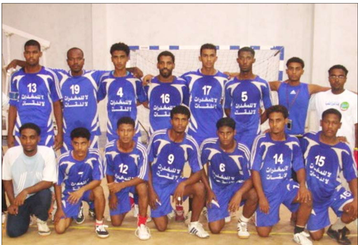
■ فريق التضامن لكرة اليد

وكان فريق التضامن الذي يسعى للعودة إلى الدرجة الأولى قد بدأ التدريبات مبكراً منذ أشهر بغية الوصول بالفريق للجاهزية الكاملة التي تمكنه من المشاركة الإيجابية في بطولة الدرجة الثانية والعودة إلى موقعه بين الكبار في دوري الدرجة الأولى دوري النخبة. الجدير بالذكر أن فريق التضامن لكرة اليد هو الفريق الوحيد من ساحل حضرموت في دوري الدرجة الثانية بعد أن هبط من الدرجة الأولى الموسم الماضي. على صعيد متصل بنشاط كرة اليد بدأ فريق كرة اليد بنادي وحدة الملا الرياضي تحضيراته واستعداداته للمشاركة في بطولة الجمهورية لأندية أبطال المحافظات برسم مباريات تجريبية.