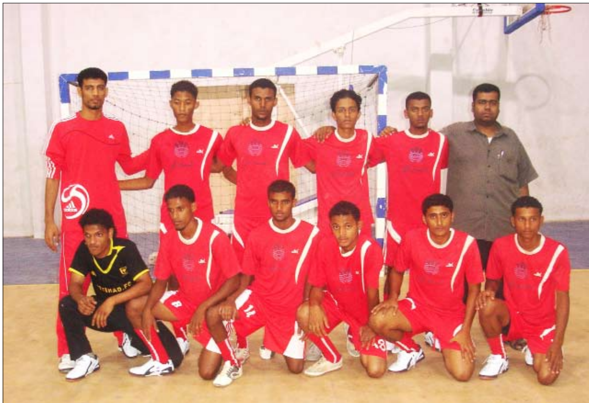
■ فريق الوحدة لكرة اليد