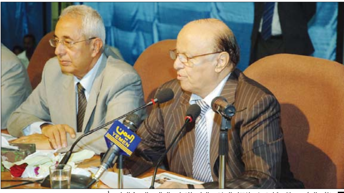
نائب الرئيس يلقي كلمته في افتتاح المؤتمر الرابع للتعليم العالي والبحث العلمي أمس