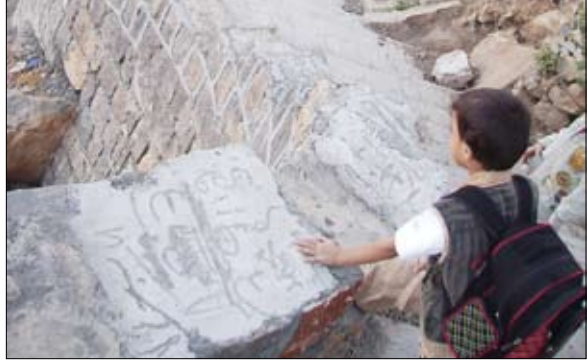
جانب من أعمال الرصف بمدينة حجة

أكد محافظ محافظة حجة المهندس فريد أحمد مجور أهمية إبراز المظهر الحضاري لمدينة حجة، ومعالجة أي معوقات قد تقف أمام المشاريع التطويرية التي تشهدها، وكذا تنسيق المهام بين السلطة المحلية والجهات الممولة في سبيل إنجاز المشاريع المعتمدة ضمن البرنامج الاستثماري ووفقاً للبرامج الزمنية المحددة .