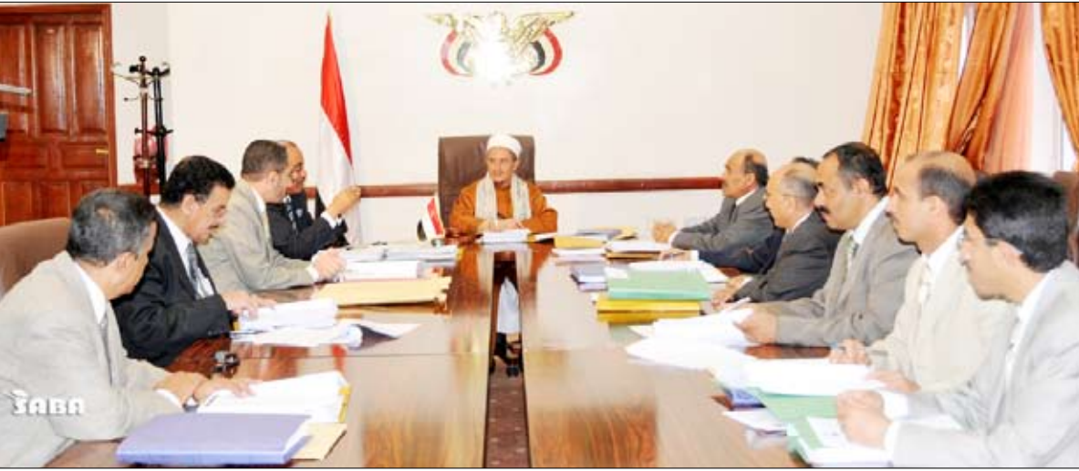
من الاجتماع الدوري لمجلس القضاء الاعلى

أعضاء النيابة العامة بعد أن انتهى مجلس المحاسبة ، وأقر المجلس حجز الموضوع للنطق بالقرار في جلسة قادمة. وعقد المجلس جلسة محاسبة لأحد مساعدي النيابة العامة للاستماع إلى دفاعه حول المخالفات المنسوبة إليه من هيئة التفتيش القضائي على أن تستكمل إجراءات المحاسبة في جلسات قادمة. ونظر المجلس في بعض التظلمات المرفوعة إليه واتخذ بشأنها القرارات المناسبة.