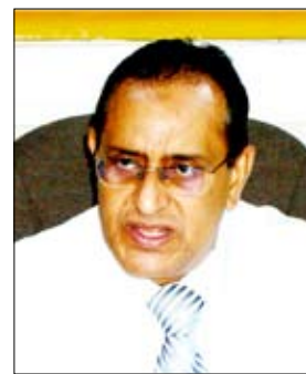
د. جمال خدابخش

□ عادل / ذكرى جوهري: أكد الأخ الدكتور جمال خدابخش الرئيس التنفيذي رئيس مجلس إدارة هيئة مستشفى الجمهورية العام النموذجي في عدن أن المستشفى خلال فعاليات (خليجي 20) لم يتسلم أية حالة للاعبين المشاركين في البطولة الخلية.