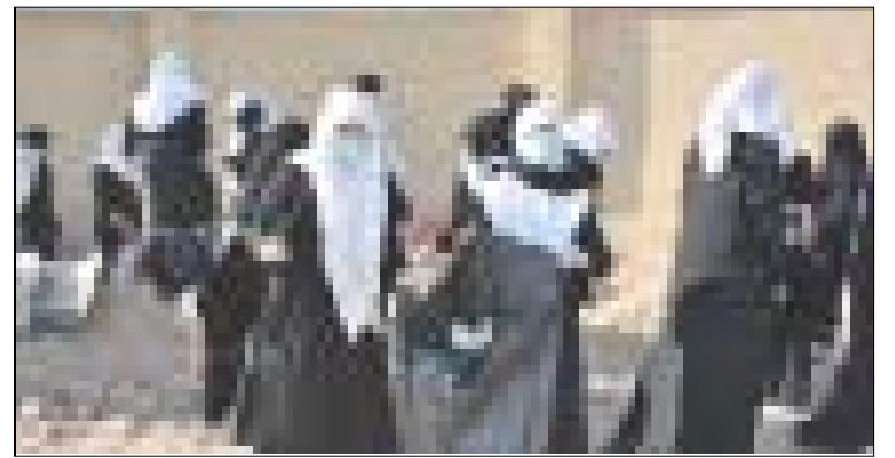
من حملة النظافة