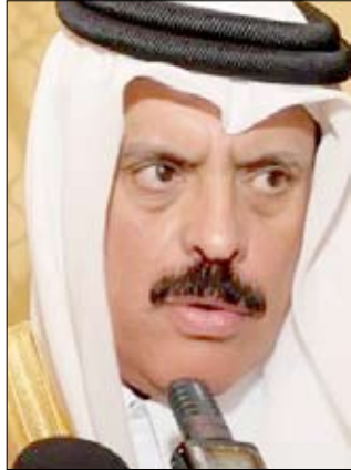
عبد الله بن حمد العطية

الغاز الآن إلى كندا، وترسل شحنات إلى المكسيك وتشيلي والأرجنتين ودول أخرى في آسيا وأوروبا، وبسبب هذه المرونة في الإنتاج والنقل يمكن لقطر إيصال الغاز إلى أي زبون في العالم حتى في اليوم التالي للطلب.» وقتل العطية من أهمية التقارير التي تشير إلى ارتفاع أسعار النفط لحدود مائة دولار للبرميل عام 2012، مشدداً على أن المستوى الحالي للأسعار عند 80 دولاراً مناسب جداً لأن المصدرين «بحاجة لمستهلكين أقوى لتحقيق الأرباح.» كما شكك العطية في صحة التحذيرات من نقص في إنتاج النفط خلال السنوات المقبلة قائلاً: «أعضاء منظمة الدول المصدرة للنفط (أوبك) لديهم أكثر من 70 في المائة من احتياطات النفط العالمية، وهناك كميات أكبر من الباحة في السوق، وأظن أن العالم لن يشهد نقصاً في الطاقة حتى خلال السنوات الخمسين أو الستين المقبلة.»