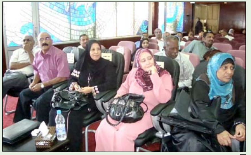
من فعاليات الندوة العلمية