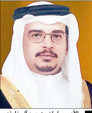
الأمير سلمان بن حمد آل خليفة

المنامة/ متابعيات : تناول الأمير سلمان بن حمد آل خليفة ولي عهد البحرين نائب القائد الأعلى خلال استقباله الجنرال ماتيويس قائد القوات المركزية الأمريكية والسيد الكزاندر فيرشيو مساعد وزير الدفاع الأمريكي أهم الجوانب الضرورية لإحلال أنظمة أمنية تصون استقرار المنطقة بشكل خاص والعالم بشكل عام. وأوضح الأمير سلمان موقف مملكة البحرين الداعم للعمل وفق الأنظمة والمعاهدات الدولية والمؤكد الالتزام بالمواثيق الأمنية المبنية على الاحترام والثقة فالبحرين بلد لم يعرف إلا الأمن والاستقرار وشعبه لا يعرف إلا العيش بأمان. وأثنى في سياق حديثه على ما يطرحة حوار المنامة 2010 من مواضيع تعزز المبادئ الأمنية مشيدا بدور الولايات المتحدة الأمريكية في استقرار المنطقة ومساهمتها في دعم أمنها كبلد صديق تجمعت به علاقات قديمة لعقود مضت. وقد عبر قائد القوات المركزية الأمريكية ووزير الدفاع الأمريكي عن اعترازهما بمشاركتها في أعمال حوار المنامة الذي يعد واحدا من أهم الملتقيات العالمية الذي يتناول أهم عصب في عصرنا اليوم ألا وهو عصب الاستقرار والأمان باعتباره الدرع الواقية لبرامج التنمية سواء البشرية أو الحضرية أو الاقتصادية أو السياسية مشيدا بدور مملكة البحرين في تنظيم هذه القمة وبالمشاركة الثرية التي تعبر عن التوجه العالمي لتذليل كل ما يعيق البرامج الموجهة للإنسانية والتي تحقق رخاءه ونهضته. كما تناول اللقاء واقع ومستقبل العلاقات الثنائية التي تربط مملكة البحرين بالولايات المتحدة الأمريكية بالإضافة إلى مواصلة التنسيق وتبادل الآراء والتعاون العسكري.