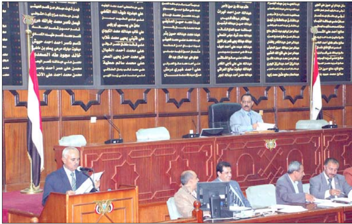
من جلسة مجلس النواب أمس

هنا مجلس النواب في جلسته أمس برئاسة رئيس المجلس يحيى علي الزاعي القيادة السياسية وجماهير الشعب اليمني في عموم محافظات الجمهورية وكل منتسبي المؤسسة الوطنية للدفاع والأمن البواسل بمناسبة حلول السنة الهجرية الجديدة.