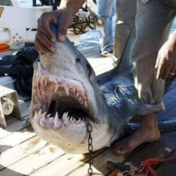
سمكة قرش قال غواص مصري التي هاجمت السائحين في شرم الشيخ

وتابع أن السلطات أخلت الشواطئ القريبة من السائحين.