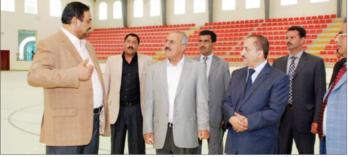
رئيس الجمهورية أثناء افتتاحه الصالة الرياضية المغلقة بعدن أمس

عدن / سيا: قام فخامة الأخ الرئيس علي عبدالله صالح رئيس الجمهورية أمس بافتتاح صالة الصالح الرياضية المغلقة بالعاصمة الاقتصادية والتجارية عدن . وتتسع الصالة لثلاثة آلاف شخص وتتكون من العديد من المرافق الخاصة بالعب كرة الطائرة والتنس والسلة والعب القوى وغيرها. وتتم تجهيزها لتكون صالة متعددة الأغراض وتبلغ الكلفة الإجمالية للمشروع الذي يخدم الحركة الرياضية في المحافظة أربع مائة مليون ريال. وقام فخامة الأخ الرئيس بعد ذلك بزيارة إلى مستشفى باصهيب العسكري ومستشفى 22 مايو العام وأطمأن على أحوال المرضى الذين يتلقون العلاج بالمستشفى وتبادل الأحاديث معهم، مطمئنا على صحتهم جميعا ومتمنيا لهم جميعا الشفاء والعافية. واشاد فخامة الأخ الرئيس بما شهده مدينة عدن من توسع في مجال الخدمات الطبية وكذا التوسع في التخصصات الطبية ومستوى الخدمات التي تقدم للمرضى.