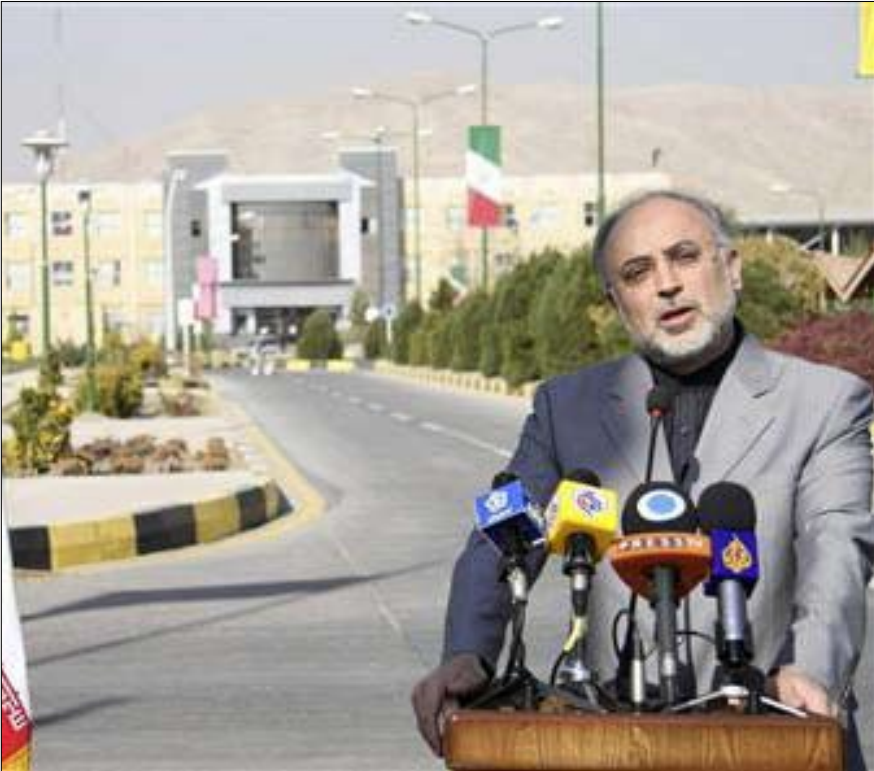
علي أكبر صالحى رئيس هيئة الطاقة الذرية الإيرانية يتحدث في أصفهان يوم أمس الأحد.