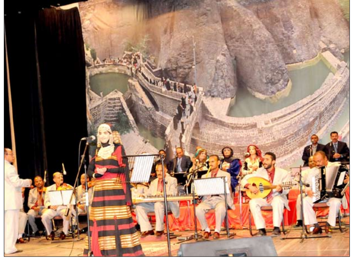
من الحفل الفني الساهر بعيد الأستقلال

استراتيجية للاحتفاء بهذه المناسبة الوطنية تستحضر الرموز السياسية والثقافية والنضالية وتعطيهم أماكنهم الحقيقية في تصدر هذه الاحتفاءات عبر التركيز على إبداعاتهم وأدوارهم النضالية وإعادة صياغة منجزهم الإبداعي في ميادين النضال والكفاح وتقريبه إلى الأجيال الجديدة ليكفوا قريبين مما جرى في الأمتس النضالي وتستمر جذوة الحرية والانتماء في أعماقهم مشتعلة. وقدم في الحفل عدد من الأغاني والأناشيد والمقطوعات الشعرية المعبرة عن المناسبة.