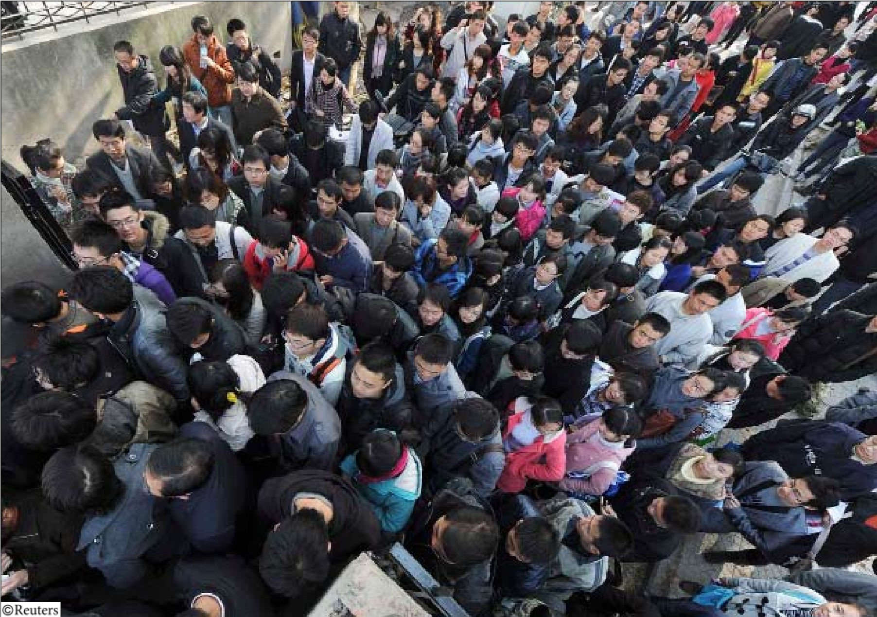
المئات في هونج كونج يطالبون بالإفراج عن ليو الفائز بجائزة نوبل