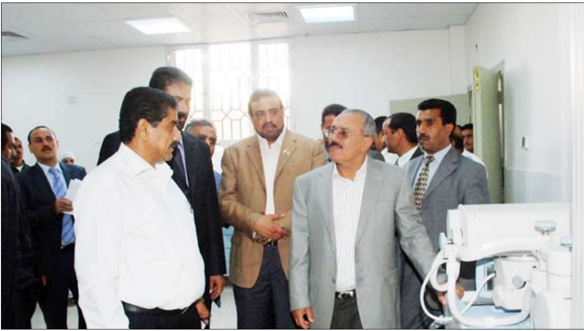
... ويزور مستشفى 22 مايو العام

وتم تجهيزها لتكون صالة متعددة الأغراض وتبلغ الكلفة الإجمالية للمشروع الذي يخدم الحركة الرياضية في المحافظة أربع مائة مليون ريال.