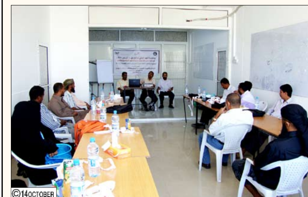
من برنامج مكافحة عمالة الأطفال

إعادة وحماية 1417 طفلاً وطفلة موزعين على مدارس مستقبل أفضل وحياة كريمة. تجدر الإشارة إلى أن البرنامج في عدن استطاع خلال العامين الدراسيين 2009 - 2010 و 2010 - 2011م