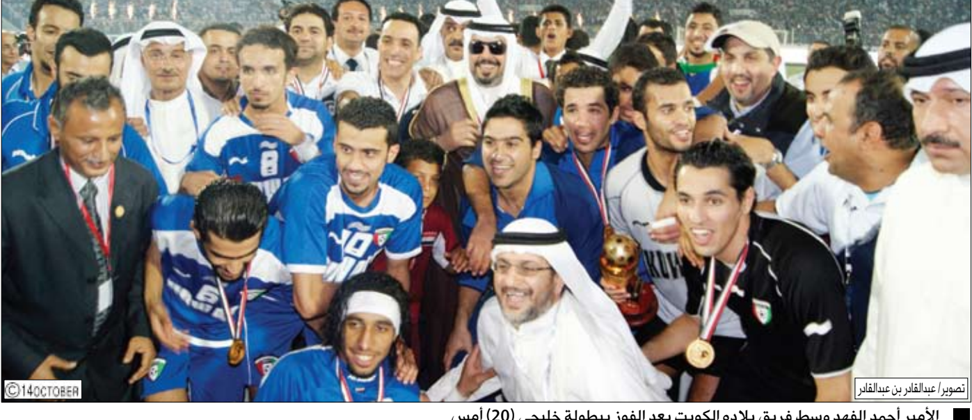
الأمير أحمد الفهد وسط فريق بلاده الكويت بعد الفوز ببطولة خليجي (20) أمس