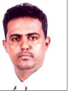
عبد القادر المحوري

واليوم نراه على الموعد كعادته أيضاً لا يتأخر عن عدن أبداً حاملاً معه كعادته نسائم الحب وبشائر الفرح .. لهذه المدينة والوطن عموماً والتي خصها وفاء وتكريماً لها ومعها أبين ولحج باستضافة الجميع بأنه صاحب الفضل الأول والأخير بعد الله سبحانه وتعالى في إنجاحها وفي العاصمة الاقتصادية والتجارية عدن تحديداً ومتابعته الخفيفة لأدق تفاصيل العمل والنجاح ونزوله الميداني للوقوف على المنشآت العملاقة التي حظيت بها هذه المحافظات الأبية التي لم ولن تخذله أبداً .. وهو صانع مجدها الحديث .. وقد تجسد ذلك يقيناً من خلال الالتفاف الجماهيري الكبير والحضور المذهل في ملعب 22 مايو في عدن والوحدة في أبين يسمع صدى صوت الجماهير والوحدة الوفية بالروح بالدم بنفديك يا يمن .. نهم إنها مع الرئيس المحب لها ووطنه والذي قال عنها بالأمس ومن قاعة فلسطين احتفاءً بالثلاثين من نوفمبر يوم الاستقلال المجيد .. (أحيى عدن اليأسلة وأبين البطلة ولحج الأحرار) نعم إنها كلمات من القلب اعترافاً ووفاءً لأبناء هذه المحافظات التي انتصرت للوطن .. للوحدة .. للإجماع الوطني ووجهت صفة قوية لمن يراهن على غير ذلك .. والعبارة لمن يعتبر!!