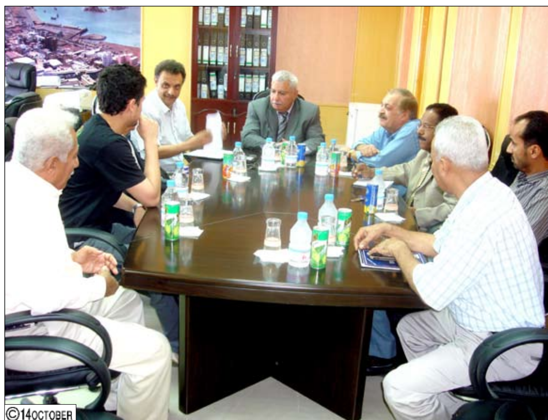
حلال توقيع مذكرة تفاهم بين الجمعيات السكنية والشركة التركية

المشاريع وتوفير الاستقرار الذي يستحقه المواطن في هذه المحافظة كواحد من أسسط حقوقه المشروعة.