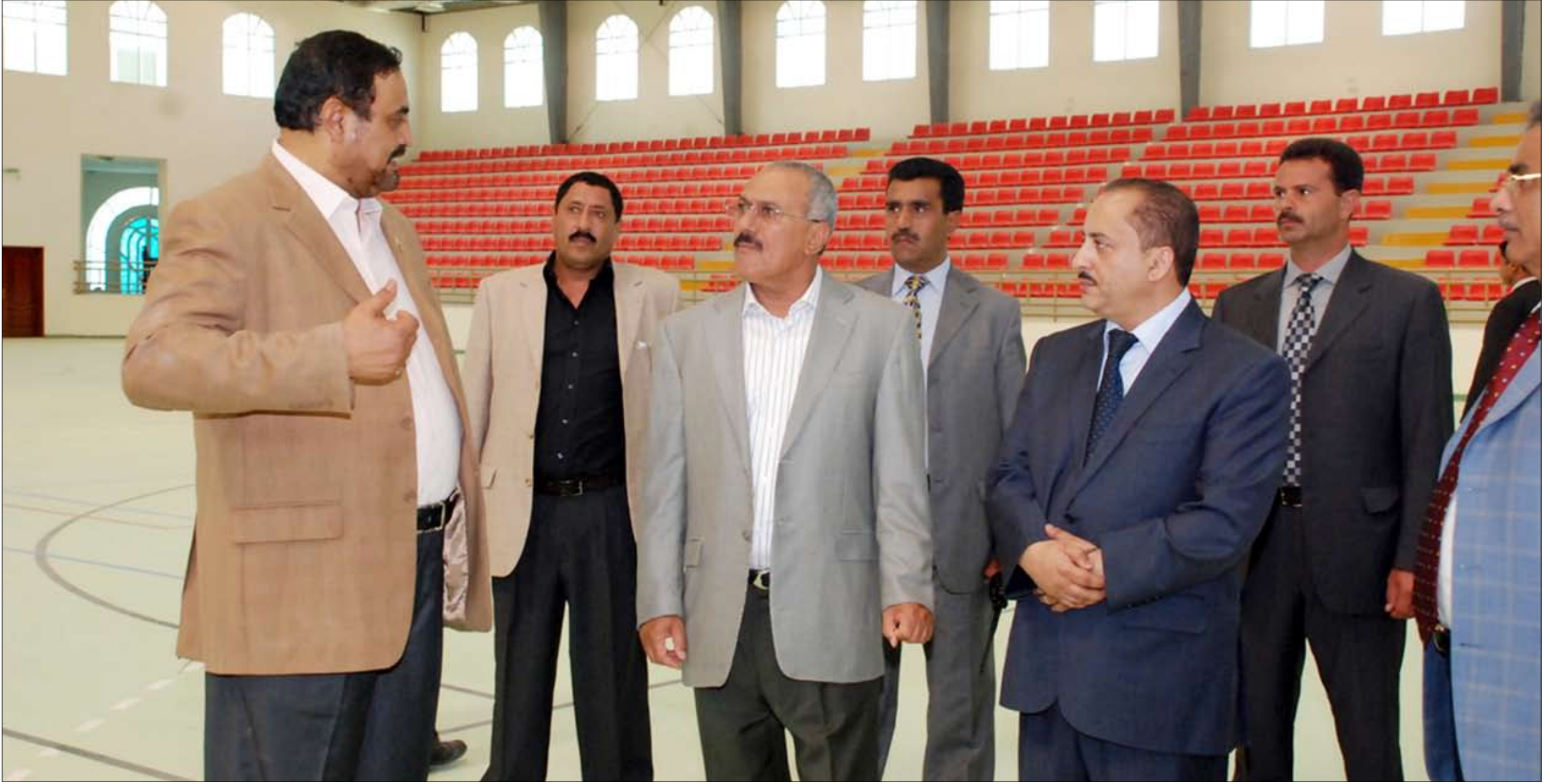
رئيس الجمهورية لدى افتتاحه الصالة الرياضية المغلقة أمس