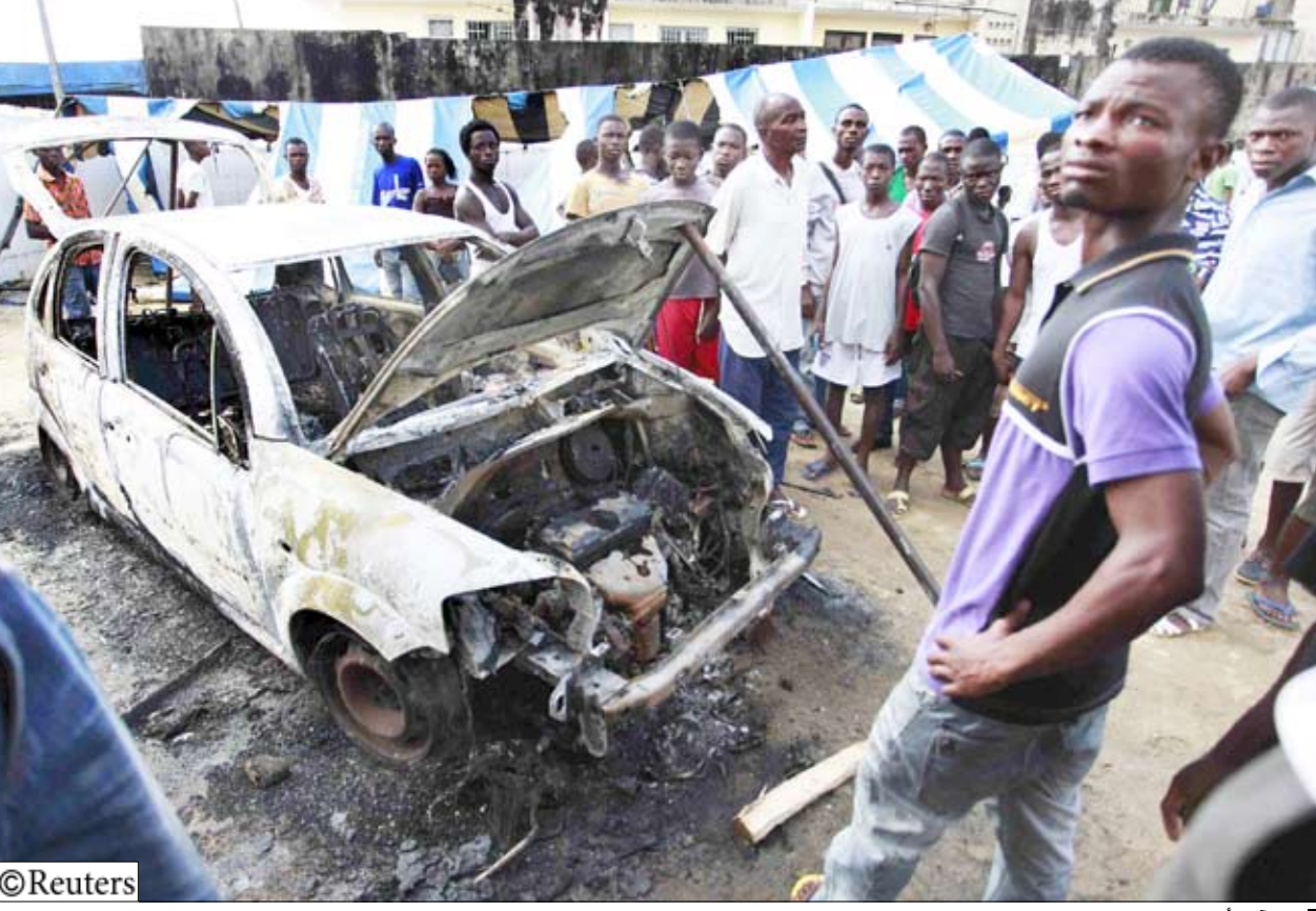
من أثار أعمال العنف في ساحل العاج