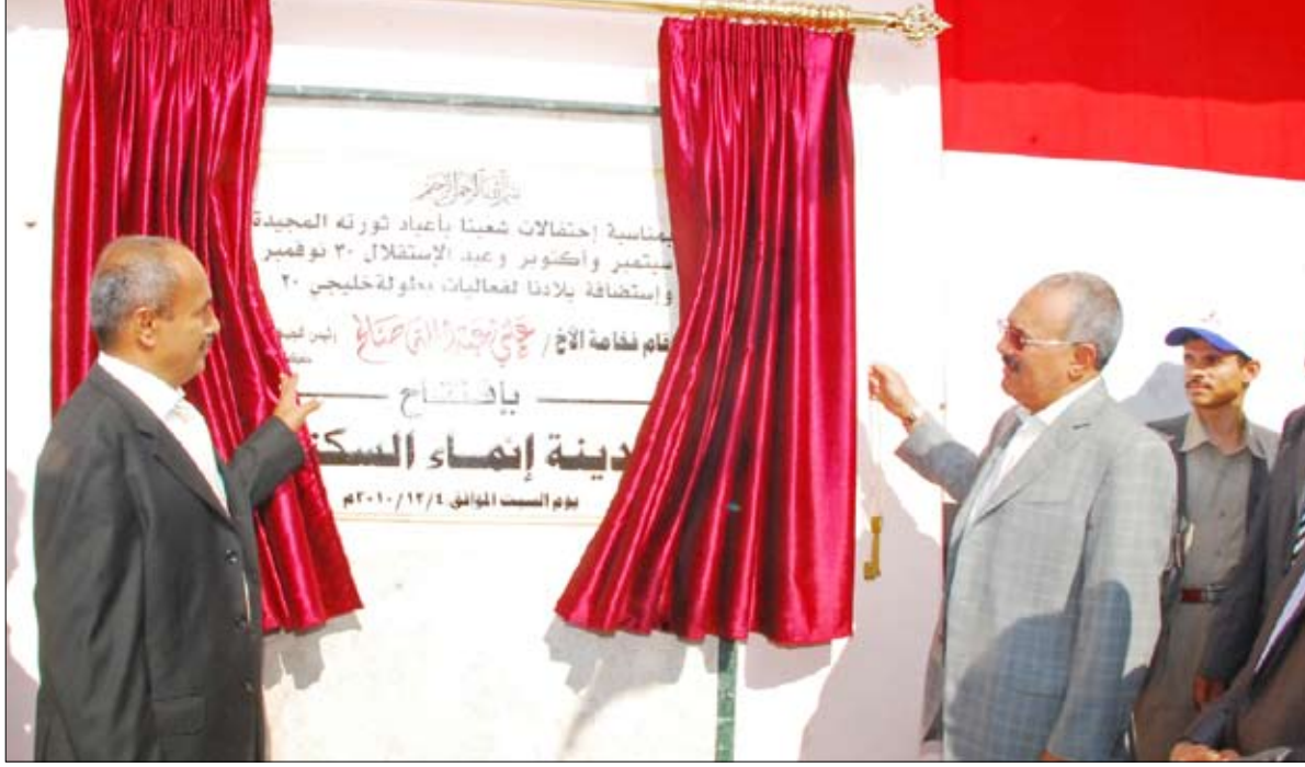
رئيس الجمهورية لدى افتتاحه مشروع مدينة إنماء السكنية

عدن / متابعات: برعاية فخامة الأخ الرئيس علي عبدالله صالح رئيس الجمهورية اختتم اليوم الأحد على ملعب الـ "22 من مايو" بعدن فعاليات بطولة خليجي 20 التي تستضيفها اليمن خلال الفترة من 22 مايو إلى 5 ديسمبر الجاري. وقال وزير الشباب والرياضة حمود عباد في تصريح خاص لـ "26 سبتمبر نت" إن حفل الختام الذي سيشهد مباراة النهائي بين منتخب الكويت والسعودية سيتم فيه تكريم المنتخبين الفائزين بالمركز الأول والثاني وتكريم أفضل اللاعبين في البطولة إضافة إلى المنتخب صاحب اللعب النظيف وأفضل وأضاح وزير الشباب والرياضة أنه سيتخلل الحفل الختامي تقديم وصلات غنائية، يؤدها الفنان الإماراتي الكبير حسين الجسمي بين شوطي مباراة الكويت والسعودية كما يحيي الفنان الجسمي مساء اليوم الأحد حفلاً غنائياً للفوز بكأس خليجي 20.