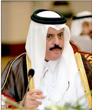
عبد الرحمن العطية

ودعا الأسرة الدولية ومجلس الأمن على وجه الخصوص إلى تحمل مسؤولياتها كاملة والتدخل بحزم لمنع مثل هذه الممارسات العدوانية المتواصلة التي تشكل تهديدا للأمن والسلام والاستقرار من جهة وتنسف أي محاولات لاعادة المفاوضات من جهة أخرى. وجدد الأمين العام لمجلس التعاون دعم دول المجلس للشعب الفلسطيني وقضيته العادلة من أجل استرداد حقوقه المشروعة واقامة دولته المستقلة وعاصمتها القدس الشرقية.