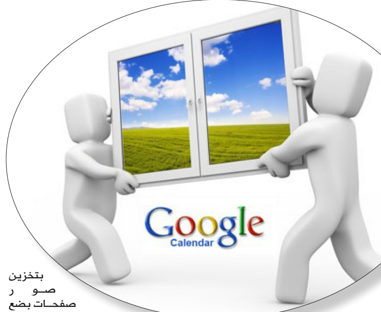
بتحزين صور صفحات بضع

المستخدمين، تمنى التغلب عليها عن طريق (Instant Preview). حالياً تقوم (جوجل) أيضاً بتظليل الكلمات البحثية أو مفاتيح البحث في نتائج البحث المعروضة على المستخدمين، وذلك للتعرف على السياق ومن التحديثات الأخيرة التي قدمتها (جوجل) هو (Google Instant) الذي يدخل المواقع، ولمعرفة هل هذا هو ما يوافق اهتمامه ويبحث عنه أم لا، ما يؤدي أيضاً إلى تحسين عملية البحث على الإنترنت وزيادة سرعة الوصول إلى نتائج دقيقة فيها بشكل أكبر. وبالنسبة للخدمة الأخيرة التي تقدمها (جوجل) (Instant Preview)، فقد صرحت الشركة بأنها سوف تقوم