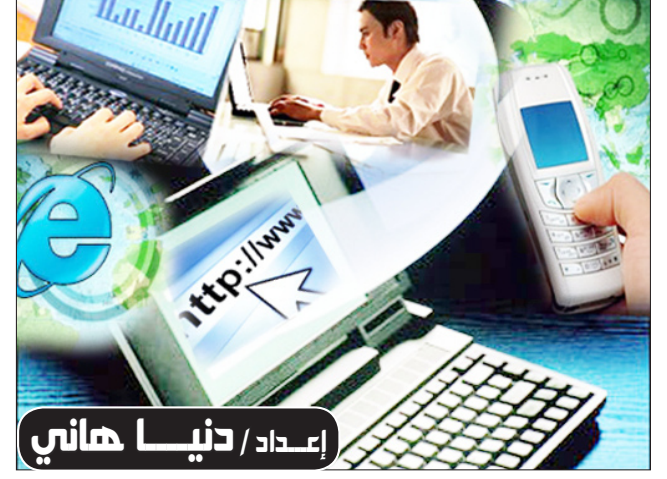
إعداد / دنيا هاني

الدنيا/منايات: سبب احترام الكثيرين (لستيف وازنيك) هو صراحته حول القضايا التقنية، ورغم أنه المؤسس الثاني لأبل ويحصل على نسبة من الأرباح نظراً لأنه يمتلك أسهماً في الشركة إلا أنه لا يجامل شركته ولا يقوم بالتسويق لها طوال الوقت مثل ستيف جوبز، ولكن هل انتقد وازنيك نظام الآيفون وأعلن فوز أندرويد. الحديث الذي جاء في مقابلة مع صحيفة (دي تيليجراف) الدنماركية جاء فيه أن (ستيف وازنيك) يظن أن نظام أندرويد بدأ في الفوز وأنه سيصبح