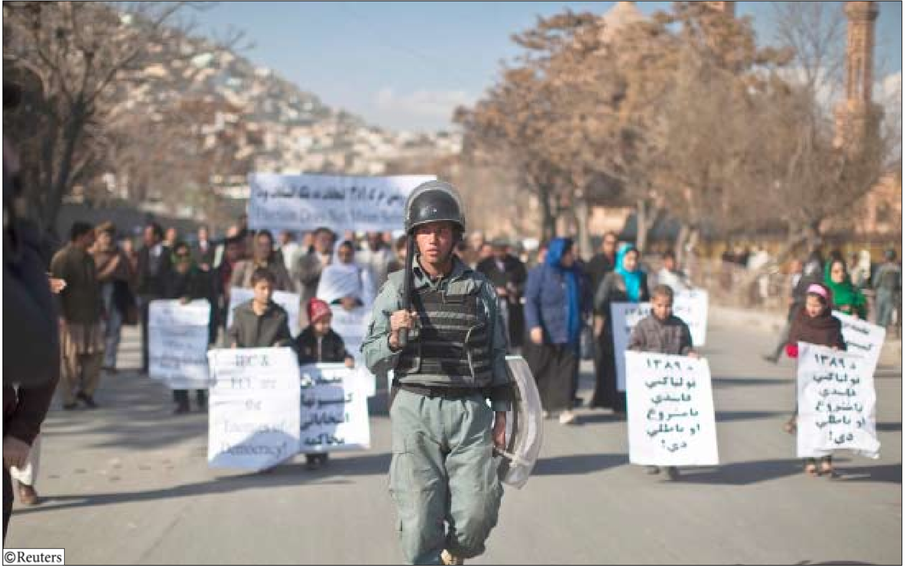
جانب من الاحتجاجات على نتائج الانتخابات الأفغانية أمس