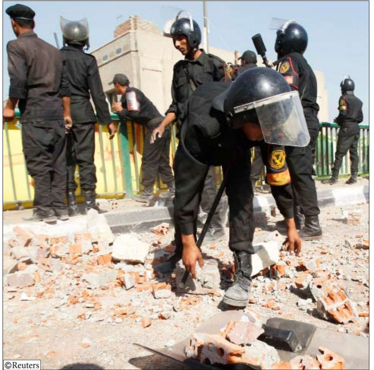
تفريق مظاهرة احتجاجية