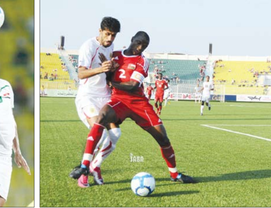
من مباراة منتخب الإمارات والعراق