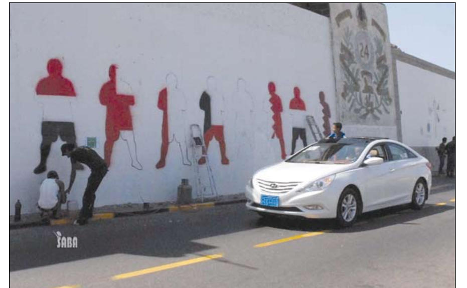
من المظاهر الفرائحية في عدن قبل انطلاق البطولة

نوفمبر - 5 ديسمبر 2010، وهنا ترصد الصورة الكثير من تفاصيل المشهد الفرائحي بالمناسبة والأعمال الدؤوبة الجارية لتزيين الشوارع باللوحات الدعائية والجداريات الترحيبية التي