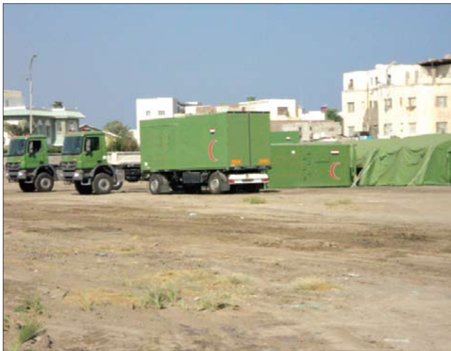
جانب من معدات المستشفى المتنقل