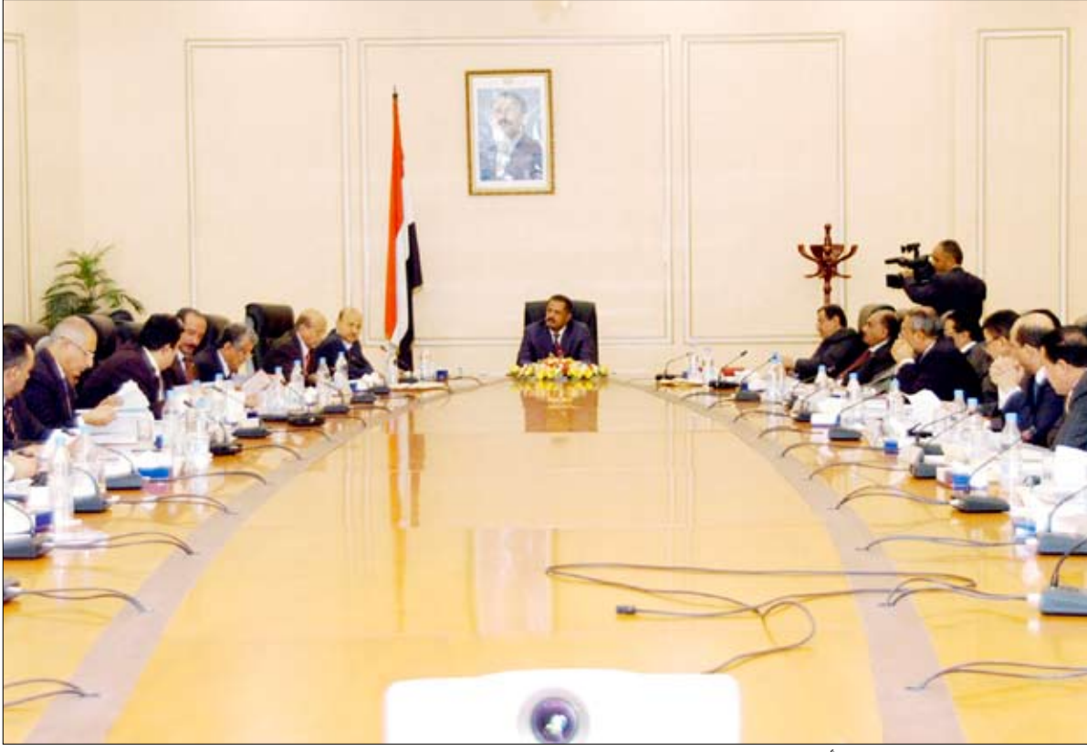
مجلس الوزراء في اجتماعه أمس

وأوضح مشروع التعديل أن قانون العلم الوطني النافذ افتقر إلى مسائل جوهرية ومهمة تتعلق بمكانة العلم الوطني وما يجب أن يحظى به من احترام وسمو أمام الجميع كونه رمزاً لسيادة واستقلال الجمهورية اليمنية ومعبراً عن روح وتاريخ وكرامة وولاء شعبها.. مبيناً أن أهم المسائل التي افتقر إليها القانون النافذ تمثلت في إغفال توضيح مدلول العلم الوطني وما تحمله ألوانه من معان، وعدم تحديد وذكر العلم الخاص برئيس الجمهورية وما يميزه عن العلم الوطني وإغفال تحديد محظورات استخدام العلم الوطني.. لافتاً إلى أن هذا التعديل استوعب المسائل التي لم يتطرق إليها القانون النافذ بإضافة مواد جديدة ودمج وتعديل مواد أخرى .