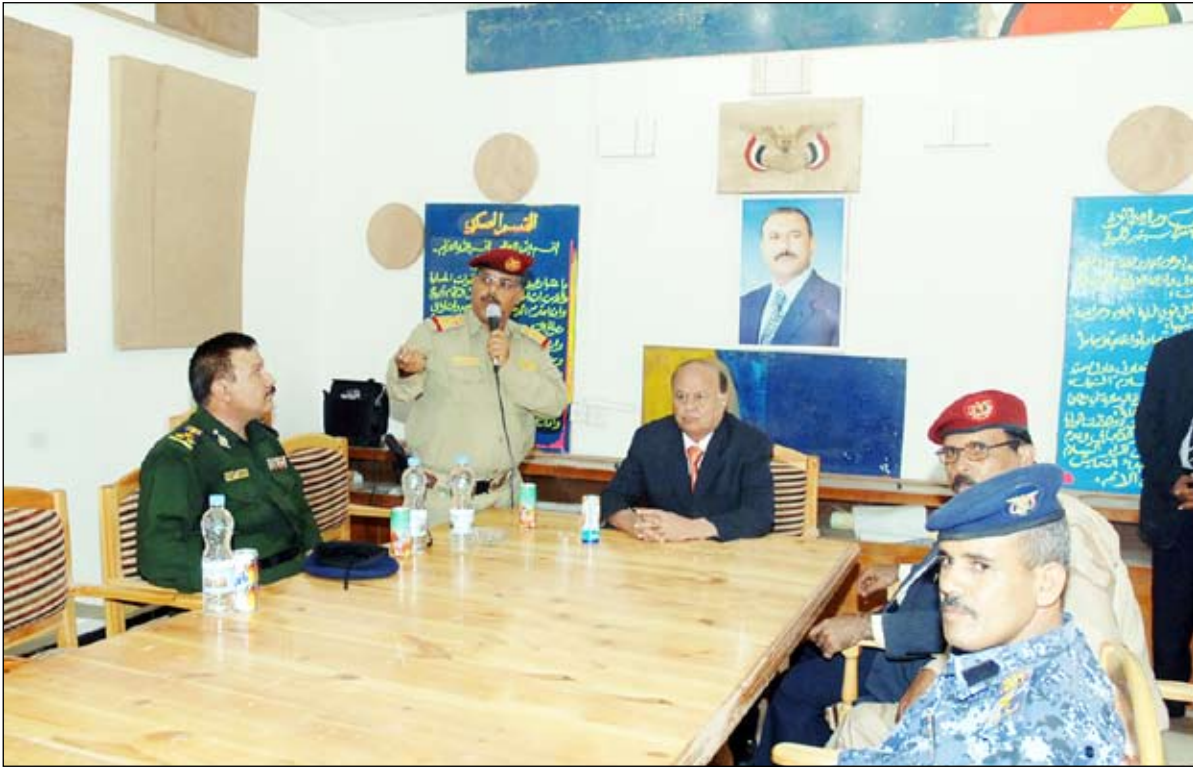
.. ويوزر غرفة العمليات المشتركة في اللواء (25) ميكا