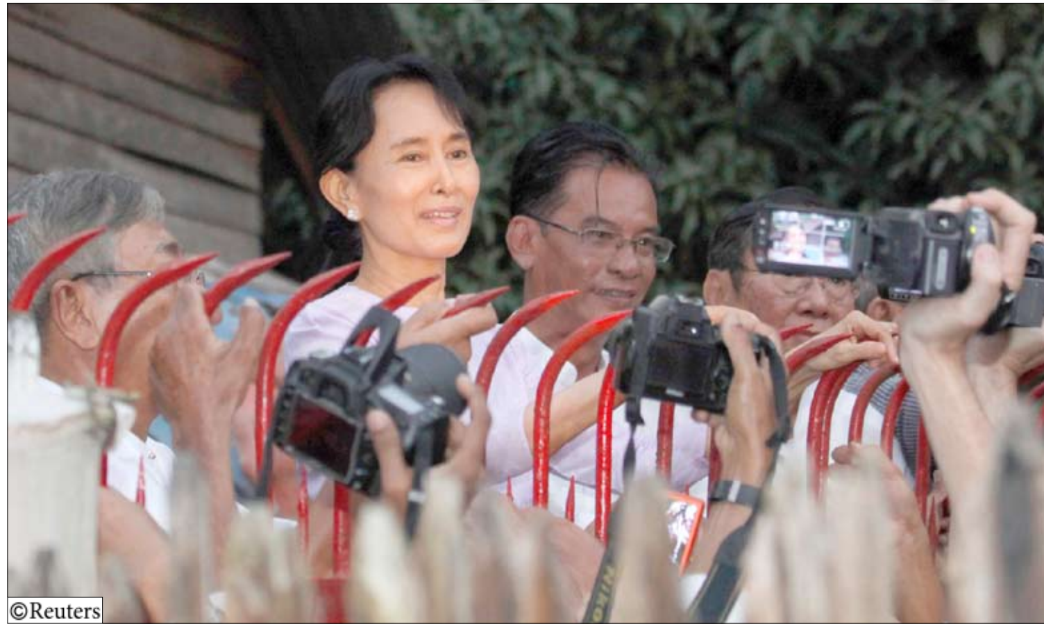
سوكي تتحدث إلى أنصارها في مقر حزب الرابطة القومية من أجل الديمقراطية في بانجون يوم أمس