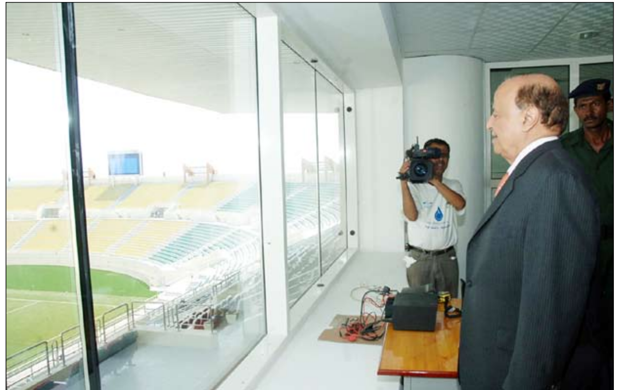
.. ويتفقد غرف الإعلام والتصوير في ملعب الوحدة بأبين