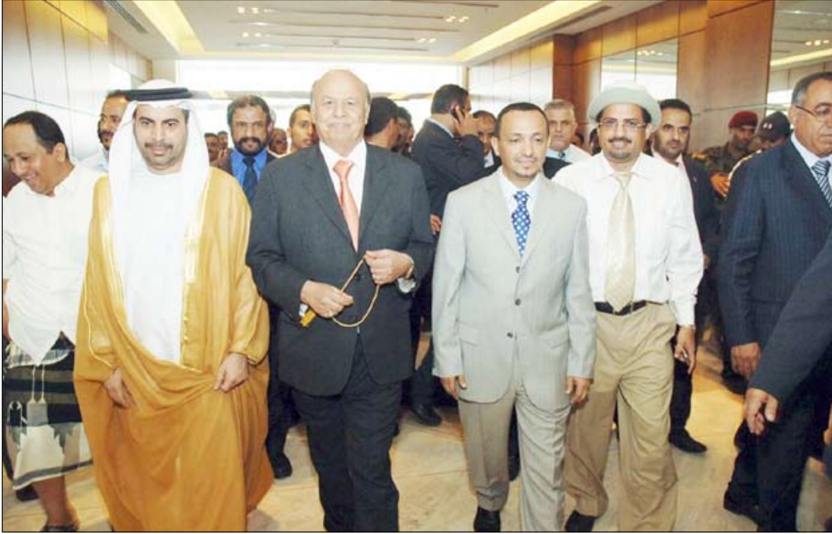
.. ويطوف بعدد من أجنحة فندق عدن