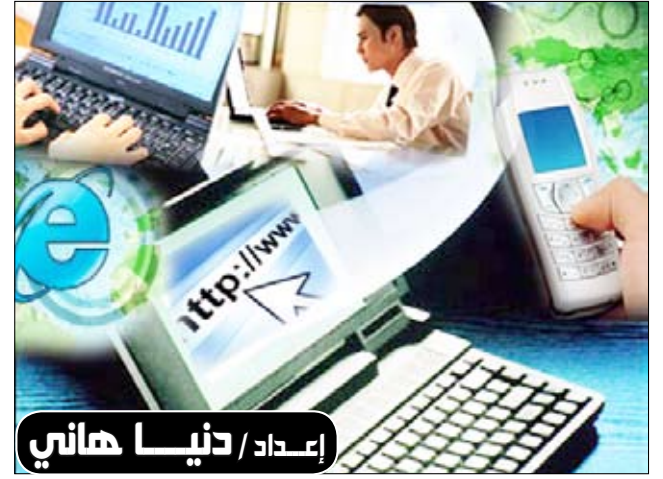
إعداد / دنيا هاني

أمريكا/منايا: تقول دراسة أميركية جديدة إنه في حال قام المراهقون بإرسال أكثر من 120 رسالة نصية في اليوم فإنه دليل على دخولهم في "خانة المخاطر الصحية". ووفقاً لمصادر إعلامية عربية، فقد توصل الباحثون الأميركيون الذين قاموا بهذه الدراسة إلى أن المراهقين المفرطين بعثت الرسائل النصية أكثر استعداداً بنسبة 40٪ لأن يحاولوا تدخين السجائر وأكثر احتمالاً مرتين عن غيرهم في أن يحاولوا تناول الكحول و43٪ أكثر إسراراً بتناول الكحول. وهم أكثر من غيرهم بنسبة 41٪ لأن يحاولوا استعمال المخدرات غير الشرعية و55٪ أكثر من غيرهم في أن يسعوا إلى الشجار البدني. وقال الدكتور سكوت فرانك الذي ترأس فريق البحث