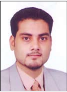
احمد محبوب الطيب

تمتاز حياة الإنسان المسلم بأنها زاخرة بالأعمال الصالحة ، والعبادات المشروعة التي تجعله في عبادة مستمرة ، وتحول حياته كلها إلى قول حسن ، وعمل تكاد صالح ، وسعي وتقرب إلى الله جل في علاه، دون ملل أو انقطاع . وحياة الإنسان المسلم يجب أن تكون كلها عبادة وطاعة وعمل صالح يقربه من الله تعالى ، ويصله بخالقه العظيم جل في علاه في كل وقت من أوقات حياته.