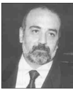
الشاعر اللبناني حبيب يونس