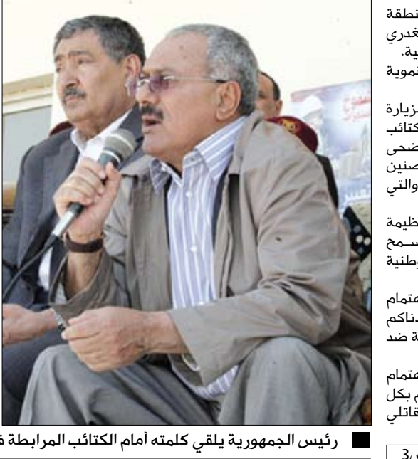
رئيس الجمهورية يلقى كلمته أمام الكتائب المرابطة في باب المندب أمس