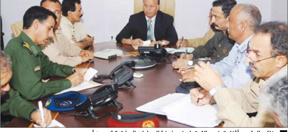
نائب الرئيس أثناء ترؤسه الاجتماع في غرفة العمليات المشتركة بعدن أمس

نائب الرئيس يحث الأجهزة الأمنية على استشعار المسؤولية في بطولة خليجي (20) خلال ترؤسه اجتماعاً ضم وزير الداخلية والقيادات العسكرية والأمنية بغرفة العمليات حيث على أهمية الاستنهاض الكامل واستشعار أهمية المسؤولية الملقاة على عاتق الجميع من أجل الخروج بموقف مشرف ليس للأجهزة الأمنية والعسكرية اليمنية فحسب بل لكل أبناء اليمن الذين يشعرون بالفخر والاعتزاز لاستضافة بطولة خليجي 20 لكرة القدم في يمن التاريخ والمجد والحضارة. وأفشالها قبل وقوعها.