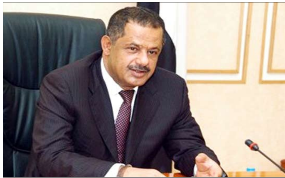
رئيس الوزراء يدشن المهرجان التوعوي حول مرض السكري

وكان دولة رئيس الوزراء الدكتور علي محمد مجور قد دشّن الحملة التوعوية لمرضى السكر في اليمن وأكد ضرورة تصافر كافة الجهود الرسمية والشعبية والخاصة من أجل وقاية مجتمعنا من المهددات الخطيرة لداء السكري.