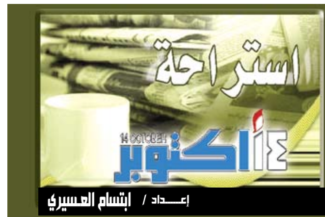
إعداد / إيتام العسيري

هامبورج/ مانيات : ورغم أن أمراض القلب من أكثر الأمراض المسببة للموت إلا أن أكثر الأمراض التي يخشى الألمان من الإصابة بها هي السرطان. وكشفت دراسة حديثة أجراها التأمين الصحي الألماني للموظفين "دي.إيه.كيه" أن أكثر من ثلثي الألمان تساورهم مخاوف من الإصابة بالسرطان. وأظهرت الدراسة التي نشرت نتائجها أمس الأول الأربعاء وشملت نحو ثلاثة آلاف شخص أن 53% من الألمان يخشون أيضاً من الإصابة بجروح بالغة حال تعرضهم لحادث ، بينما يخشى 52% منهم الإصابة بسكتة دماغية و 50% من الإصابة بالخرق