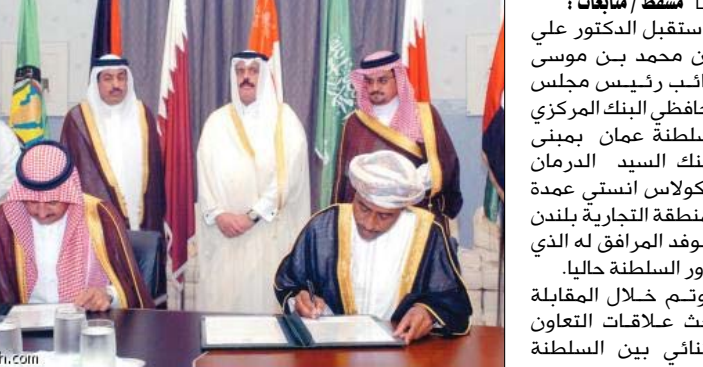
مستقبل الدكتور علي بن محمد بن موسى نائب رئيس مجلس محافظي البنك المركزي بسلطنة عمان بمبنى البنك السيد الدرمان نيكولاس أنتوني عمدة المنطقة التجارية بلندن والوفد المرافق له الذي يزور السلطنة حالياً.

المشتركة. وأوضح معالي أمين عام وزارة المالية للصبيح جوديث مكايل مساعد وزيرة الخارجية الأمريكية للشؤون الدبلوماسية العامة إن مراعاة الأبعاد الثقافية والاجتماعية لتعزيز التواصل بين الشعوب هو خطوة لها عميق الأثر في نجاح جهود مد الجسور الحضارية.