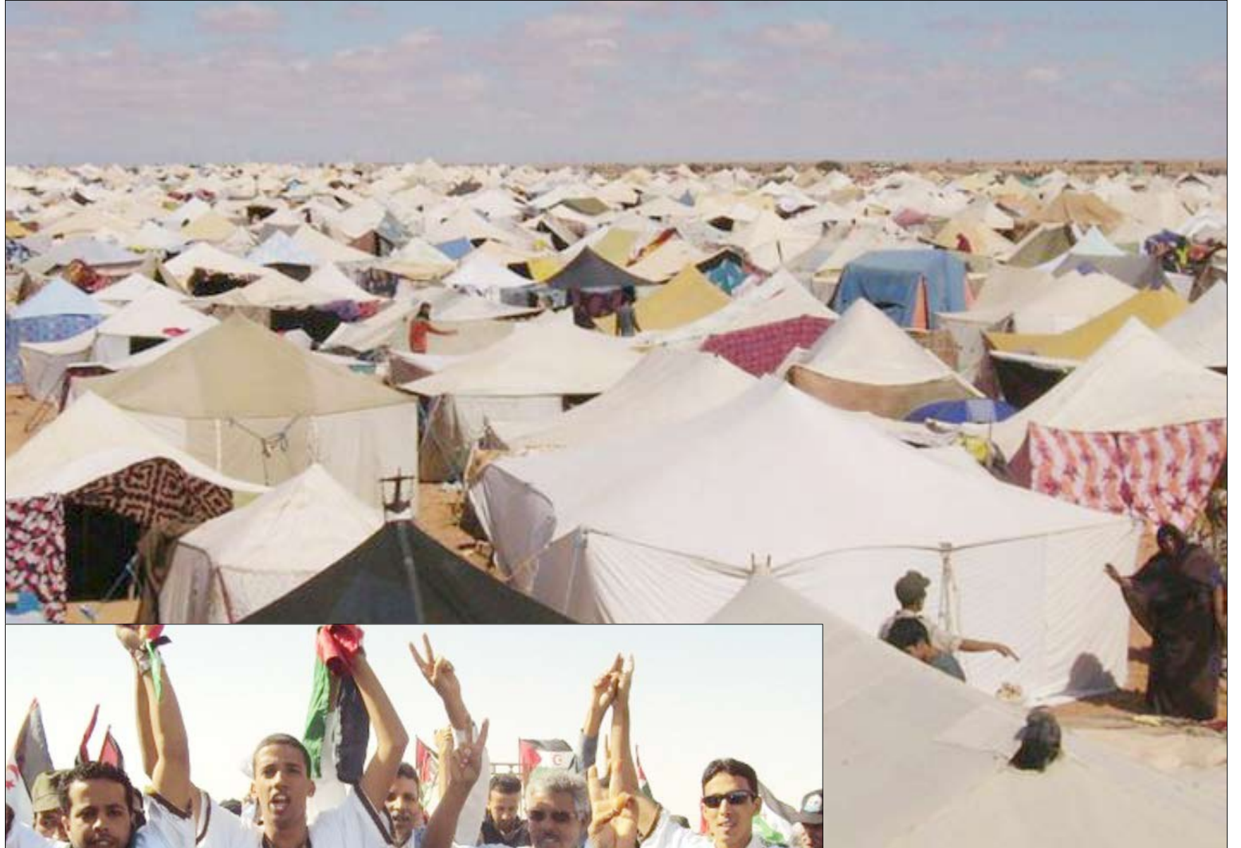
مخيمات اللاجئين في الصحراء الغربية