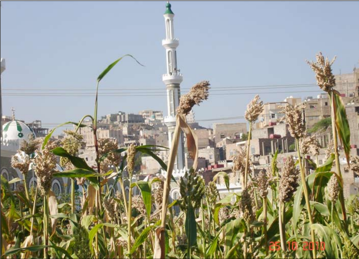
■ مزارع الذرة