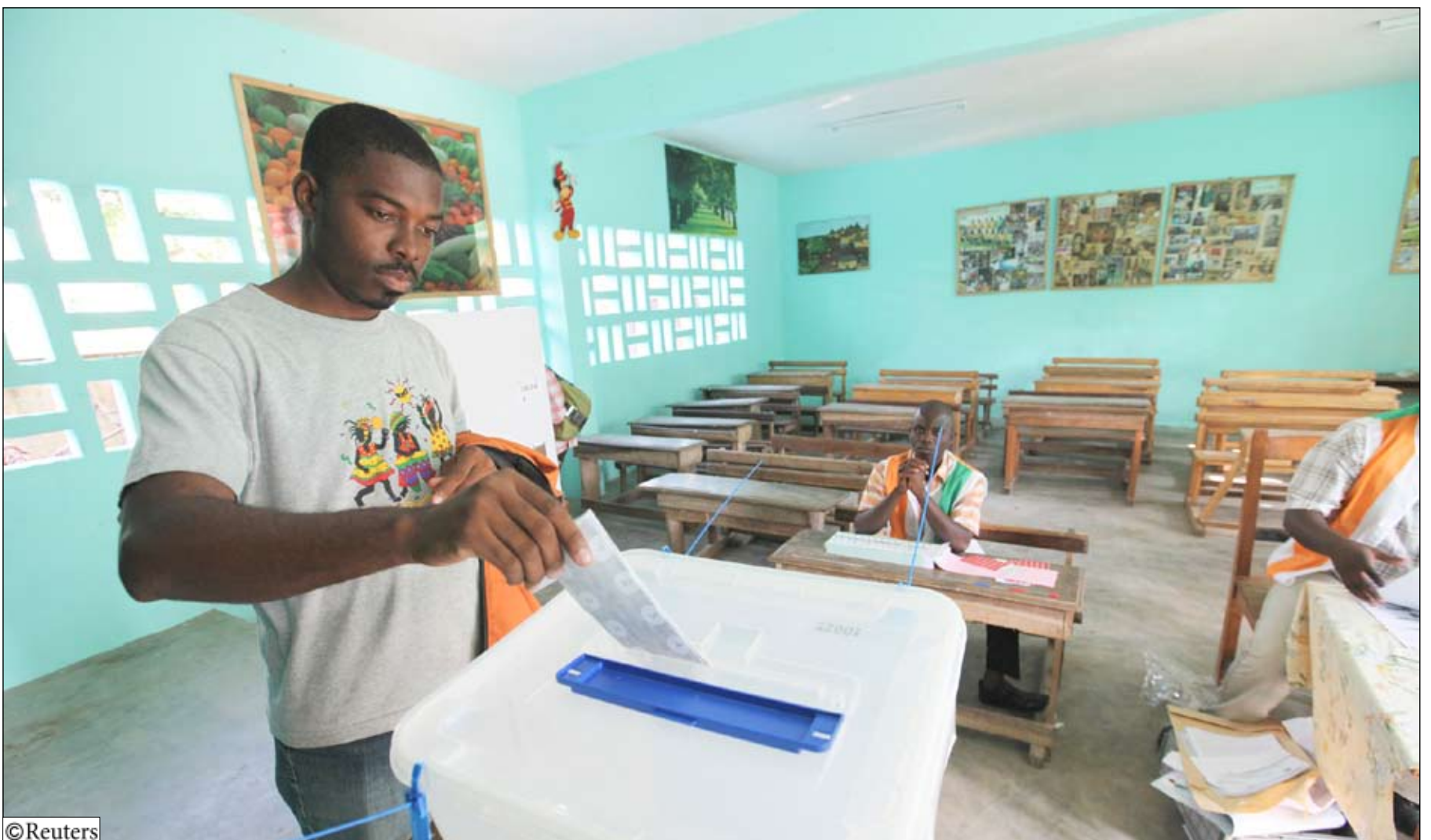
مواطنين يدلي بصوية في انتخابات الرئاسة في ساحل العاج

الجنوب الواقع تحت سيطرة الحكومة والشمال الواقع تحت سيطرة المتمردين.