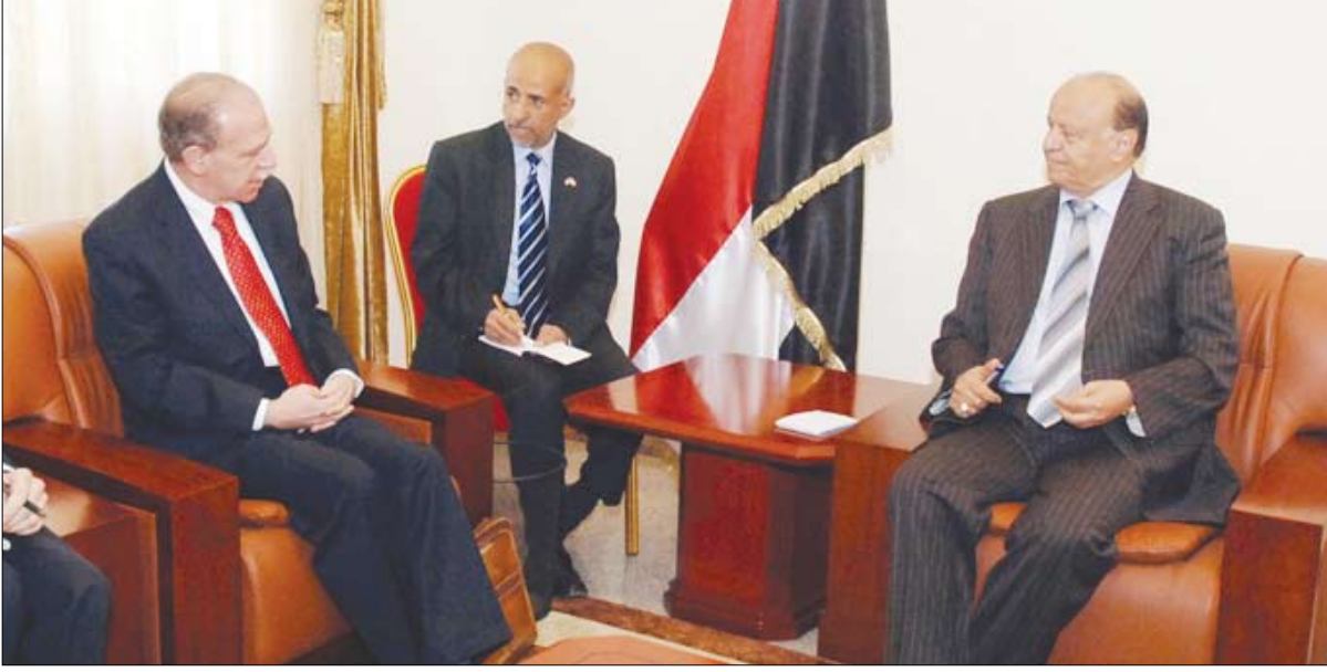
نائب الرئيس أثناء استقباله السفير الأمريكي أمس

صنعاؤ / ساء: استقبل الأخ عبدربه منصور هادي نائب رئيس الجمهورية أمس سفير الولايات المتحدة الأمريكية بصنعاؤ جيرالد فايرستين. وجرى خلال المقابلة بحث العلاقات المشتركة بين البلدين الصديقين في مختلف المجالات، خاصة ما يتعلق بمكافحة الإرهاب وفقى المقدمة تنظيم القاعدة الإرهابي. وأكد السفير الأمريكي أن الولايات المتحدة الأمريكية وجميع حلفاء اليمن يباركون النجاحات التي تتحقق على هذا الصعيد ..مقدراً الجهود الواضحة من قبل اليمن في هذا المجال وأهمية تقديم المساعدات والدعم اللازم. كما جرى بحث المستجدات والجهود المنصبة باتحاه الحفاظ على النهج الديمقراطي وتكريسه ، وأهمية إجراء الانتخابات النيابية في موعدها المحدد بالتوازي مع إجراء الإصلاحات المطلوبة في قانون الانتخابات والمجالات الأخرى.