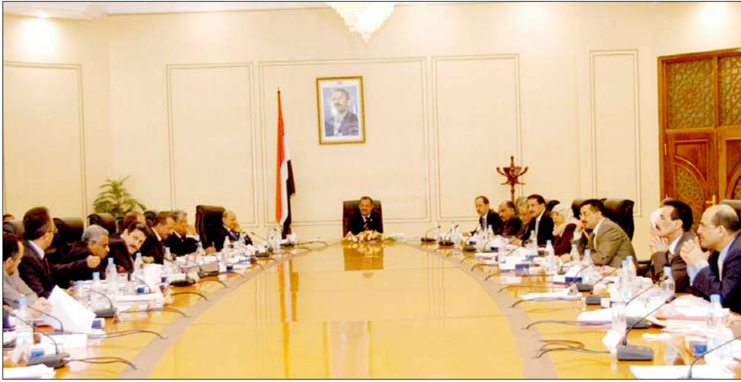
■ من اجتماع مجلس الوزراء أمس