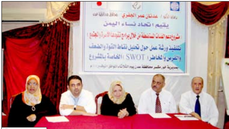
من ورشة العمل