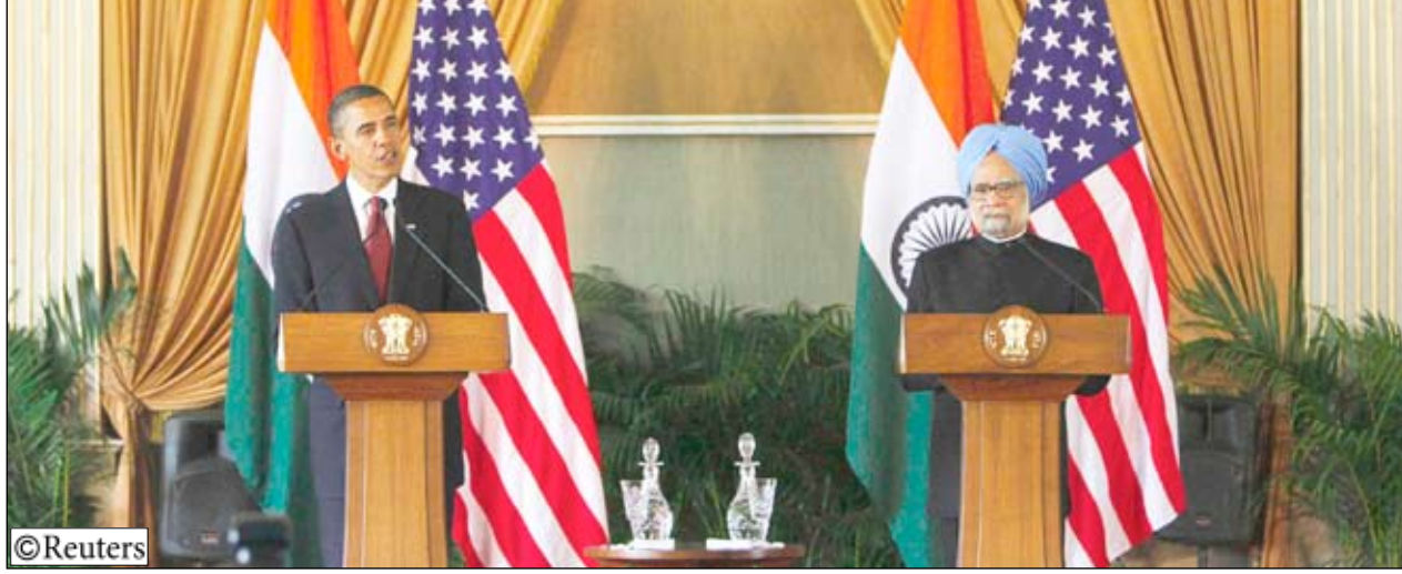
أوباما يتحدث في ختام زيارته للهند وإلى يساره رئيس الوزراء الهندي

وجاء تأييد أوباما لطلب الهند في كلمته أمام البرلمان الهندي في نيودلهي التي قال فيها إنه يتطلع في السنوات المقبلة «إلى مجلس أمن تابع للأمم المتحدة معدل يضم الهند كعضو دائم». وأكد أوباما في كلمته -التي حظيت بتصفيق حار من قبل النواب- أن الهند «شريك لا يمكن التخلي عنه» للولايات المتحدة، واعتبر أنه «مع زيادة السلطة تأتي زيادة المسؤولية».