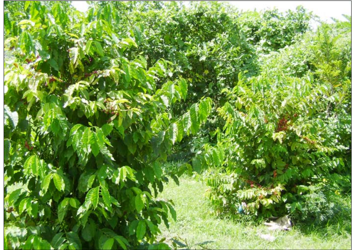
■ أشجار البن