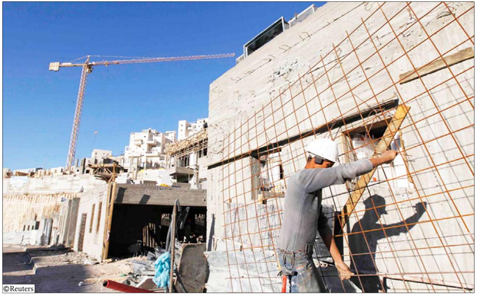
الاحتلال الإسرائيلي يواصل بناء وحدات سكنية جديدة في مستوطنة هارحوما على جبل أبوغيم شرقي القدس المحتلة

عقب إعلان وزير الداخلية الإسرائيلي يياهو يشاي المصادقة على بناء 1600 وحدة سكنية في مستوطنة رمات شلومو بشمال القدس الشرقية خلال زيارة جوزيف بايند نائب الرئيس الأمريكي لإسرائيل. وكانت وزارة الإسكان الإسرائيلية طرحت يوم 15 أكتوبر/ تشرين الأول الماضي عطاءات لبناء 238 وحدة سكنية للمستوطنين في القدس الشرقية. وتزامن الإعلان عن هذه الأنشطة الاستيطانية مع كشف نشطاء سلام إسرائيليين عن تواطؤ الحكومة الإسرائيلية مع جمعيات استيطانية