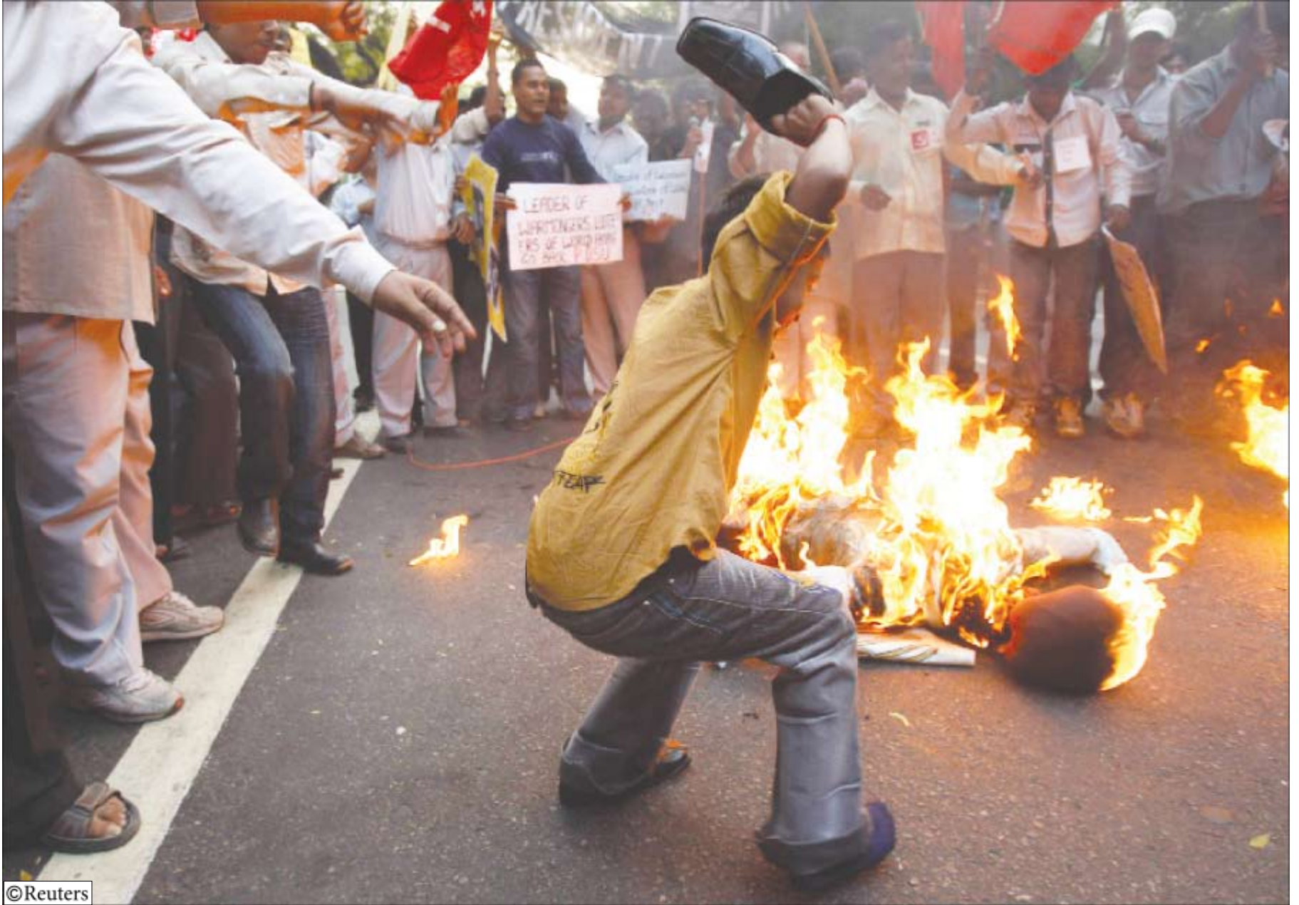
الانفصاليون في آسام يواصلون هجماتهم ويتعدون بالانتقام لقتلهم

قصيرة من الهجوم على الخافطة. وأفادت الصحيفة أن ستة آخرين بينهم عمال يتحدثون الهندية قتلوا في وقت لاحق أمس الأول الاثنين في هجمات متفرقة بمناطق باكسا وكاربي إنغلونغ وسونيتبور. ذكر أن جبهة بولاند جماعة انفصالية تخوض قتالا من أجل إقامة وطن مستقل لقبيلة «بودو» في ولاية آسام منذ عام 1996.