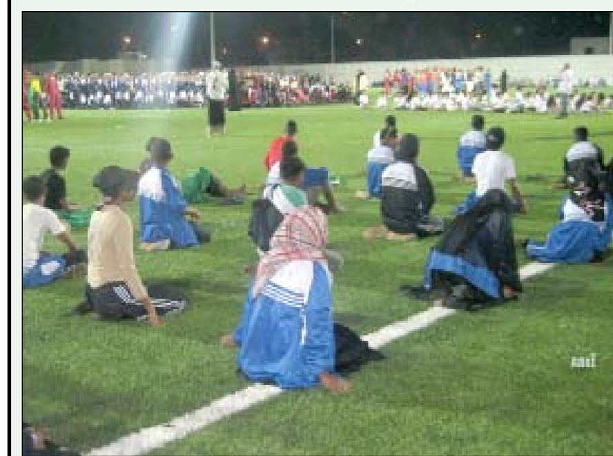
من تدريبات اللوحه الثقافية