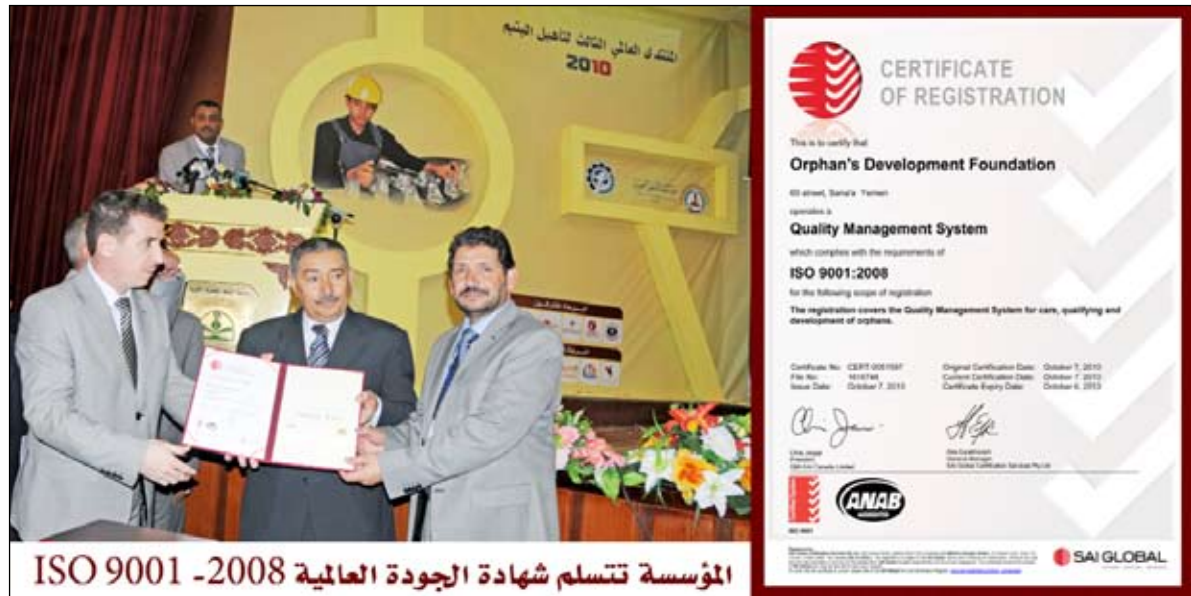
المؤسسة تتسلم شهادة الجودة العالمية 2008- ISO 9001 خلال استلام شهادة (الايزو)

على خلق ثقافة ووعي لدى الموظفين في المؤسسة عن ماهية نظام الجودة ايزو 9001 - 2008 ، فيما تضمنت المرحلة الثانية توثيق النظام.