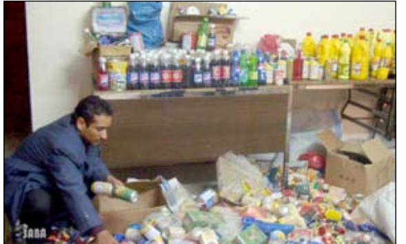
مشروبات غازية وعصائر منتهية الصلاحية