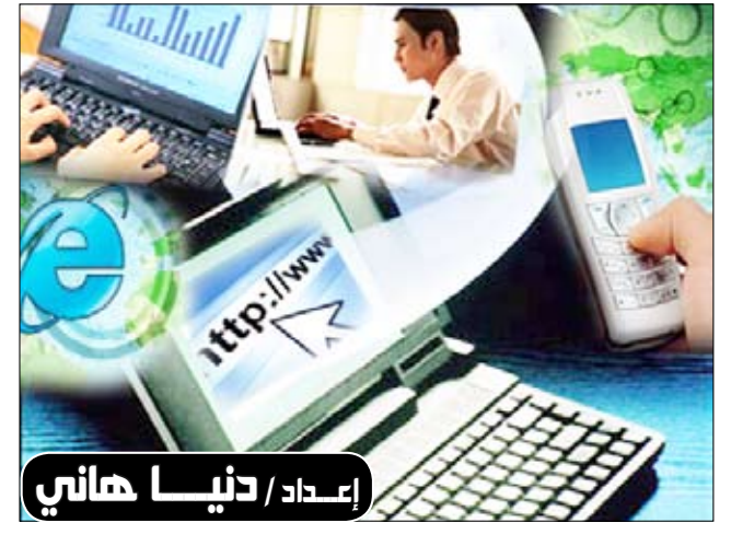
إعداد / دينا هاني

السعودية/منايا: بلغ عدد المشتركين بخدمات الاتصالات المتنقلة في السعودية نهاية النصف الأول من العام الحالي 47 مليون مشترك بنسبة انتشار 172 بالمائة فيما بلغ عدد مستخدمي الإنترنت 11 مليون مستخدم بنسبة انتشار 40 بالمائة. ونقلت وكالة الأنباء السعودية عن النشرة الإلكترونية لهيئة الاتصالات وتقنية المعلومات قولها في تقرير صدر مؤخراً