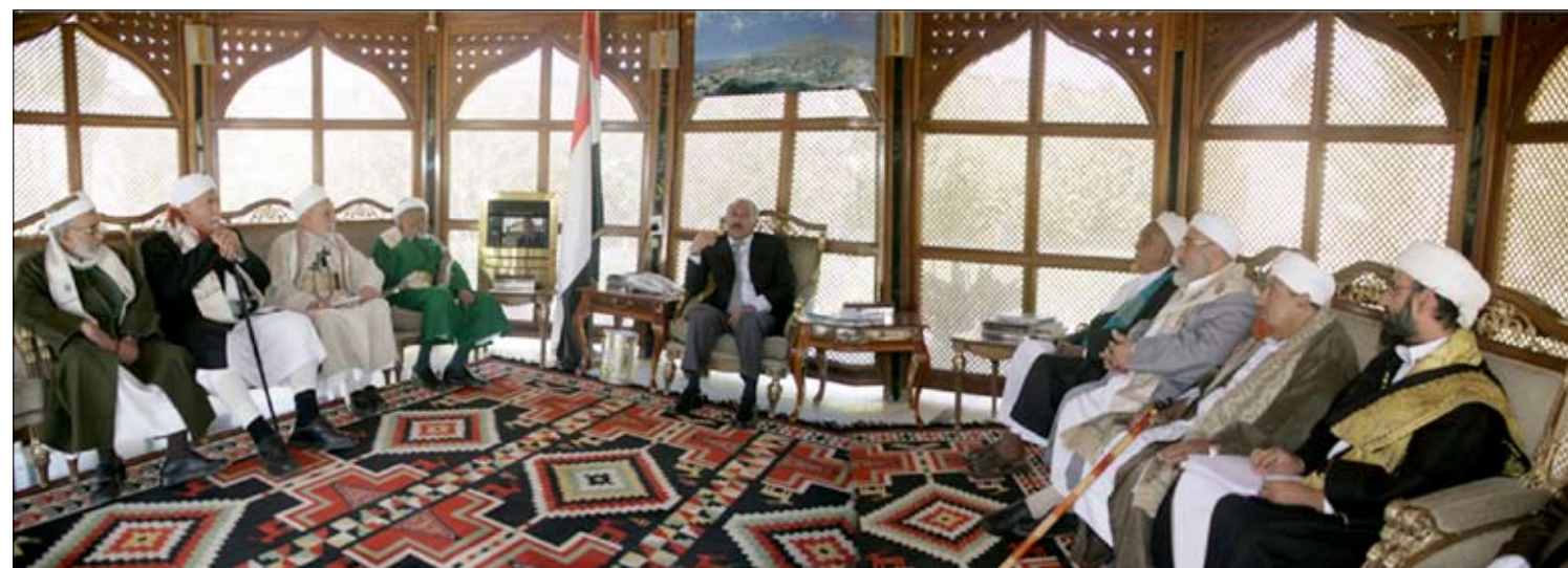
رئيس الجمهورية لدى استقباله رجال الدين أمس

الدعوة والنصح للابتعاد عن التطرف والغلو ومحاربة الإرهاب والعنف والدعوة إلى الوسطية والاعتدال. كما قدموا لفخامة الأخ الرئيس النصيحة والمشورة في ما يتعلق بالتطورات الراهنة داخلياً وخارجياً، وما يتصل بذلك الاحتفانات التي يقفها