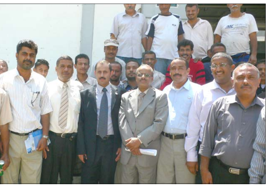
□ عبدن / أنهار الوالي:

استفاد منها (25) ألف مواطن بمديرتي حرض وحيران