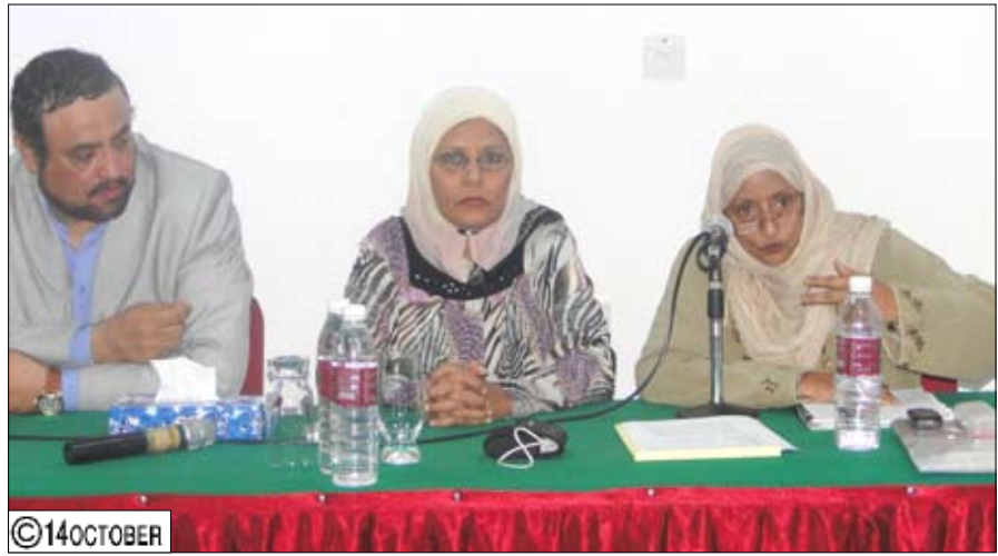
عبدن / أنهار هاشم:

اعتبر الأخ/ محمود عياد وزير الشباب والرياضة أن أبرز مظاهر العنف ضد المرأة والرجل هو التعامل بطريقة تمييزية وتقسيم المجتمع إلى فئتين ذكورية وأنثوية بطريقتين تتعارض مع المعنى الفطري البشري وكذا المعنى الديني ما يدل على مفهوم تخلفي يسيطر على أذهان البعض. جاء ذلك لدى حضوره أمس حلقة النقاش الخاصة باستعراض نتائج دراسة «استخدام تقنية المعلومات للحد من العنف ضد المرأة في م/ عدن» التابع لمشروع أبحاث تقنية المعلومات من أجل تمكين المرأة (GRACE).