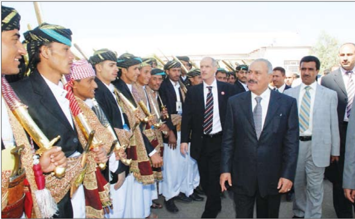
رئيس الجمهورية يتفقد حفل عرس جماعي للأيتام

مرتاحون لإقامة (خليجي 20) في اليمن كونها ستفتح أفقاً واسعاً بين اليمنيين وإخوانهم في مجلس التعاون الخليجي زرت اليمن قبل أربع سنوات وفي زيارتي هذه وجدت فرقاً هائلاً في التنمية والبنية التحتية