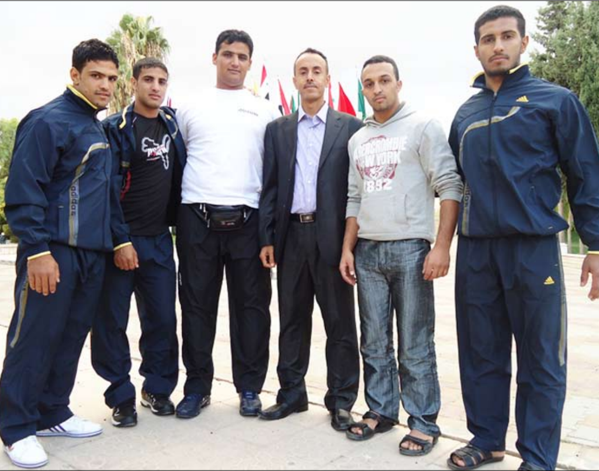
■ المنتخب الوطني للجودو