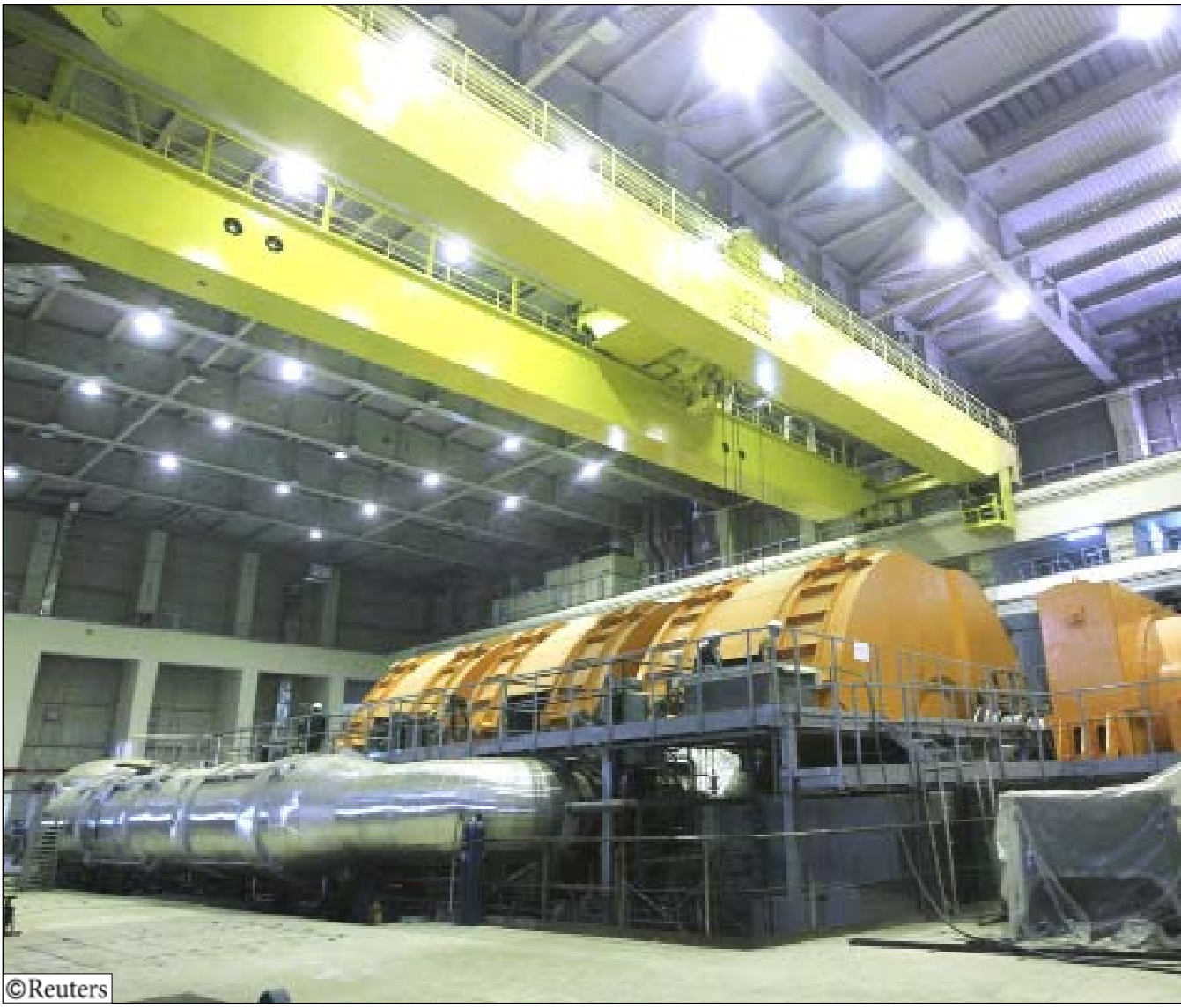
محطة نووية إيرانية