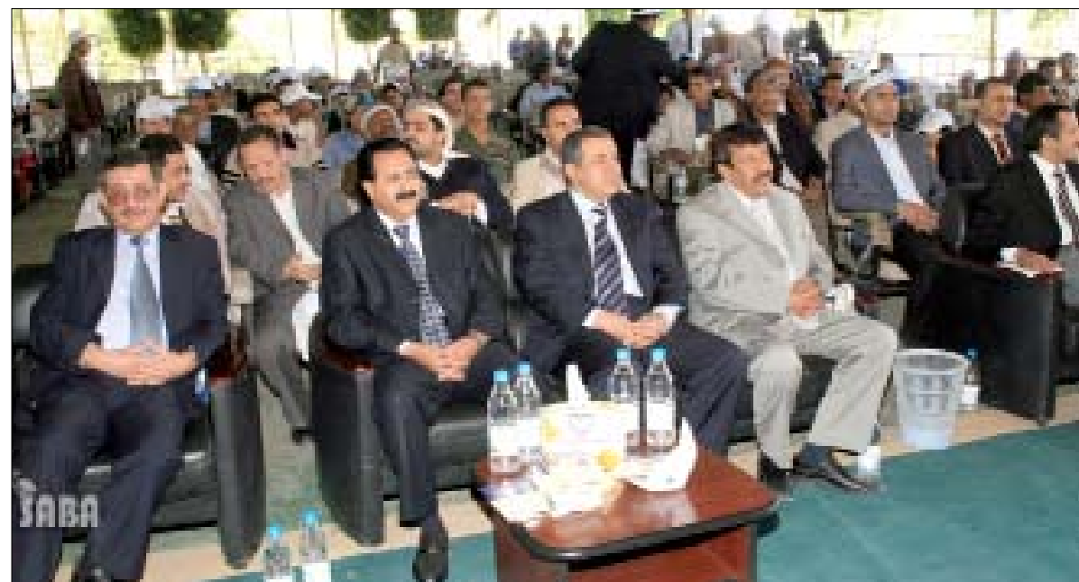
أبو راس خلال افتتاحه أمس بصنعاء فعاليات اليوم الجماهيري التوعوي عن السكتة الدماغية

أهداف الثورة اليمنية التحرر من الاستبداد والاستمرار ومخلفاتها وإقامة حكم جمهوري عادل وإزالة الفوارق والامتيازات بين الطبقات. بناء جيش وطني قوي لحماية البلاد وحراسة الثورة ومكتسباتها. رفع مستوى الشعب اقتصاديا واجتماعيا وسياسيا وثقافيا. إنشاء مجتمع ديمقراطي تعاوني عادل مستمد نظمته من روح الإسلام الحنيف. العمل على تحقيق الوحدة الوطنية في نطاق الوحدة العربية الشاملة. احترام موثاق الأمم المتحدة والمنظمات الدولية والتمسك بمبدأ الحياد الإيجابي وعدم الانحياز والعمل على إقرار السلام العالمي وتدعيم مبدأ التعايش السلمي بين الأمم. السعر / سيا : أكد نائب رئيس الوزراء للشؤون الداخلية صادق أمين أبو راس حرص الحكومة على الارتقاء بمستوى الخدمات الصحية ودعم البرامج الصحية للحد من السفر للعلاج في الخارج. جاء ذلك خلال افتتاحه أمس بصنعاء فعاليات اليوم الجماهيري التوعوي عن السكتة الدماغية "الأسباب والأعراض والوقاية" الذي نظّمته الجمعية اليمنية للعلوم العصبية بمناسبة اليوم العالمي للسكتة الدماغية. وأشار نائب رئيس الوزراء للشؤون الداخلية إلى ضرورة نشر الوعي المجتمعي بأسباب وعوامل الخطورة للسكتة الدماغية لما لذلك من أثر في الحد من انتشار هذا المرض الذي بات يهدد آلاف الأشخاص بالإعاقة الدائمة. ولفت أبو راس إلى أن الإحصائيات المحلية والعالمية حول انتشار إعاقات السكتة الدماغية تنعكس بشكل أو بآخر لتصبح