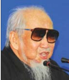
خان تزوا رونج

كوخا من القش رأيت كان بيتي فيه أحلام قديمة طفولتي وحب أمي الحنون كلب نابج، على الغريب وصورة ابن أخي ينظر لي وقد أمال رأسه بنظرة فيها طفولة بريئة سمعت أمي تكبح فسقطت مني دموع كبيرة