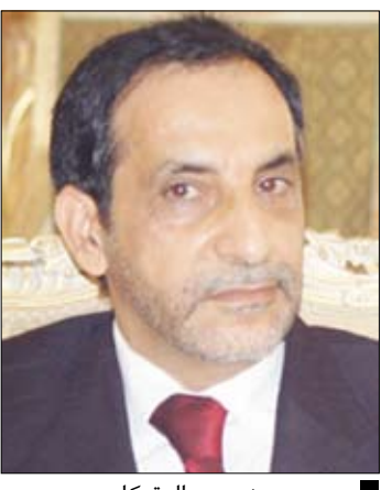
يحيى بن يحيى المتوكّل

السوابب والرغبة الملحوظة لدى أعضائه في انجاز هذه الحزمة التشريعية في اقرب وقت ممكن للمساعدة على استكمال متطلبات الانضمام بنهاية العام الجاري.. منوها بالتناجح الايجابية التي حققها الاجتماع الثامن لفرق العمل الخاص بانضمام اليمن الذي عقد مؤخرا في جنيف والدعم الدولي الملحوظ والقوي لليمن لاستكمال انضمامها بنهاية العام الجاري. وقال " إن انضمام اليمن إلى منظمة التجارة العالمية أصبح مطلبيا طبيعيا، حيث سيضع اليمن في الخريطة الدولية لتتمكن من الاندماج في الاقتصاد العالمي، ولا يمكن أن تبقى دولة أو اقتصاد ما خارج المنظمة الدولية أو الاقصاد الدولي " سياسة الدولة وبرامج الحكومة تؤكد أهمية أن ندمج في