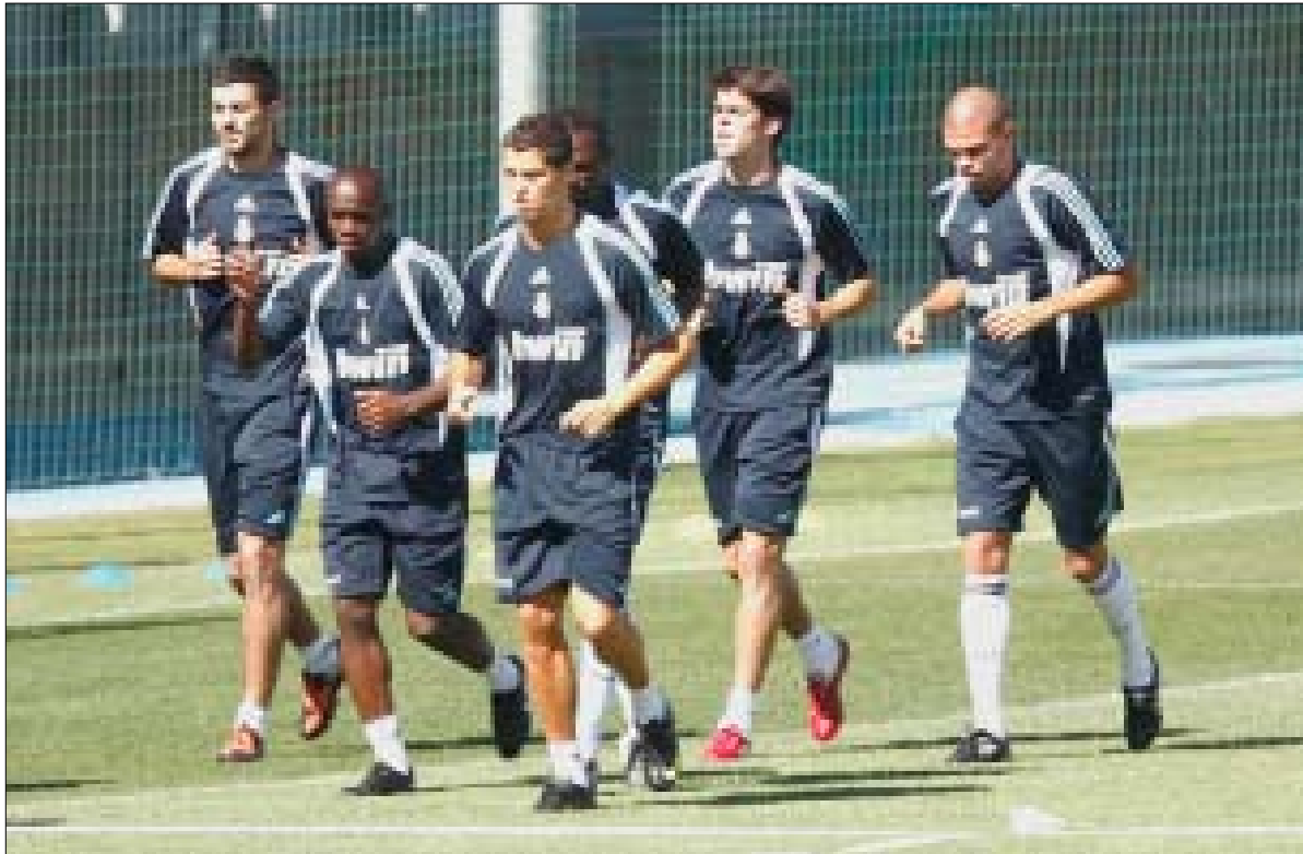
فريق ريال مدريد