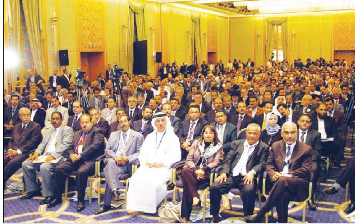
جانب من المشاركين في المؤتمر