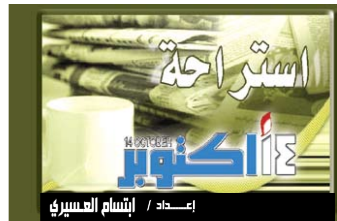
إعداد / إيتام العسيري

كشندو/منايات : سيتمكن السياح والمتسلقون لقمة إفرست في جبال الهيمالايا بالنيبال من الاستفادة من خدمات الإنترنت على هواتفهم النقالة بعد أن قررت شركة محلية إنشاء محطة اتصال هاتفية من الجيل الثالث في منطقة إفرست. وذكر موقع "نيبال نيوز" أن شركة "أن سيل" النيبالية وهي الفرع المحلي لشركة "تيليا سونيرا" السويدية، وضعت الحجر الأساس لبناء محطة اتصالات من الجيل الثالث في منطقة إفرست توفر خدمات إنترنت للهواتف وخدمة الاتصال عبر الفيديو.