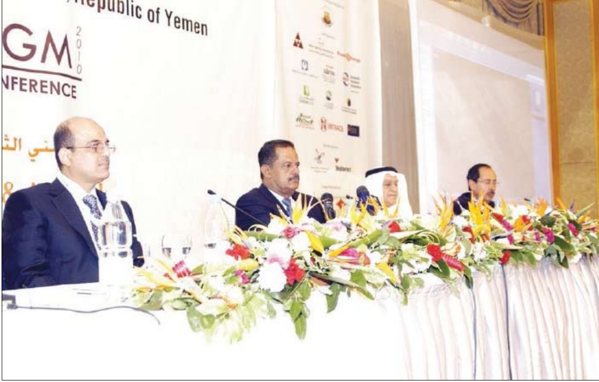
رئيس الوزراء لدى افتتاحه المؤتمر الثالث للنفط والغاز