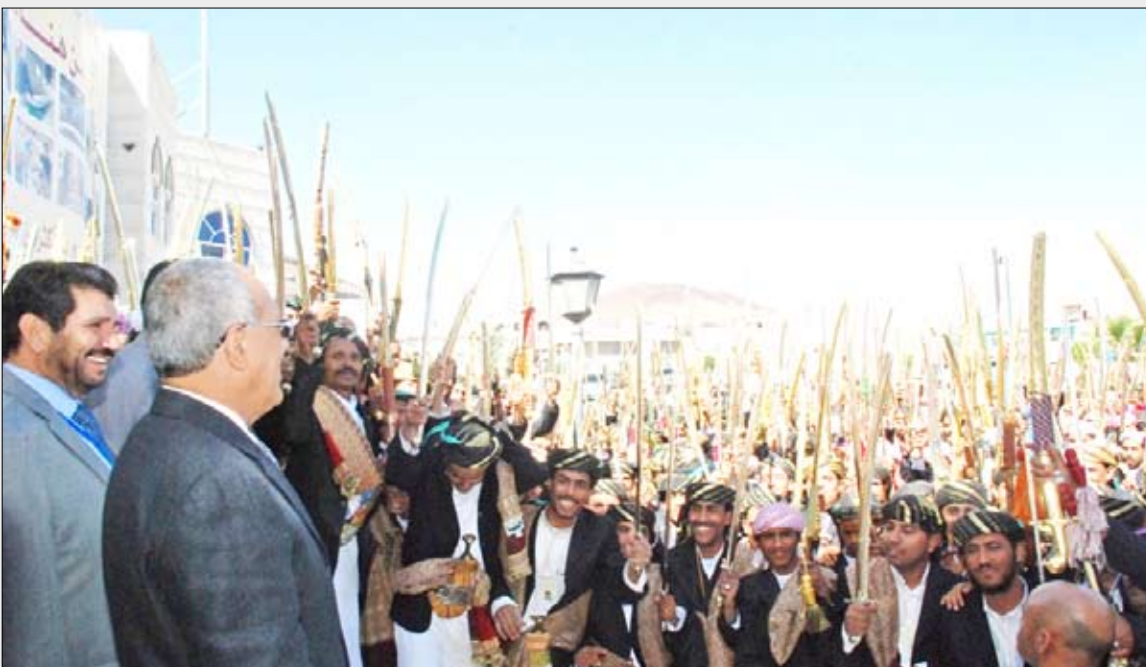
رئيس الجمهورية يشهد العرس الجماعي للأيتام

- لا شك أننا أمة واحدة وأخوة في الدين والعروبة والإسلام وتجمعنا روابط الدين واللغة والجوار ووشائج القرى، والدين الإسلامي حث على المحافضة على حسن الجوار والرسول صلى الله عليه وسلم يقول: «المؤمن للمؤمن كالبنان أو كالبنيان يشد بعضه بعضاً» ..