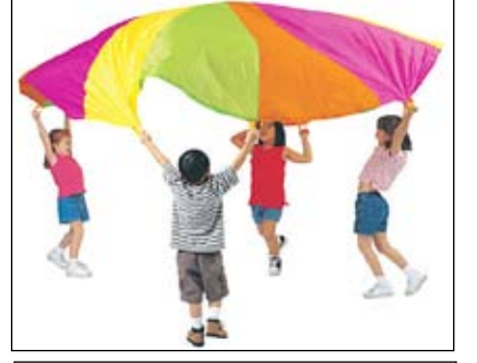
إعداد/ محمد فؤاد

لرسم خريطة توضح ضغط الدم الطبيعي وفقاً للعمر والنوع والطول. وأثبتت الدراسة أن مقياس وزن الطفل له تأثير بسيط على ضغط الدم عند الأطفال الذين يتمتعون بأوزان طبيعية ولكنه يؤثر بشكل كبير على الأطفال الذين يعانون من زيادة الوزن. ولمقياس وزن الطفل تأثير على قراءة انقباض ضغط الدم والتي تمثل 4.6 مرة أكثر من تأثيره على الأطفال الأصحاء. والأمم سواء بين الصبية والفتيات. وعُلق الدكتور جريج فونارو أستاذ أمراض القلب بجامعة كاليفورنيا قائلا: «إن البدانة تمثل مشكلة صحية كبرى عند الأطفال والبالغين، فهناك صلة معروفة بين البدانة في الطفولة ومشكلة ضغط الدم المرتفع وارتفاع الكوليسترول في الدم وانخفاض حساسية الأنسولين وقصور الشرايين». لهذا يوصي فونارو بضرورة اتخاذ خطوات جادة لعلاج السمنة عند الأطفال والبالغين لتجنب المشاكل الصحية التي تصيب الأوعية الدموية.