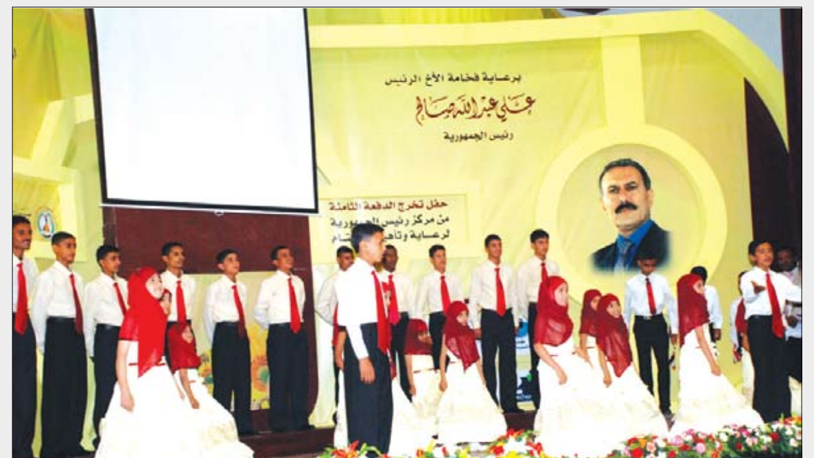
من فقرات حفل إختتام المنتدى العالمي الثالث لليتم