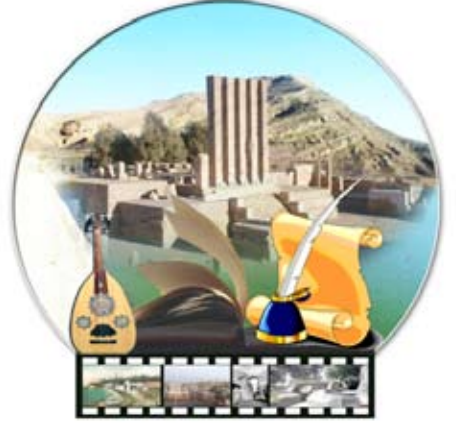
إشراف /فاطمة رشاد