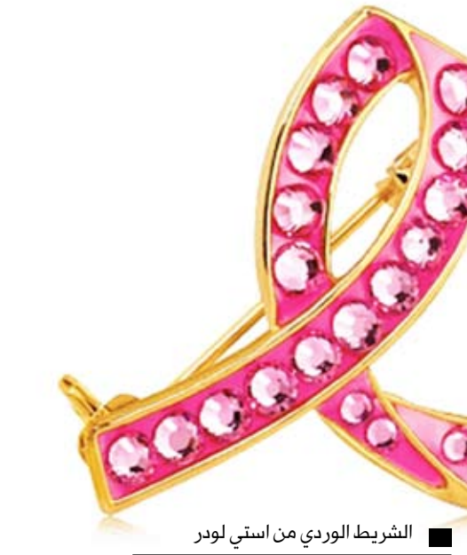
الشريط الوردي من استي لودر