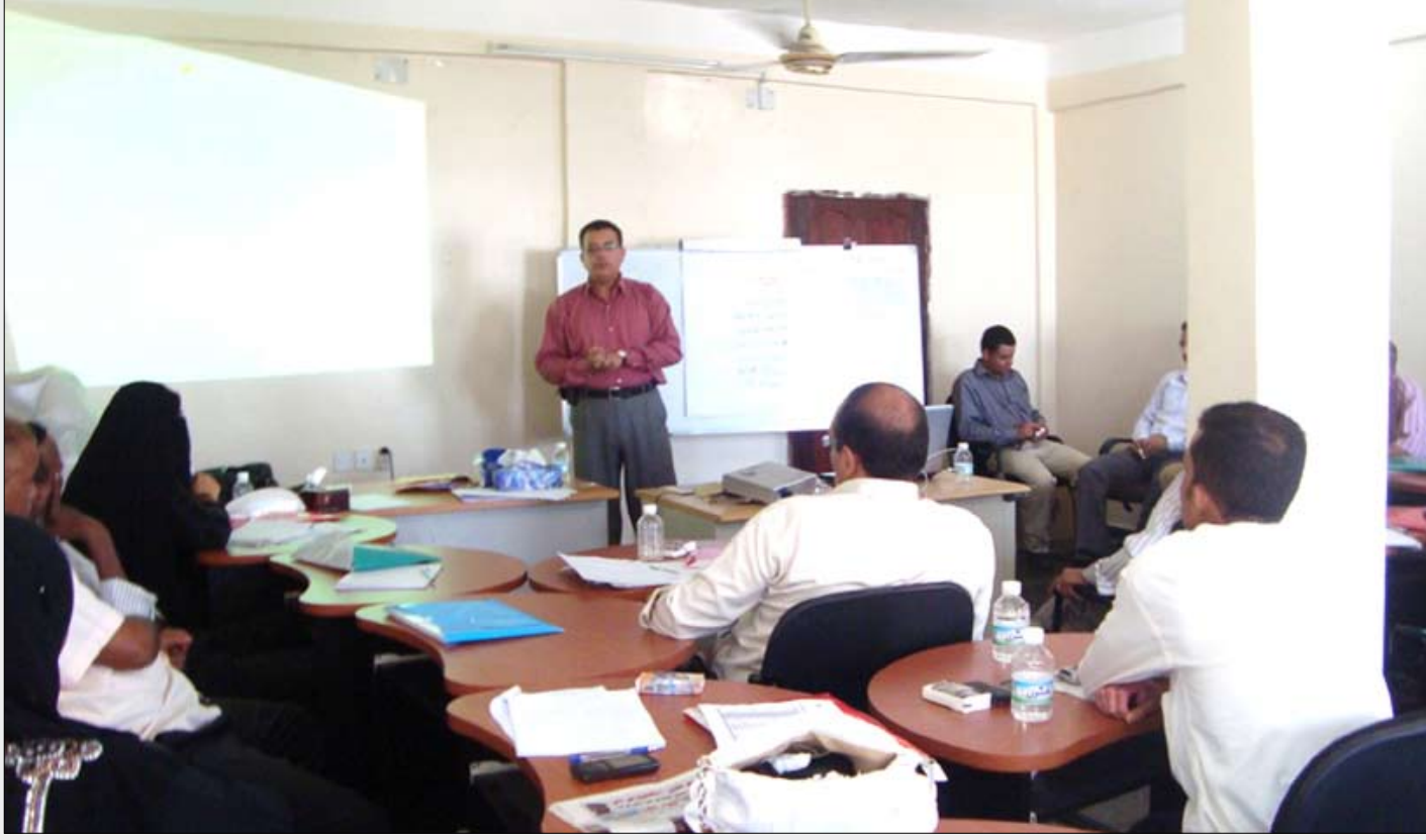
جانب من المشاركين في دورة الحماية القانونية للصحفيين

اختتمت الدورة التدريبية حول الحماية القانونية للصحفيين بمعهد التأهيل والتدريب للإعلاميين بعن التي نظمتها لجنة التدريب والتأهيل بنقابة الصحفيين اليمنيين بالتعاون مع برنامج (الاستثمار في المستقبل) لتجنيب الصحفيين الوقوع تحت المساءلة القانونية ومن أجل العمل بمهنية أفضل.