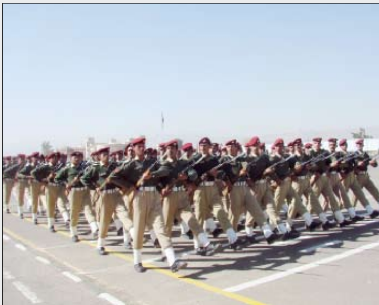
وحدات رمزية خلال التشدين

والانتماء الوطني وغدت صخرة صلبة تتحطم عليها كافة المؤامرات والفساد. وعبر رئيس هيئة الأركان عن تقديره للقيادة وللضباط والصف الذين بذلوا ويبدلون قصارى جهودهم للارتقاء بهذه الكلية إلى أعلى المستويات .