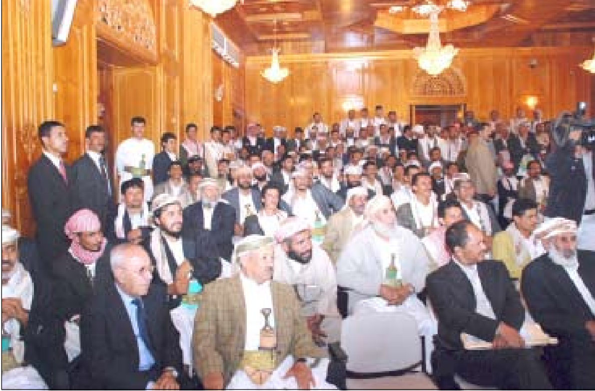
جانب من الحاضرين