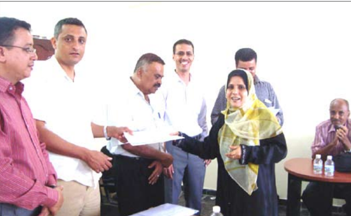
عدد من المكرمين في دورة الحماية القانونية للصحفيين

وبالنسبة لوزارة الإعلام نرجو منها الابتعاد عن التدخل في الجانب الصحفي قانونيا لأن تدخلها فيه انتهاك لحرية الصحافة .. كما أن وزارة الشؤون القانونية هي الجهة الرسمية المؤهلة لمعالجة المخالفين.