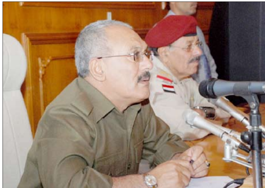
رئيس الجمهورية لدى لقائه المشايخ والشخصيات الاجتماعية والأعيان في محافظة صعدة أمس