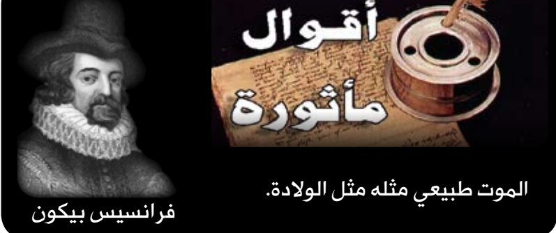
الموت طبيعي مثله مثل الولادة. فرانسيس بيكون

من زمان سأل مدرس طالبا: كم عمر أبيك؟ قال الولد: والله ما أدري بس هو من زمان عندنا.