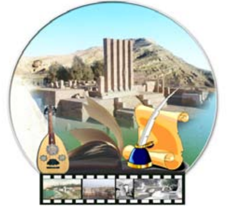
إشراف / فاطمة رشاد

من المتوقع أن تصدر وزارة الثقافة والتراث العمانية خلال الفترة المقبلة قبل نهاية العام الحالي عدداً من الإصدارات الأدبية الحديثة التي تتنوع ما بين الشعر والنثر والتشكيل لعدد من المبدعين العمانيين. وبحسب صحيفة (الوطن) العمانية تشتمل الإصدارات الحديثة على 12 عنواناً حيث تستصدر مجموعة شعرية للشاعر