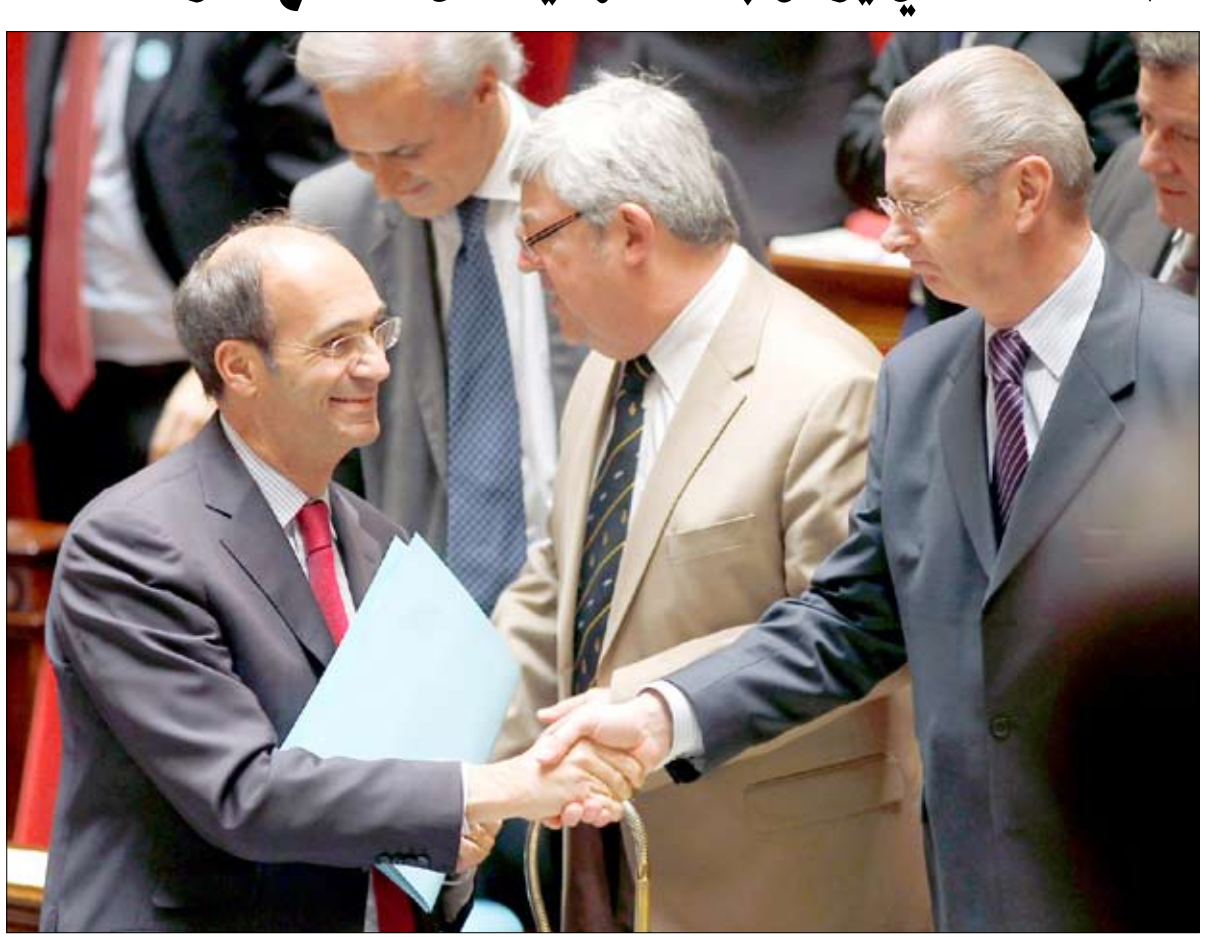
وزير العمل الفرنسي ايريك ويرت (الى اليسار) يصافح الوزير المسؤول عن العلاقات مع البرلمان هنري دي رينكور

باريس / 14 أكتوبر / رويترز: وافق المجلس الوطني (مجلس النواب) في فرنسا بصفة نهائية أمس الأربعاء على إصلاحات نظام معاشات التقاعد التي أثارت احتجاجات في أنحاء البلاد مزيلة بذلك آخر عقبة تشريعية أمام اعتماد المشروع قانوناً. وأقرت الجمعية الوطنية الإصلاحات التي تقضي برفع سن التقاعد بأغلبية 336 صوتاً مع اعتراض 233 صوتاً. وقال الحزب الاشتراكي المعارض إنه سيقدم طعناً أمام المجلس الدستوري الذي ما زال يندعي أن يبت في مدى دستورية الإصلاحات. وكانت اتحادات العمال الرئيسية في فرنسا قد دعت إلى الاحتجاج على مشروع قانون إصلاح نظام معاشات التقاعد الذي يجري التصويت النهائي عليه في مجلس الشيوخ هذا الأسبوع. وكان وزير الداخلية الفرنسي بريس أورنو قد أعلن أن الحكومة أرسلت الشرطة لفض الحصار عن ثلاثة مستودعات رئيسية للوقود كان محتجون يمتنعون الوصول إليها. وأضاف الوزير: "أثناء الليل قمنا بفك الحصار عن ثلاثة مستودعات رئيسية للوقود هي لاروشيل ودونج ولومان". وقال إن فتح هذه المستودعات جعل هناك بالفعل إمكانية لتوزيع ملايين اللترات من الوقود. وكان الاتحاد العام للانتخابات العمالية في