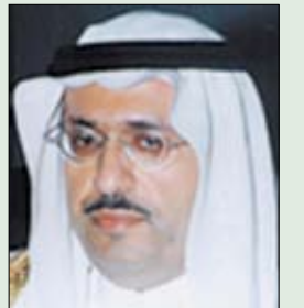
د. سيف الإسلام بن سعود بن عبد العزيز

قبل نحو 3 سنوات تقريباً أطلق طالب في جامعة فرجينيا التكنولوجية بأمريكا واسمه (تشو سونج هوي) النار من أسلحته المختلفة على زملائه الطلاب وأساتذته ومشرفيه ليقتل اثنين وثلاثين منهم قبل أن يقتل نفسه، ومذاك الوقت راحت محطات التلفزيون والصحف والمجلات تتنافس لكشف حقائق الجريمة والبحث عن مسبباتها، وتفردت مجلة «نيوزويك» بتحقيق مثالي، بحثت فيه اجتماعياً وثقافياً وطبياً وسياسياً عن الأسباب الكامنة للقتل والإجرام.. فكان عنوان غلاف أحد أعدادها: (داخل عقل قاتل).. في بلادنا نحن نشكو منذ سنوات من عمليات إرهابية وإرهابيين قتلة لا يرحمون، ومصممين على نفس المجتمعات السكنية وضرب المنشآت الاقتصادية وقتل النخب، وبعد كل عملية أو كشف لإعداد لها، تروح المقالات تصف هؤلاء بالفئة الضالة والمنحرفة، وأنهم شواذ وخارجون عن الملة، أو أنهم عملاء ومغرر بهم.. إلخ. كل ذلك صحيح في وصفهم، لكننا ونحن نستفز الكتاب والمقالات، ونستنجد بعشرات فرق