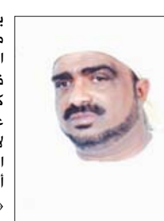
الشيخ/ أنيس الحبشي

يرى العجب العجيب الذي يشيب له رأس الوليد، منها مثلاً لا حصرًا: جواز فمأخذا الرضية! وجواز أن يتزوج الرجل ابنته التي أنجبها من نكاح غير صحيح (!)، ومنها فتوى إرضاع الكبير، ومنها فتوى أبي ابن العريبي في كتابه «العواصم من القواصم» بأن الحسين رضي الله عنه إنما قتل بسيف جده - صلى الله عليه وسلم - إرضاءً لأسياده الأماميين ومنها قول ابن تيمية في (منهاج السنة النبوية) أن علياً بن أبي طالب رضي الله عنه كان مخذولاً أيضاً توجه إرغاماً وتشكيكاً بقوله صلى الله عليه وسلم «من كنت مولاه فعلي مولاه، اللهم انصر من نصره، واخذل من خذله.. الخ».