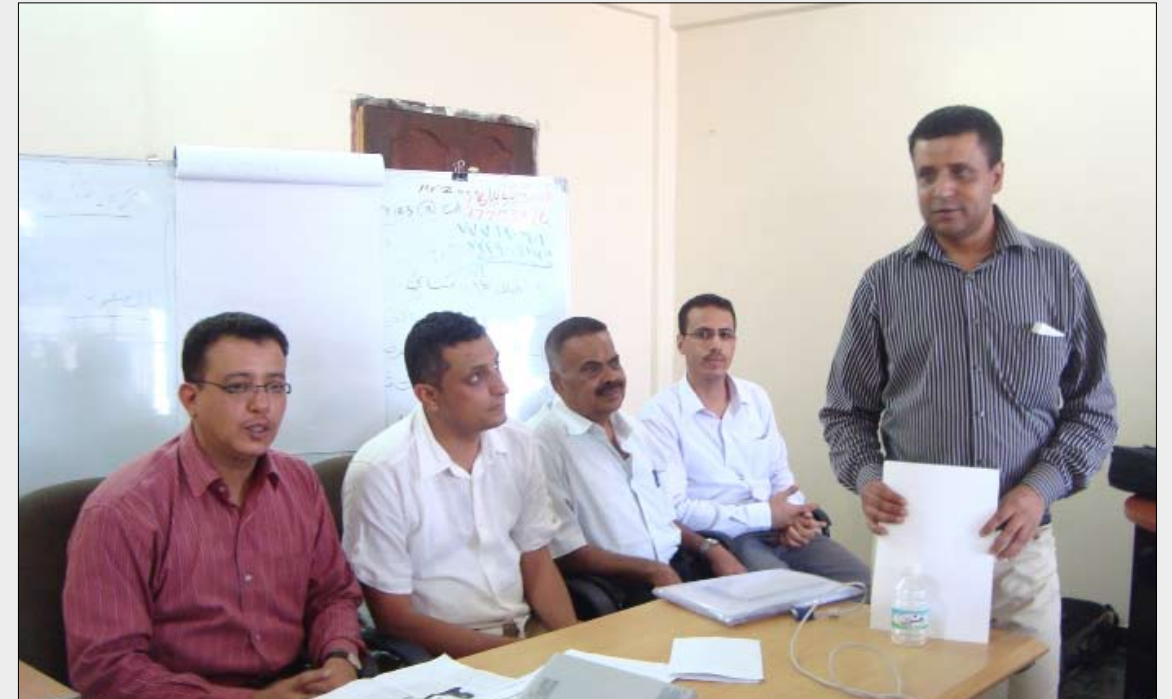
جانب من المشاركين في دورة الحماية القانونية للصحفيين