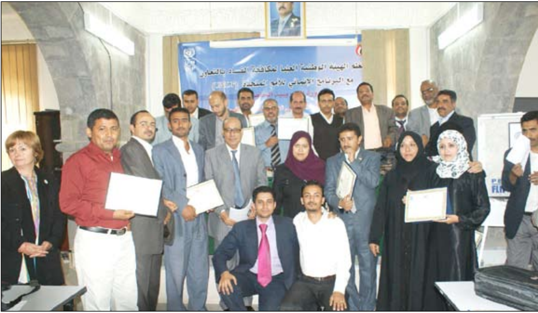
صورة جماعية للمشاركين في الدورة التدريبية

على كيفية اعداد التقارير وعرضها بالإضافة الى ما تخلل الدورة من دراسات وتطبيقات وتمثيل مواقف زائفة ومجموعات عمل. كما انه في ختام الدورة تم تسليم الشهادات التدريبية واخذ الصور التذكارية للمشاركين.