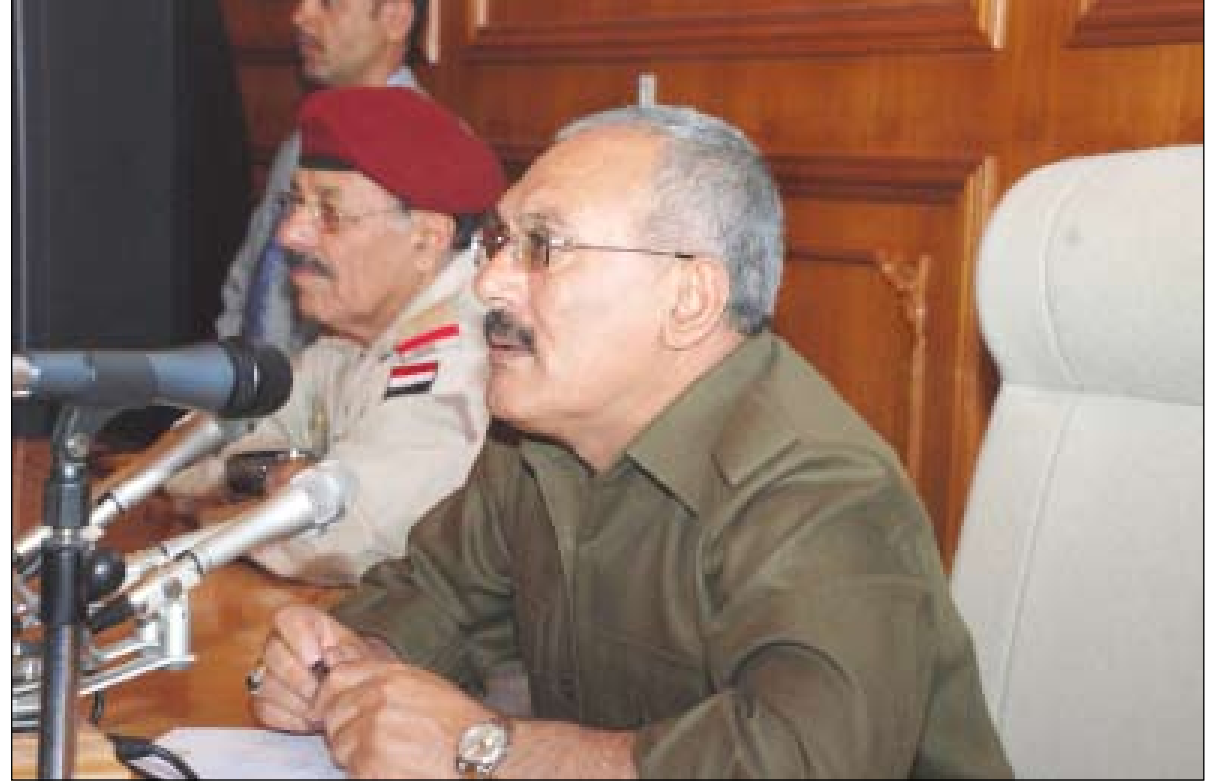
رئيس الجمهورية يلقي كلمة خلال لقائه المشايخ والشخصيات الاجتماعية والأعيان