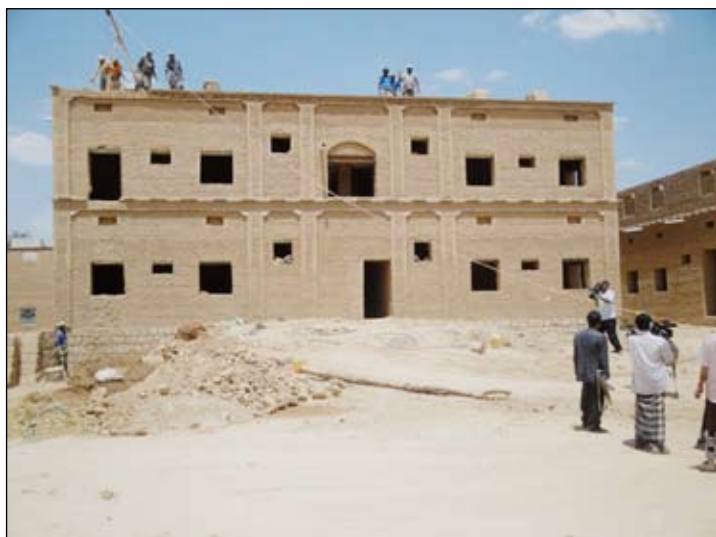
من انجازات صندوق الاعمار بحضرموت