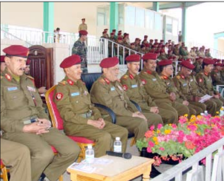
رئيس هيئة الأركان خلال تشدين العام الدراسي في الكلية الحربية