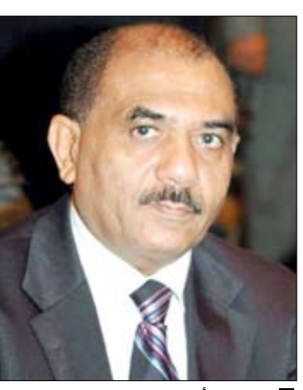
حسن أحمد اللوزي

متابعات / سيا: أكد وزير الإعلام حسن أحمد اللوزي أن اليمن استكملت الاستعدادات لاستضافة بطولة كأس الخليج العربي العشرين لكرة القدم في موعدها المحدد. وبين خلال لقائه أمس الصحفيين العرب المشاركين في الجولة الاستطلاعية السياحية باليمن التي تنظمها وزارة السياحة بالتعاون مع وكالة الأنباء اليمنية (سبأ)، أنه تم بهذا الخصوص تشكيل لجنة إعلامية للإشراف على تنظيم هذا المونديال الكروي وتوفير التغطية الإعلامية المناسبة له على المستوى الوطني والعربي والعالمى. وذكر أنه تم بالتنسيق مع وزارة السياحة تخصيص أماكن خاصة لإيواء واستضافة الإعلاميين والتواصل مع مختلف الجهات المعنية لتسهيل مهامهم بما يضمن عكس الأحداث بالمستوى الذي يتطلع إليه الجمهور الرياضي داخل الوطن العربي وخارجه. وأوضح وزير الإعلام أنه تم تجهيز مراكز إعلامية مزودة بالتجهيزات التقنية الحديثة بما يكفل للإعلاميين موافاة وتزويد وسائل الإعلام المندوبين عنها بالأحداث الرياضية وتطوراتها بصورة مباشرة وسريعة. ولفت إلى أن اللجنة الإعلامية الخاصة بالإشراف والتنظيم بدأت باستقبال طلبات من الإعلاميين الراغبين القدوم إلى اليمن لتغطية البطولة من لم يتم اعتمادهم ضمن اللجان الإعلامية