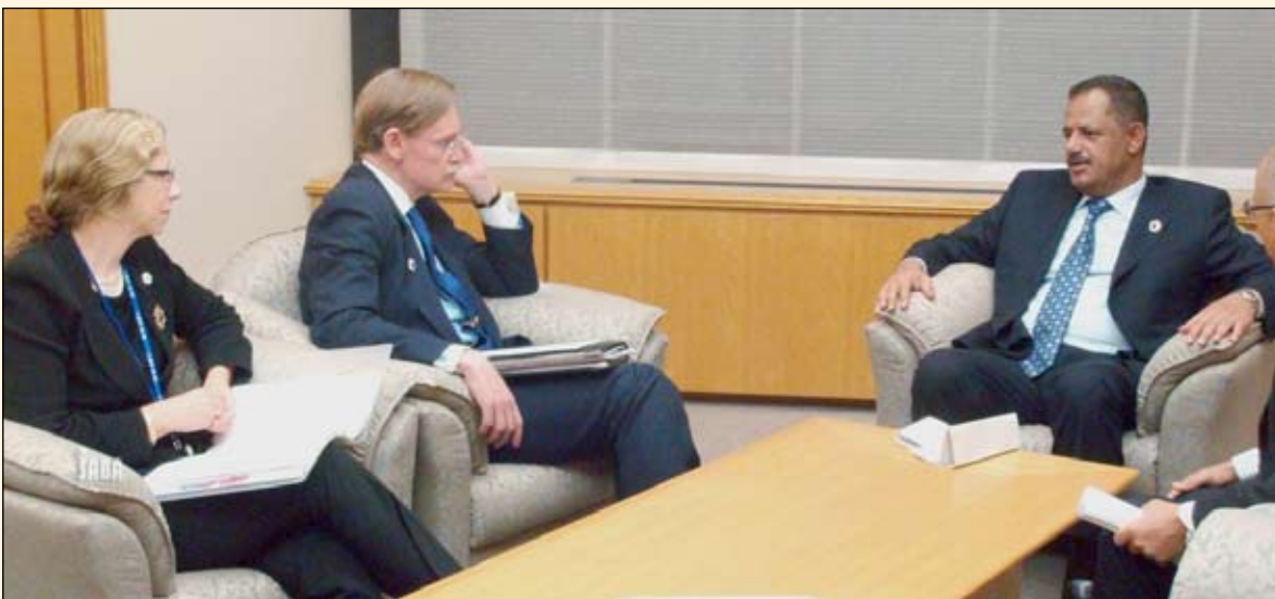
رئيس الوزراء يلتقي السيد روبرت زوليك، رئيس البنك الدولي

وتم في اللقاء التأكيد على أهمية مساندة مرفق البيئة العالمي لجانب بناء القدرات البشرية للكوادر اليمنية في المجال البيئي. وعبر الدكتور مجور عن ارتياحه لمستوى التعاون القائم مع المرفق العالمي وما يشهده من تطور مستمر.. مؤكداً حرص اليمن على الاستفادة المثلى من كافة البرامج التي يمولها المرفق سواء في مجال التنمية البيئية الصحراوية أو التنمية المستدامة للأحياء البحرية في المياه الإقليمية والسيادية للجمهورية اليمنية.