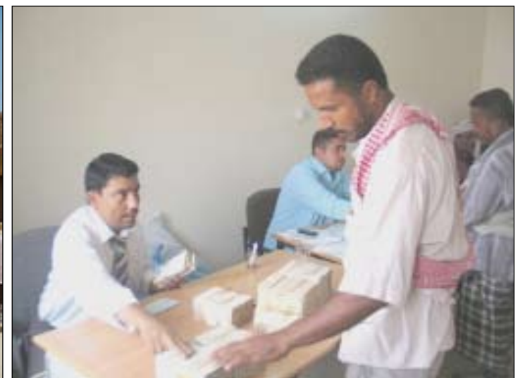
خلال توزيع التعويضات

المتضررين سيتم استكمال الإجراءات الخاصة بهم في الأيام القليلة القادمة.