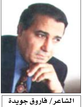
الشاعر/ فاروق جويدة