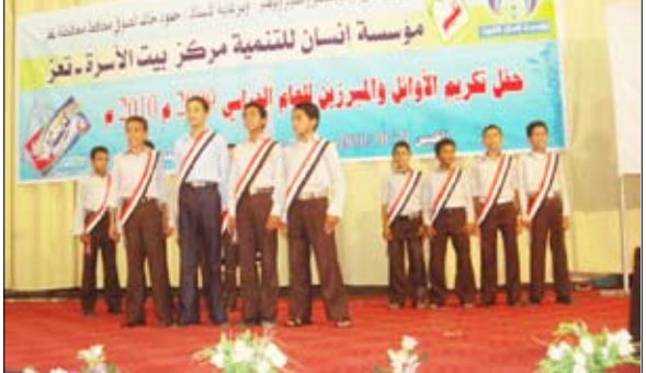
من حفل تكريم الأوائل والمبرزين للعام الدراسي الماضي

■ تغز / نعامه خالد: أقامت مؤسسة (إنسان) للتنمية في مركز بيت الأسرة أمس بمحافظة تعز حفل تكريم الأوائل والمبرزين للعام الدراسي 2009م 2010م.