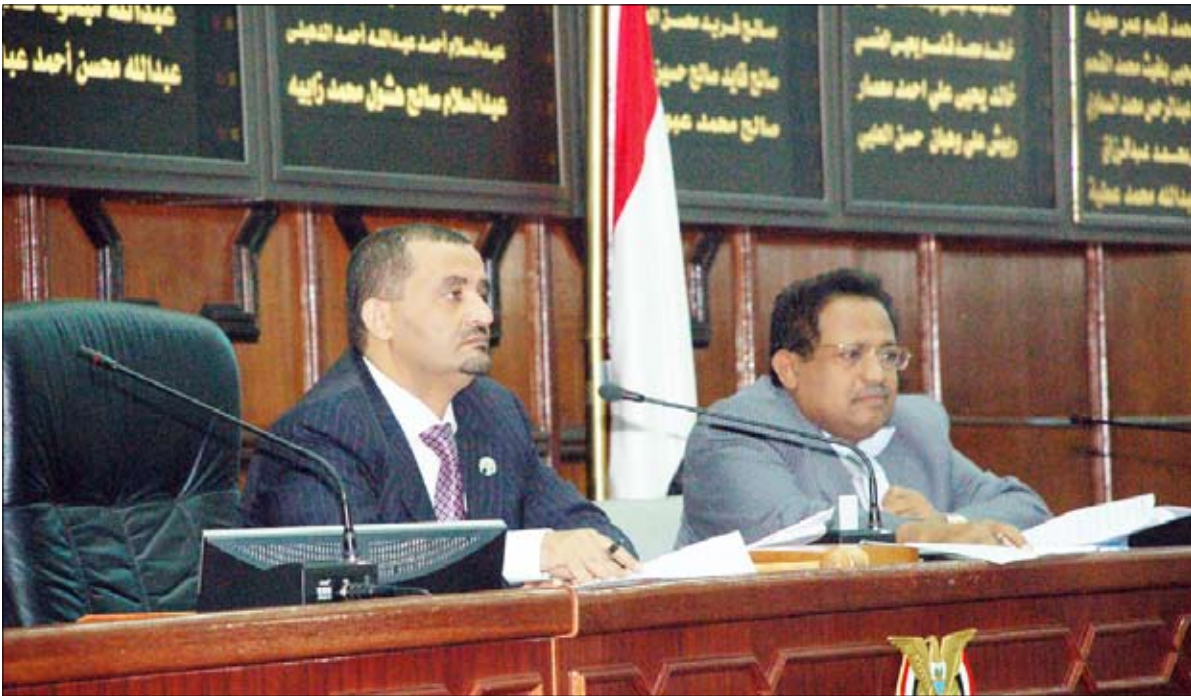
رئاسة مجلس النواب