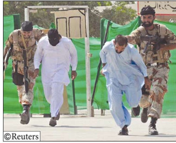
قوات أفغانية تورطت في قتل معتقلين

وكان تقرير لالامم المتحدة صدر في منتصف العام أفساد بأن قتلى المدنيين في أفغانستان زاد عددهم 31 في المئة في الشهور الستة الأولى من العام الحالي بالمقارنة مع الفترة نفسها العام الماضي. والتي بلولم في أكثر من ثلاثة أرباع عدد القتلى على المتمردين. وتراجع عدد القتلى الذين سقطوا بنيران القوات الأجنبية إلى 12 في المئة من 30 في المئة في نفس الفترة العام الماضي لأسباب أهمها تراجع كبير في أعداد قتلى الهجمات الجوية بعدما شددت قادة حلف شمال الأطلسي قواعد الاشتباك.