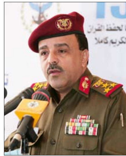
الشاطر يلقي كلمة في الدورة