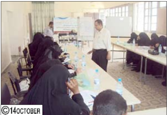
خلال بدء الدورة التدريبية لمعلمات محو الأمية

بداً يوم أمس بقاعة التدريب لمكتب التربية بأبين أعمال الدورة التدريبية لمعلمات محو الأمية وتعليم الكبار بالمحافظة بمشاركة (60) متدربة ينفذها جهاز محو الأمية بتمويل من مشروع التعليم الأساسي. وستنقل المشاركات في الدورة خلال أسبوعين محاضرات نظرية في مجالات طرق التدريس ومهارات التواصل والتعريف بالمنهاج الحديث لصفوف محو الأمية، واختيار الوسائل التعليمية المناسبة، إلى جانب الأعمال التطبيقية للمحاضرات. وفي افتتاح الدورة أكد الوكيل المساعد بالمحافظة د. حمود عثمان السعدي أهمية التدريب والتأهيل للإطلاع على كل جديد في مجالات التعليم في مجال محو الأمية والطرق والأساليب المناسبة للكبار. وأشار إلى أن السلطة المحلية بالمحافظة تولي مكافة الأمية جانباً من الاهتمام والرياسة لتطوير مستوى الوعي والثقافة العامة في أوساط المجتمع وتحديث ما تبقى من الأميين في المناطق المختلفة وخصوصاً النائية. من جانبه أشار مدير عام محو الأمية بالمحافظة يحيى أحمد اليزيدي إلى أن هذه الدورة تأتي في إطار خطة الجهاز لرفع مستوى الكفاءات المحلية وإطلاعهم على كل مستجد في طرق التدريس ورفع المهارات لديهم وطلب المشاركة بالاستيعاب الأمثل لمضامين المحاضرات وإغنائها بالناقشات والأفكار الخاصة. المنبثقة من التجارب الشخصية التي اكتسبتها المشاركات من العمل في الميدان. من جانبه أوضح مشرف الدورة