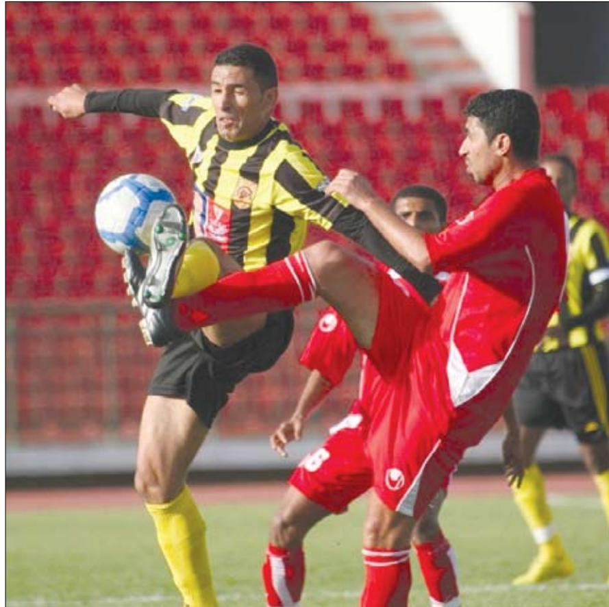
الخيرة بالزام فرق دوري النخبة بال عقود الاحترافية للاعبين ونظام الإعارة والانتقالات والغاء مجانية الدخول للملاعب ونظام التسجيل بالبطاقات الإلكترونية.

وأوضحت الإحصائية أن عدد أعضاء الهيئات الإدارية التابعة للأندية بلغوا 2898 عضواً، في حين وصل عدد فروع الاتحادات الرياضية في اليمن إلى 256 فرعاً.