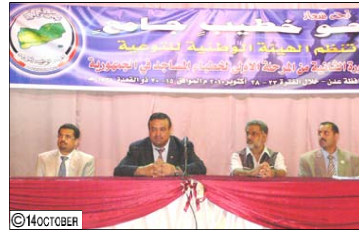
عباد خلال افتتاح الدورة التدريبية

التفتيذ للهيئة الوطنية للتوعية قد أوضح أن هذه الدورة تأتي في إطار برامج الهيئة لتعزيز قيم الاعتدال والوسطية في أوساط المجتمع من خلال تدريب وتأهيل الخطباء والمرشدين وتفعيل دورهم في المجتمع، مضيفاً أن تنظيم هذه الدورات إنما جاء من منطلق الإدراك بأهمية الخطيب ودوره المؤثر في المجتمع. وأشار إلى أن الهيئة حرصت في هذه الدورة والأمتل واستفادة المشاركين من خلال تلقيهم محاضرات علمية قيمة لارتقاء بعارفهم وقرانهم بما يحكمهم من أداء رسالتهم الإرشادية في إعلاء كلمة الله وترسيخ أسس ومفاهيم الدين الإسلامي الحنيف في النفوس وتعزيز الولاء الوطني وتعريفه على نهج الاعتدال والوسطية ونبذ التطرف والإرهاب وثقافة الكراهية. وقال إن الجميع مدعوون للعمل بحزم للوقوف أمام السلوكيات المسيئة للوطن التي تعود إلى الوقوع في مستنقع الأفكار الظلامية المتطرفة، مشدداً أن على الشباب المغرر بهم مراجعة أنفسهم والسير على طريق الأياه والأجواد ونبذ الفتن وكل السلوكيات الدخيلة. شاكراً دور الهيئة الوطنية للتوعية على تنظيم مثل هذه الدورات التي تسهم - كما قال - في تشخيص الظواهر العنيفة والآثار المترتبة عليها واقتراح الحلول. وكان د. عبد الله أبو عورية نائب المدير