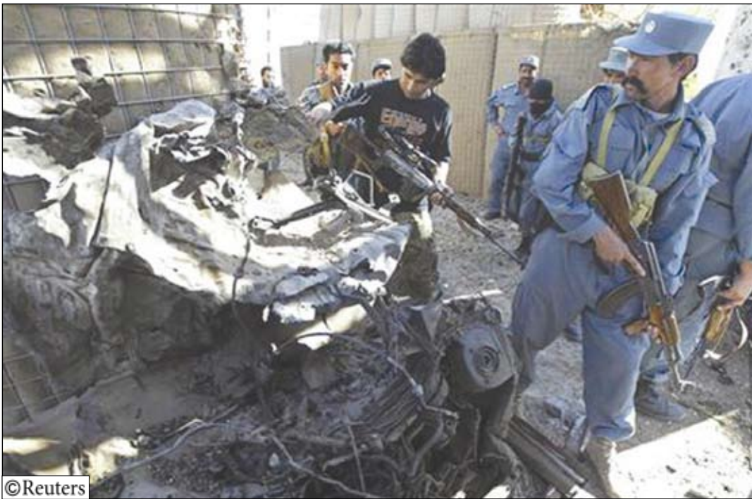
رجال شرطة بموقع هجوم انتحاري في مجمع للأمم المتحدة في هرات بغرب أفغانستان يوم أمس.

وبات الصراع يمثل عبئا على الرئيس الأمريكي باراك اوباما وحلفائه في حلف شمال الأطلسي مع تصاعد الضغوط في صفوف القوات الأجنبية وتسعى واشنطن الى البدء في سحب القوات اعتبارا من يوليو تموز من العام المقبل مع تسليم