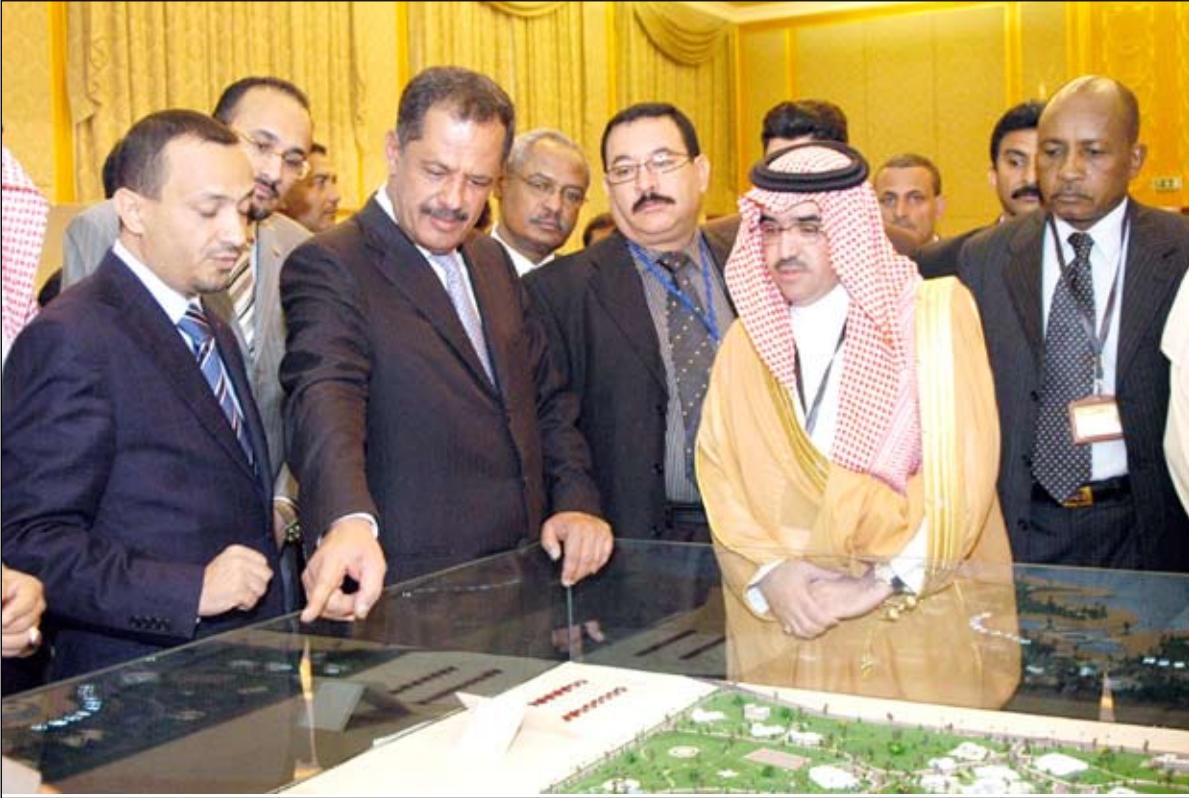
.. ويطلع على مجسمات من المشاريع الاستثمارية السياحية