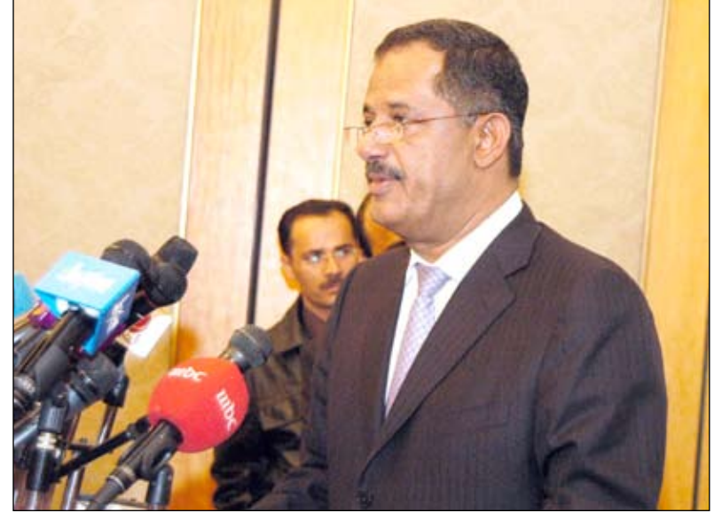
د. مجور يلقي كلمة في افتتاح الملتقى