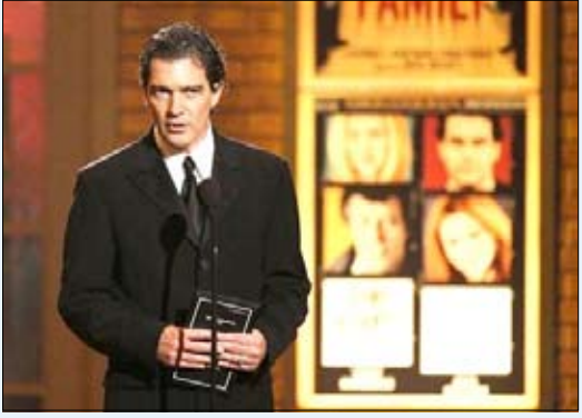
الممثل الإسباني انطونيو بانديراس في نيويورك يوم 13 يونيو 2010

تونس/ 14 أكتوبر/ رويترز: تدفق عدد من نجوم السينما العالمية يتقدمهم الممثل الإسباني الشهير انطونيو بانديراس على واحة مطاملة بأقصى الجنوب التونسي للمشاركة في فيلم عن الصراع الدولي على النفط العربي.