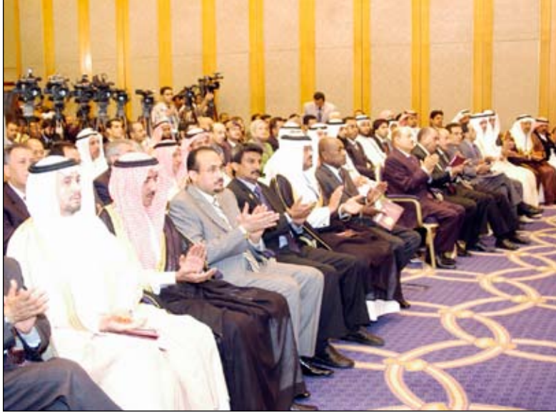
جانب من المشاركين