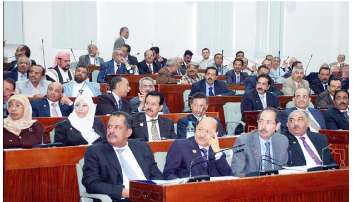
أعضاء الحكومة في مجلس النواب