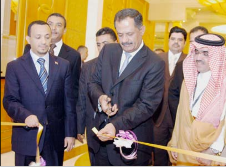
د. مجور يفتتح المعرض