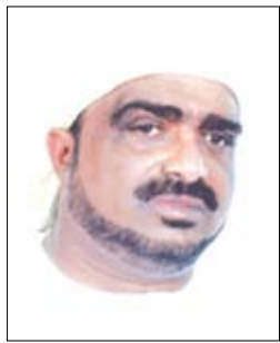
الشيخ / أنيس الحبشي

لا يشك أحد أن الرسول صلى الله عليه وسلم قد جمع الله له الحكمة كلها.. في قوله وفعله وحكمه ودعوته.. قال تعالى: (وومن يؤت الحكمة فقد أوتي خيرا كثيرا))، وقال عليه الصلاة والسلام عن نفسه: (أوتيت جوامع الكلم)!!