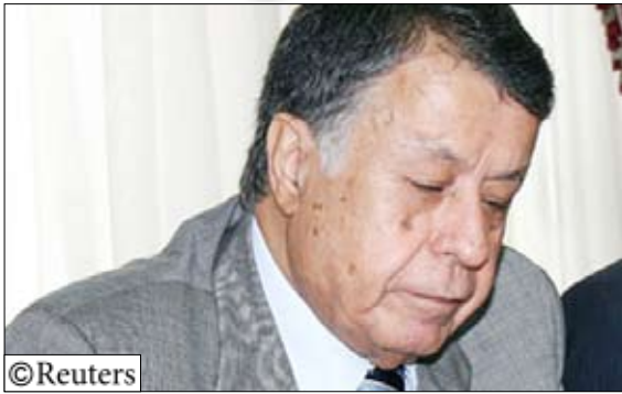
السفير محمد صبيح الأمين العام المساعد لشؤون فلسطين والأراضي العربية المحتلة

الجاري، وتحث الدول المختلفة لعدم المشاركة فيه، لأن وضع القدس مربوط بتسوية عادلة وبمطالبة المفاوضات. وأعد التذكير بأن دول العالم ومن ضمنها الولايات المتحدة ما زالت ترفض نقل سفارتها للقدس الغربية، معتبرا أن مثل هذه المؤتمرات تشجع دولة الاحتلال على تصعيد عدوانها ضد الشعب الفلسطيني، وتسهم في استمرارها بالتهرب من استحقاقات عملية السلام. وأشار إلى أن السياسات الإسرائيلية العنصرية وفرض الضرائب الجائرة ألحقت الضرر البالغ بالمرافق السياحية الفلسطينية في القدس الشرقية، مذكرا بمساعي إسرائيل لتزوير التاريخ من خلال تغيير أسماء الأماكن والشوارع من العربية إلى العبرية.