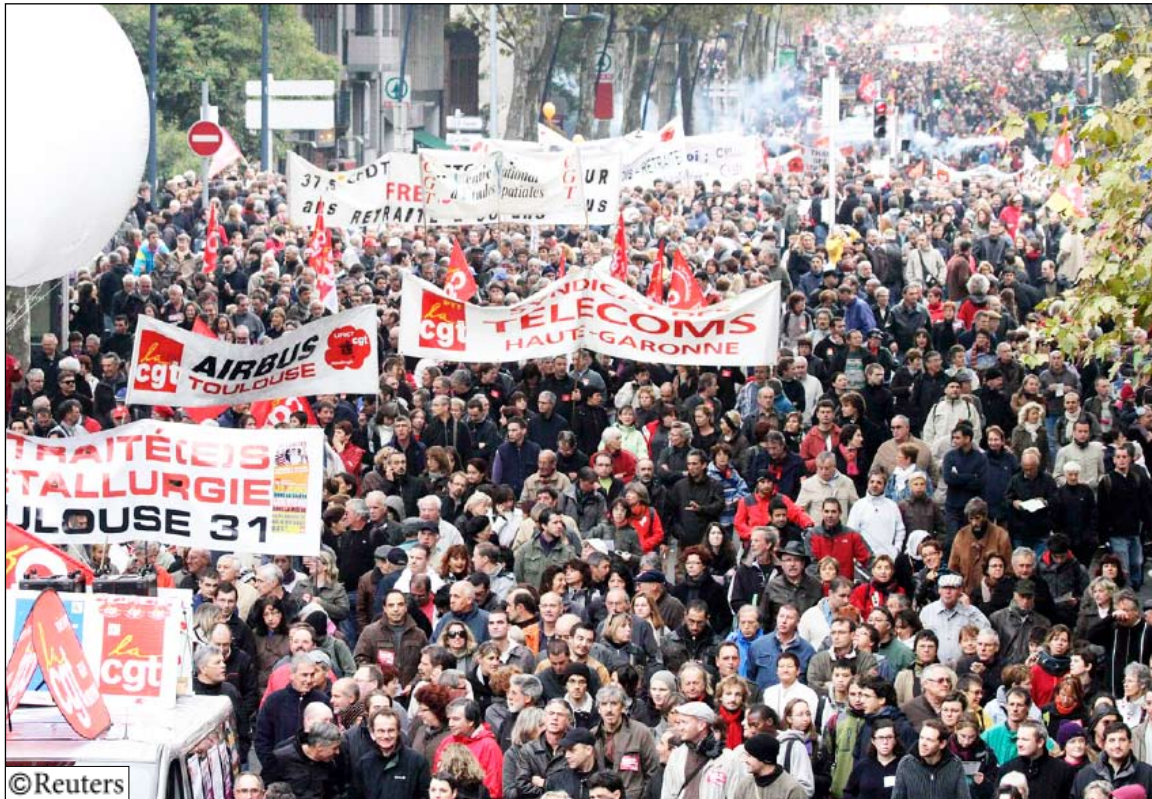
جانب من الاحتجاجات في فرنسا ضد خطة إصلاح نظام التقاعد يوم السبت الماضي

تنظيم مزيد من المسيرات في أنحاء البلاد سيكون الأسبوع الحالي اختبارا لطموح الرئيس. فإذا استمرت الإضرابات بجميع المصافي في البلاد وعددها 12 فقد يتغذ البزبن في محطات التزود بالوقود بحلول منتصف الأسبوع حسب ما أعلنته هيئة (يو.إف.إي. بي) المعنية بصناعة النفط وهو ما يعني أنه سيتعين على الحكومة دراسة استغلال احتياطات الطوارئ. وحتى الآن لم يتأثر سوى أقل من اثنين في المئة من محطات التزود بالوقود في فرنسا ويوجد في المطارات الرئيسية في البلاد وقود كاف لاستمرار التشغيل لأجل غير مسمى. إلى ذلك بدد وزير النقل الفرنسي دومينيك بوسيريو في تصريحات لراديو