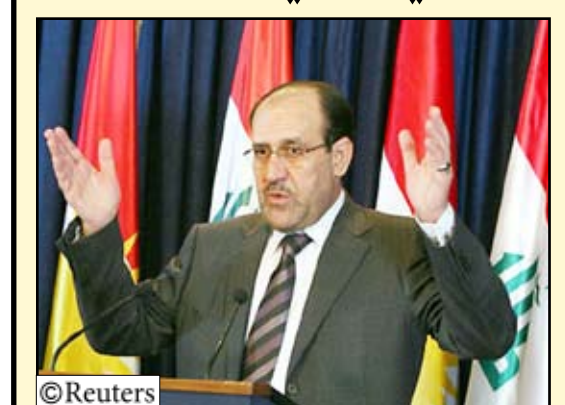
رئيس الوزراء العراقي المنتهية ولايته نوري المالكي

□ بغداد 14 أكتوبر/ رويترز: يقوم رئيس الوزراء العراقي المنتهية ولايته نوري المالكي بزيارة لكل من الأردن وإيران في إطار جهوده لحشد الدعم الإقليمي للحصول على ولاية ثانية في رئاسة الحكومة بعد أكثر من سبعة أشهر على صراع سياسي حاد لم يسفر عن مرشح واضح للفوز برئاسة الوزراء.