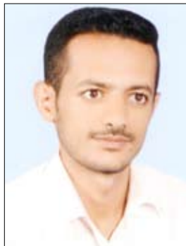
نشان محمد العثماني

مؤخرًا، وفي 2010/10/14، تحديداً خلت صحيفة 14 أكتوبر في خطوة متقدمة من خطواتها التي عودتنا عليها في الماضي والحاضر.. وهي إذ تصدر ملونة إضافة إلى زيادة في عدد الصفحات إنما يضاف ذلك إلى رصيدها الذي بدأ مشرقاً ولا يزال. ولعل الشكل الخارجي، أو الإخراج الملون للصحيفة، كما بدت مؤخرًا، يأتي بالتزامن وجنبا إلى جنب مع محتواها الثري الذي يطمئنا