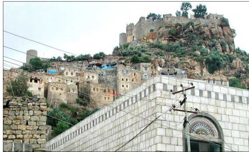
منظر من مدينة حجة

والى جانب ذلك ستواجه الحكومة مشكلة وجود العديد من الكوادر السابقة التي لم تعد تملك القدرات المهنية والعلمية، وترفض مواكبة تكنولوجيا العصر الحديث والتقدم نحو الجديد والتحديث، ولذا وجب إعادة تأهيل الكوادر المحلية في كل المرافق الحكومية والخاصة، ورفع مستوى الإنتاج، ومستوى تقديم الخدمة للمواطن، وحل المشاكل المجتمعية التي تحول تدريجياً إلى مشاكل سياسية لتصبح هذه الأولوية الهدف الرئيسي الذي سيدعم عجلة التنمية الاقتصادية نحو انطلاقا البداية لصالح المواطن لنفسه في إيجاد مكانه للمشاركة الفعالة. فالدارسات العلمية والخطط لا تكفي وحدها دون وجود وعي وطني صحيح لدى كافة شرائح المجتمع لدفع عجلة التنمية إلى الأمام.