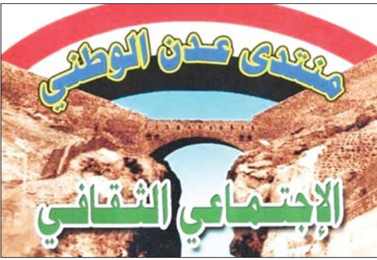
شعار منتدى عدن الوطني

الضلاحي: خليجي (20) أوجد مشاريع استثمارية وتنموية كبيرة تخدم المحافظة وأبناءها