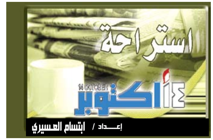
إعداد / ابتسام العسيري

روشيستير / متابعة : قال بول دوبرستين من مركز "روشيستير" الطبي في نيويورك إن أصدقاء وعائلات الأشخاص المرحين قد يفوتون الإشارات التي تدل على الاكتئاب. وأوضح دوبرستين في دراسة نشرت في دورية "علم النفس الدولي" أن المقربين من الشخص