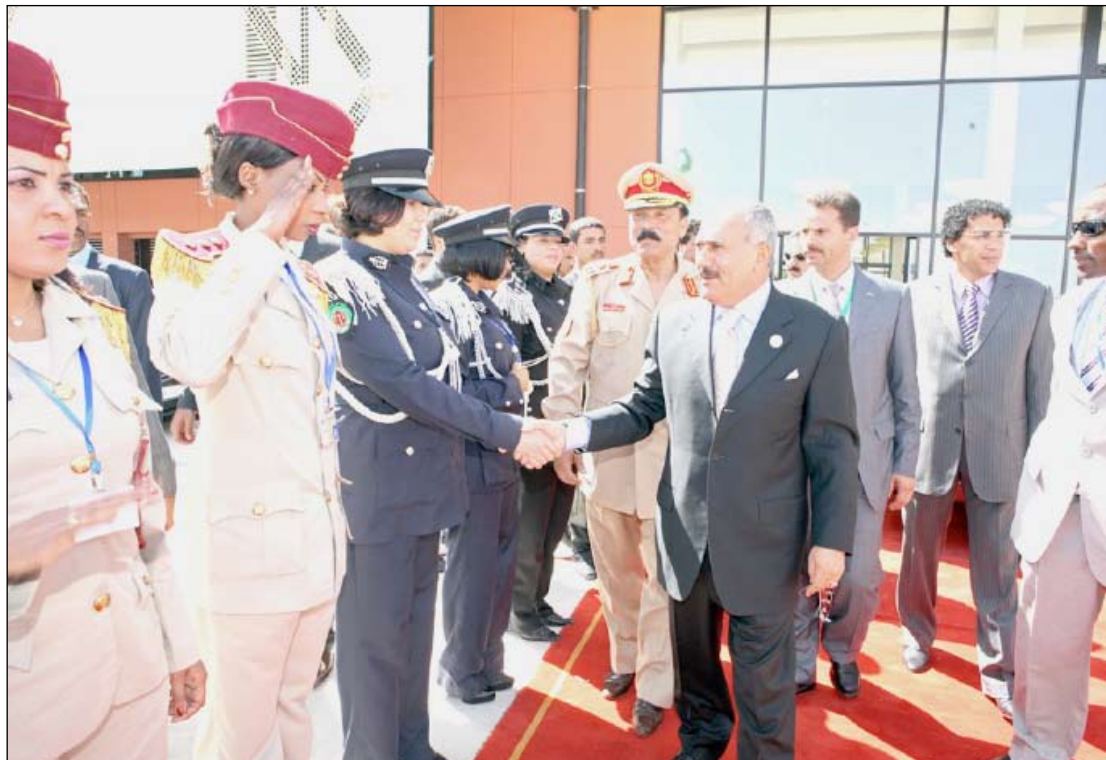
رئيس الجمهورية لدى مغادرته مدينة سرت الليبية أمس

العربي - الأفريقي المشترك. ونحن إذ نبارك لكم ولأنفسنا جميعاً هذا النجاح الباهر الذي تحقق في هذه اللقاءات التاريخية في سرت بفضل إداركم الحكيم وحسن الإعداد والتحضير لأعمال القمتين، فإننا نتطلع إلى مزيد من النجاح بالانتقال بقرارات القمتين إلى ما يلي تطالعات أمتنا العربية من جهة والشعوب العربية والأفريقية من جهة أخرى.. متمنين لكم وللشعب الليبي الشقيق دوام التقدم والازدهار. وتقبلوا أسمى اعتباري.