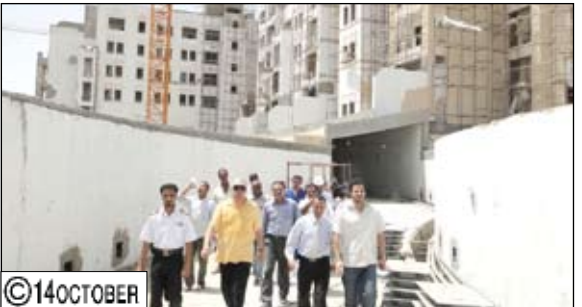
الفقيه وشائف خلال زيارة تفقدية للمنشآت السياحية والفندقية واستاد 22 مايو بـعدن