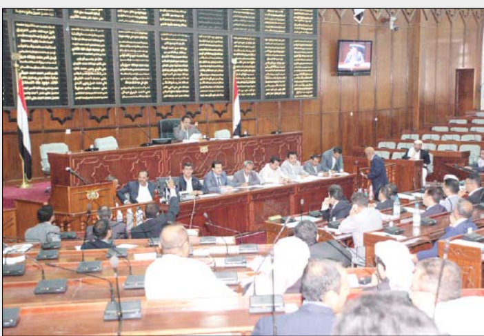
من جلسة مجلس النواب أمس

مشروع هذا القانون في جلساته القادمة. إلى ذلك أقر المجلس تكليف لجنة الدفاع والأمن التعرف على الإجراءات والمعايير واليات القبول في الكليات العسكرية والشرطية للعام الدراسي 2010-2011م وموافقة المجلس بتقرير حول نتائج ما يتم التوصل إليه جاء ذلك بناءً على ملاحظات قدمت من عدد من أعضاء المجلس بهذا الخصوص. وكان المجلس قد استهل جلسته باستعراض محضر جلسته السابقة ووافق عليه وسيواصل أعماله اليوم الاثنين بمشيئة الله تعالى.