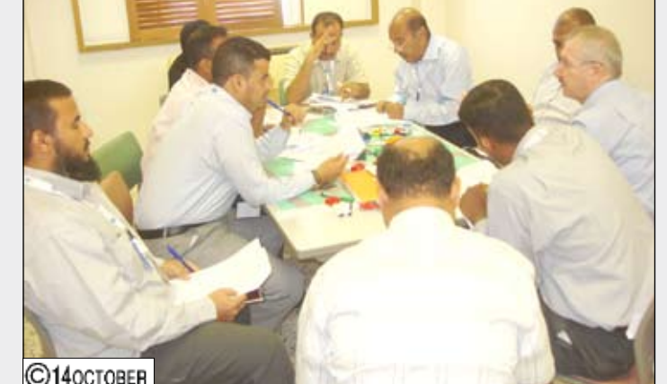
من أعمال الدورة التدريبية الخاصة بخدمات الطوارئ والإسعاف في عدن