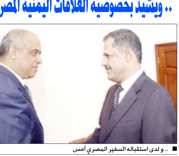
... ولدى استقباله السفير المصري أمس

صعده / سيا: استقبال رئيس مجلس الوزراء الدكتور علي محمد مجور أمس سفير جمهورية مصر العربية الشقيقة اشرف عقل بمناسبة تعيينه مؤخراً سفيراً لدى اليمن. وقد جرى خلال اللقاء تناول العلاقات الأخوية اليمنية المصرية وسبل تعزيزها وتطويرها خلال الفترة المقبلة بما ينسجم وطبيعة العلاقات المتميزة بين الشعبين الشقيقين اليمني والمصري