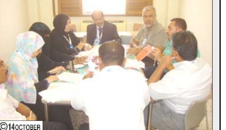
من أعمال الدورة التدريبية الخاصة بخدمات الطوارئ والإسعاف في عدن