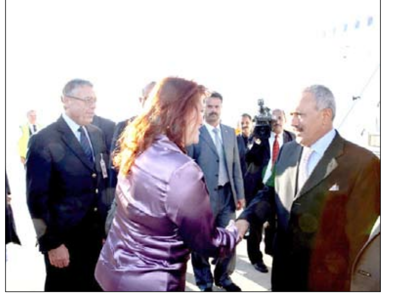
رئيس الجمهورية خلال وصوله العاصمة الفرنسية أمس