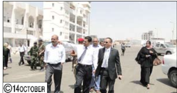
الفقيه وشائف خلال زيارة تفقدية للمنشآت السياحية والفندقية واستاد 22 مايو بـعدن

صنعاء / 14 أكتوبر: قاما بزيارة لفندق المنتج العروسة وجولدمور بالتواهي اطلعا خلالها على الاستعدادات والتجهيزات في الفندق وغرفه وأجنته ومرافقه الخدمية، كما تفقد الأخ الوزير وأمين عام المجلس المحلي سير العمل في فندق القصر الكائن بمنطقة أبو حربة بالبريقة ونسبة الإنجاز فيه وجاهزيتها للعمل الفندقية، كما زار ستاد 22 مايو واطلعا على سير العمل فيه.