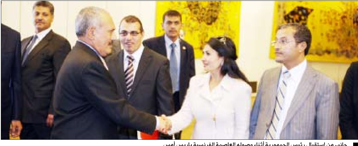
جانب من استقبال رئيس الجمهورية أثناء وصوله العاصمة الفرنسية باريس أمس

باريس / سيا: وصل فخامة الأخ الرئيس/ علي عبدالله صالح رئيس الجمهورية بعد عصر أمس إلى العاصمة الفرنسية باريس في زيارة لجمهورية فرنسا، تلبية للدعوة الموجهة إليه من فخامة الرئيس نيكولا ساركوزي رئيس جمهورية فرنسا. وسيجري فخامة الأخ الرئيس خلال الزيارة مباحثات مع فخامة الرئيس الفرنسي تركز على سبل تعزيز وتطوير العلاقات الثنائية ومجالات التعاون المشترك بين البلدين الصديقين، بالإضافة إلى بحث تطورات الأوضاع في المنطقة وفي مقدمتها تطورات عملية السلام وجهود مكافحة الإرهاب وأعمال القرصنة البحرية كما سيلتقي فخامته بعدد من المسؤولين الفرنسيين لبحث القضايا التي تهم العلاقات الثنائية ومجالات التعاون المشترك بين البلدين. كان في استقبال فخامة بيمطار باريس عدد من المسؤولين الفرنسيين وسفير اليمن لدى فرنسا خالد الاكوع وأعضاء السفارة وعدد من قيادات الحياة اليمنية بفرنسا. وقد أدلى فخامة الأخ الرئيس بتصريح لوسائل الإعلام عقب وصوله باريس عبر فيه عن سعاداته للقيام بهذه الزيارة إلى