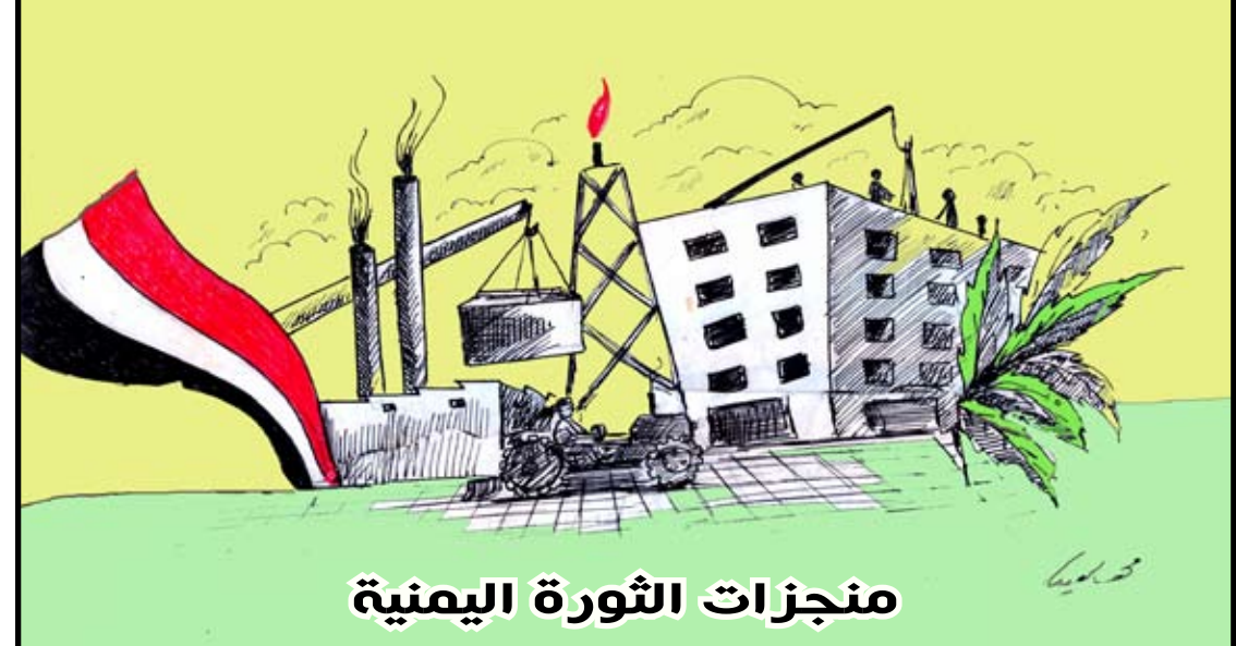
منجزات الثورة اليمنية

تصوير وتعليق / علي الدرب: كثير من المرافق والمعاهد والكليات والمدارس تهمل النظافة والتحسين والتشجير للمساحات الداخلية حتى تحولت إلى مجمع للمخلفات وهذه الصور من داخل حرم كلية الطب محافظة عدن وتظهر إضافة إلى ما ذكر تجمع مياه المجاري وسط مبانيها فمن المسؤول؟؟