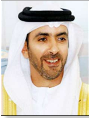
سيف بن زايد