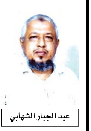
عبد الجبار الشهابي

قطاعات خاصة بالفاسدين والمتسلطين من ذراري إبليس اللعين. هذا الكلام، لا نقوله جزافاً، أو تأليفاً، أو من مقالة "قالوا" بل من واقع مر يعيشه الناس من شرق البلاد إلى مغربها، ومن جنوبها إلى شمالها، حكر لا يلقى إلا على الفقراء، ووبال لا ينال سوى الضعفاء من أبناء الفئة الدنيا بعد زوال النفثة الوسطى وانقسام السكان في هذا البلد إلى فئتين: غنية غنى فاحشاً،