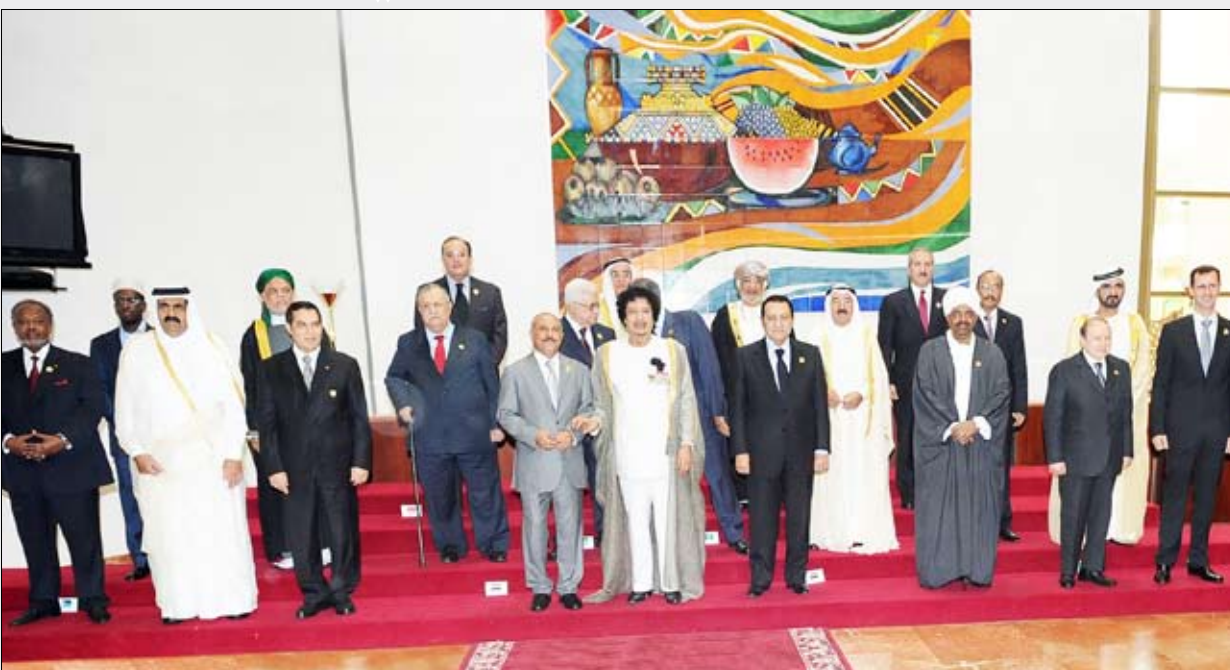
صورة جماعية للقادة العرب المشاركين في قمة سرت