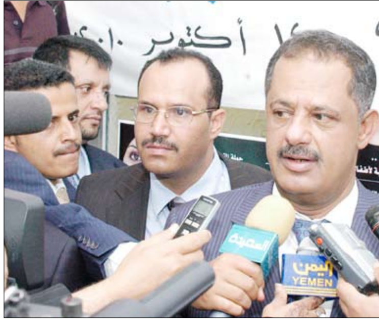
.. ويصرح لوسائل الإعلام