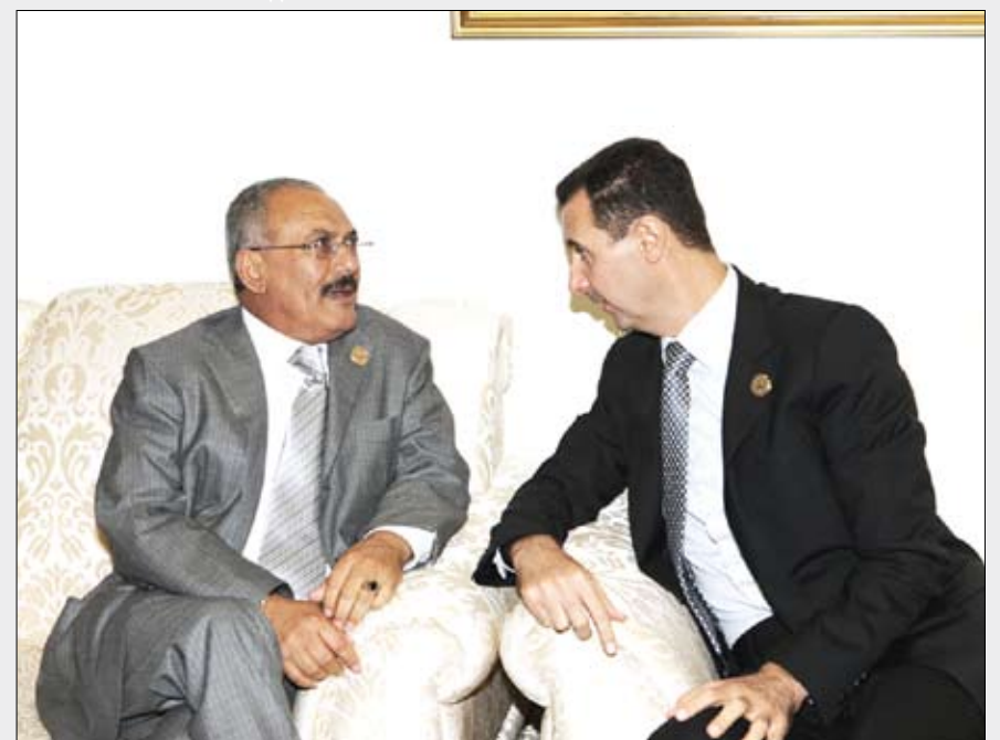
رئيس الجمهورية مع نظيره السوري