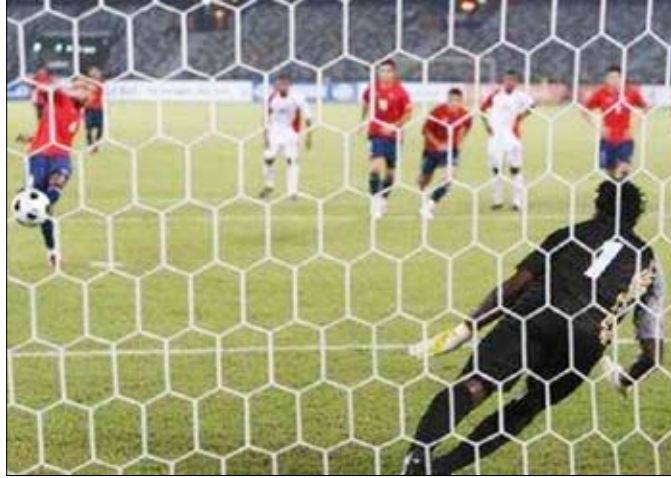
لقطتان من المباراة

داخل منطقة الجزاء. وكاد الفريق الإماراتي أن يهز شبك ضيفه الشيلي في أكثر من مرة لكن الفريق الضيف توخى الحذر الدفاعي ونجح أحد مدافعيه في التصدي لكرة برأسه على خط المرمى في ظل سقوط الحارس. كذلك أهدر المنتخب الشيلي العديد من الفرص التهديفية التي كانت كفيلة بتحقيق فوز كبير على مضيفه الإماراتي.