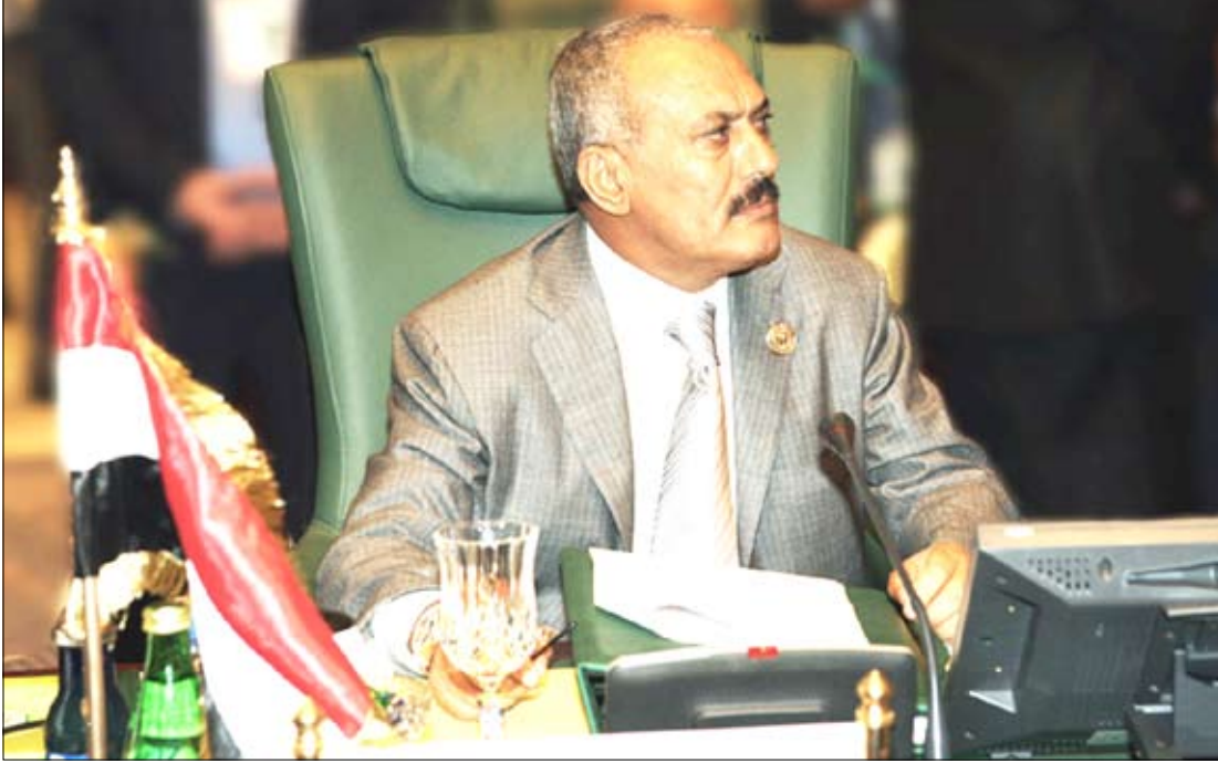
رئيس الجمهورية خلال لقائه كلمة بالقمة العربية الاستثنائية بمدينة سرت الليبية

ألقى فخامة الأخ الرئيس علي عبدالله صالح رئيس الجمهورية كلمة مهمة في القمة العربية الاستثنائية التي بدأت أعمالها بعد ظهر أمس في مدينة سرت الليبية.