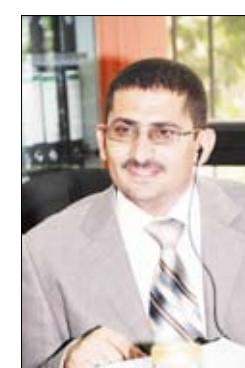
■ نائب رئيس اتحاد الفروسية

وتواصل منافسات البطولة يوم غد الاثنين بإقامة الجولة الأولى من المرحلة الثانية للبطولة والخاصة بقفز الحواجز لفئة الناشئين، في حين تستكمل منافسات فئة الناشئين بإقامة الجولة الثانية والأخيرة يوم الأربعاء القادم، والتي سيتم عقابها إقامة الحفل الختامي للبطولة وتكريم الفرسان الفائزين في البطولة.