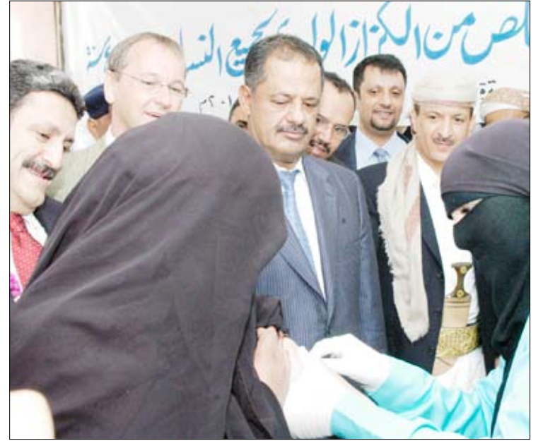
رئيس الوزراء خلال تدشين حملة التخلص من الكزاز الوليدي

صنعا/ بشير العزمي/ عبدالله بن كده/ صدام الزبيدي/ نغائم خالد/ سبأ: