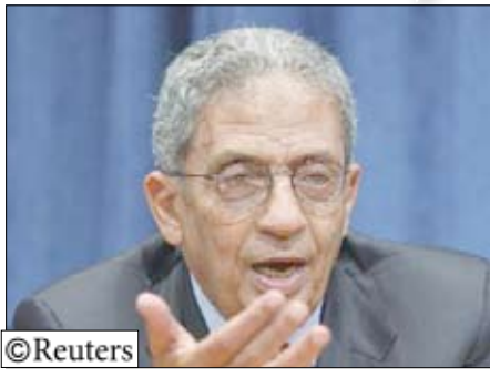
الأمين العام للجامعة العربية عمرو موسى في نيويورك يوم 24 سبتمبر 2010.

المحتلة، ووصلت المفاوضات التي بدأت في واشنطن قبل خمسة أسابيع فقط إلى طريق مسدود في 26 سبتمبر أيلول عندما رفض رئيس الوزراء الإسرائيلي بنيامين نتانياهو تمديد التجميد الذي قال أنه سيتم عشرة أشهر. وقال نيبيل أبو ردينة المتحدث باسم عباس في وقت سابق ان الرئيس الفلسطيني سيقول للدول العربية أن «استئناف المفاوضات يتطلب تمجيذاً كاملاً للانشطة الاستيطانية». وقال عباس في وقت سابق في مواصله المفاوضات لكنه لا يستطيع ذلك ما لم يجمد البناء في المستوطنات لثلاثة أو أربعة أشهر من أجل اعطاء فرصة للسلام. ويقول نتانياهو انه سيكون من المؤسف أن يخرج عباس من المفاوضات بسبب موضوع يقول انه لا علاقة له بالنتيجة المحتملة للمحادثات وهي اتفاق سلام ينهي 60 عاماً من الصراع وينشئ الدولة الفلسطينية.