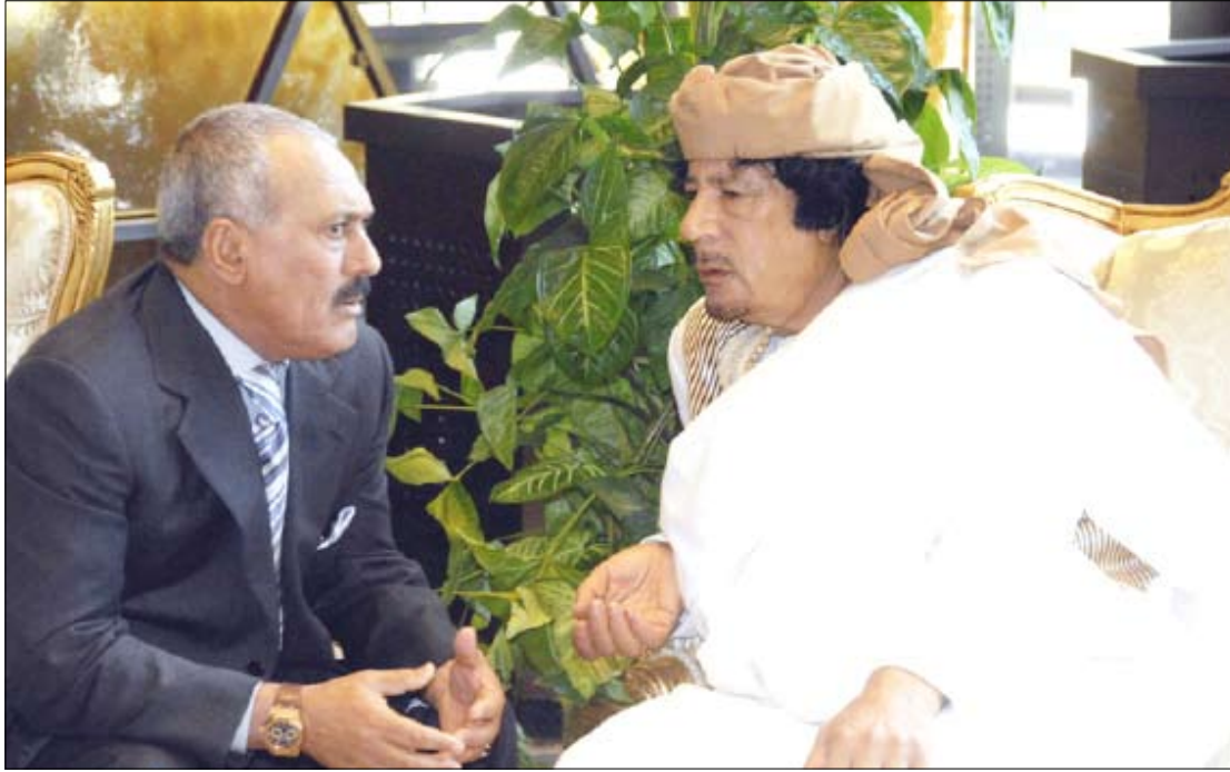
رئيس الجمهورية مع الزعيم الليبي (أرشيف)

وصل فخامة الرئيس/علي عبدالله صالح رئيس الجمهورية الليلة قبل الماضية إلى مدينة سرت بالجمهورية العربية الليبية الاشتراكية العظمى للمشاركة في أعمال القمة العربية الاستثنائية التي ستعقد اليوم السبت في سرت، وتكرس لبحث النتائج التي توصلت إليها اللجنة الخماسية المشكلة من عدد من القادة العرب خلال القمة العربية الاعتيادية الـ 22 بشأن تطوير منظومة العمل العربي المشترك في ضوء نتائج دراستها للتصورات والمقترحات العربية المقدمة في هذا الشأن وفي مقدمتها مبادرة اليمن لإنشاء اتحاد الدول العربية.