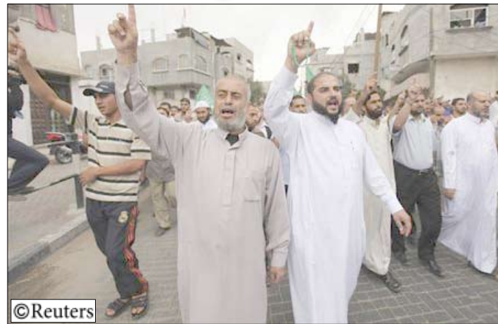
أنصار حركة حماس يشاركون في مسيرة احتجاجاً على مقتل الناشطين في شمال قطاع غزة