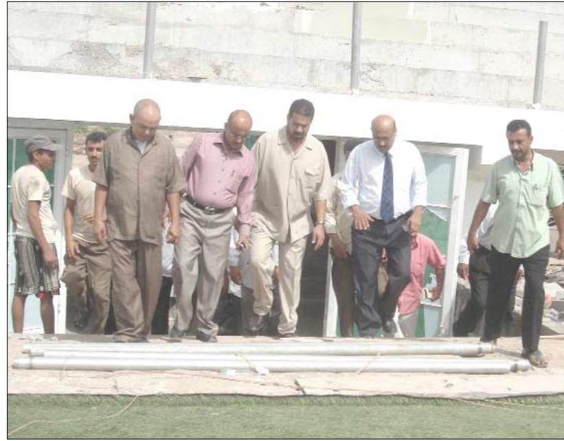
ملعب نادي الوحدة

وكانت إدارة نادي وحدة عدن قد حضرت بأغلبية أعضائها إلى الملعب لتدافع عن ممتلكات النادي.