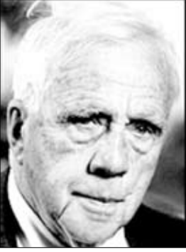
روبرت لي فروست

يقول البعض إن العالم سينتهي بالنيران والبعض الآخر يقول إنه سيتجمد وكثيراً ما لسعني الأشواق أؤيد أصحاب النار تكفى لو كانت النهاية ستعاد أظنني خبرت ما يكفي من الأحقاد لأقول إن الجليد للدمار يكفي ويزيد