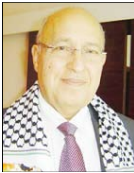
د. نبيل شعث

□ واشنطن / متابعة: قالت مصادر مطلعة إن الوفد اليمني المشارك في اجتماعات صندوق النقد والبنك الدوليين المقررة اليوم الجمعة في واشنطن برئاسة نائب رئيس الوزراء للشؤون الاقتصادية وزير التخطيط والتعاون الدولي عبدالكريم الأرحبي حمل معه قائمة بالأولويات والمشاريع التي تحتاج اليمن إلى تمويلاتها في إطار ما يتوقع تقديمه عبر صندوق دعم التنمية في اليمن الذي أقر