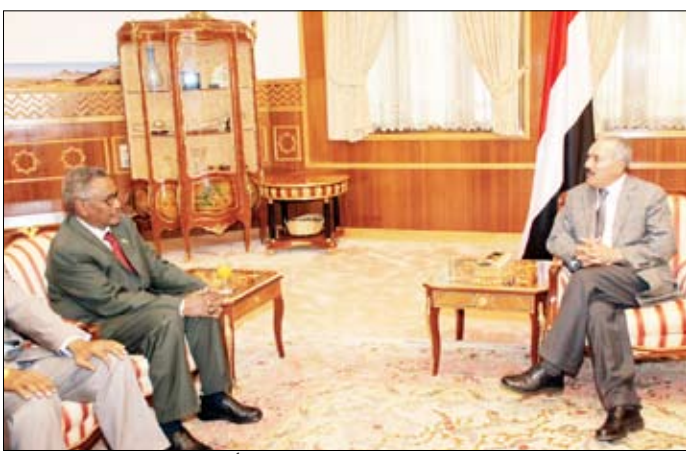
رئيس الجمهورية لدى استقباله عبدالرحمن محمد محمود أمس

□ منعاه / سيا: استقبل فخامة الأخ الرئيس علي عبدالله صالح رئيس الجمهورية أمس عبدالرحمن محمد محمود رئيس ولاية بونت لاند بالصومال والوفد المرافق له الذي يزور اليمن حالياً. وجرى تناول الأوضاع في الصومال ومنها الأوضاع في ولاية بونت لاند، ونتائج المباحثات التي أجراها رئيس ولاية بونت لاند مع المسؤولين في اليمن، بالإضافة إلى القضايا المتعلقة بمكافحة القرصنة البحرية في خليج عدن وتنسيق الجهود المبذولة في هذا المجال. وقد أكد فخامة