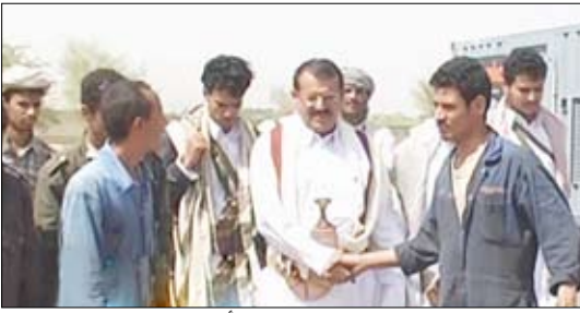
محافظ مارب يتفقد محطة الكهرباء بعد تعرضها لأعمال تخريبية

□ 14 أكتوبر / متابعة: قالت الأجهزة الأمنية بمحافظة مارب إن عناصر تخريبية ومعها مجاميع مسلحة من آل جلال بمديرية الوادي قامت بإطلاق النار من مختلف الأسلحة على مواقع الدغوش الأمنية في منطقة الحسين، وقد تم الرد عليها من قبل الجنود المرابطين في تلك المواقع لحماية محطة الكهرباء الغازية. وأوضح أن تبادل إطلاق النار مع العناصر التخريبية لم يسفر عن أي إصابات بشرية بين الطرفين. وأضافت قائلة إن النيران التي أطلقتها العناصر التخريبية ومعهم مجاميع