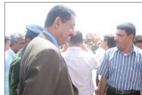
خلال افتتاح مكتب الثقافة