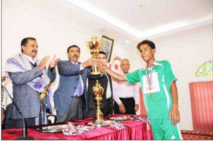
تكريم أحرار تاربة