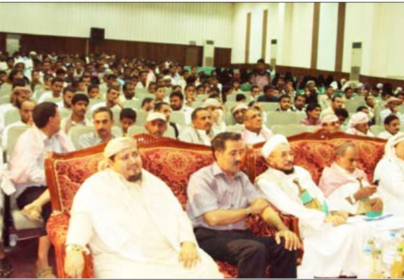
من احتفال الحديدة بأعياد الثورة