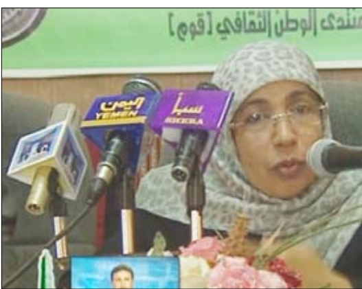
حمد تلقي كلمة في اللقاء التشاوري