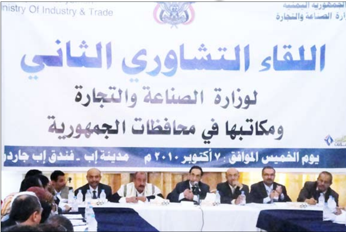
جانب من اللقاء التشاوري لوزارة الصناعة والتجارة بمحافظة إب

وناقش اللقاء اتجاهات العمل المستقبلية للإدارات العامة بالوزارة ومكاتبها في أمانة العاصمة والمحافظات والسبل الكفيلة بتجاوز الصعوبات الموجودة بما يحقق أداء فاعلاً وكفؤاً لحماية المستهلك وتحقيق استقرار الأسواق وتنمية الاقتصاد الوطني بشكل عام من خلال الدفع بعجلة التنمية الصناعية.