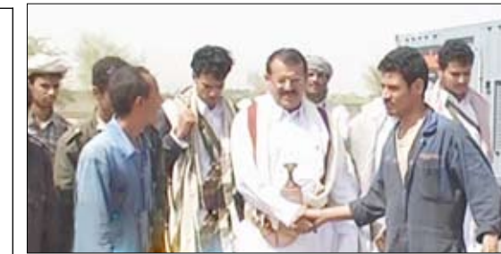
محافظ مارب يتفقد محطة الكهرباء بعد تعرضها لأعمال تخريبية

□ 14 أكتوبر / متابعات: قالت الأجهزة الأمنية بمحافظه مارب إن عناصر تخريبية ومعها مجاميع مسلحة من آل جلال بمديرية الوادي قامت بإطلاق النار من مختلف الأسلحة على مواقع الدغوش الأمنية في منطقة الحسين، وقد تم الرد عليها من قبل الجنود المرابطين في تلك المواقع لحماية محطة الكهرباء الغازية. وأوضحت أن تبادل إطلاق النار مع العناصر التخريبية لم يسفر عن أي إصابات بشرية بين الطرفين. وأضافت قائلة إن النيران التي أطلقتها العناصر التخريبية ومعهم مجاميع