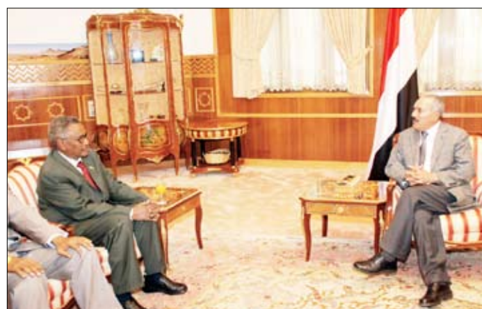
رئيس الجمهورية لدى استقباله عبدالرحمن محمد محمود أمس

□ سنعاء / سيا: استقبل فخامة الأخ الرئيس علي عبدالله صالح رئيس الجمهورية أمس عبدالرحمن محمد محمود رئيس ولاية بونت لاند بالصومال والوفد المرافق له الذي يزور اليمن حالياً. وجرى تناول العلاقات اليمنية الصومالية والأوضاع في الصومال ومنها الأوضاع في ولاية بونت لاند، وتناول المباحثات التي أجراها رئيس ولاية بونت لاند مع المسؤولين في اليمن، بالإضافة إلى القضايا المتصلة بمكافحة القرصنة البحرية في خليج عدن وتنسيق الجهود المبذولة في هذا المجال. وقد أكد فخامة