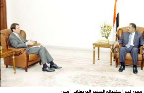
د. مجور لدى استقباله السفير البريطاني أمس

صنعاء / سيا: وصف رئيس مجلس الوزراء الدكتور علي محمد مجور العلاقات اليمنية البريطانية الراهنة بالمتينة والمزدهرة على كافة الصعد السياسية والاقتصادية والتنموية والأمنية.. منوها بدعم الأصدقاء البريطانيين لمسيرة التنمية في اليمن ومساندة جهودهم لمواجهة التحديات سواء بصورة مباشرة أو عبر مجموعة أصدقاء اليمن.