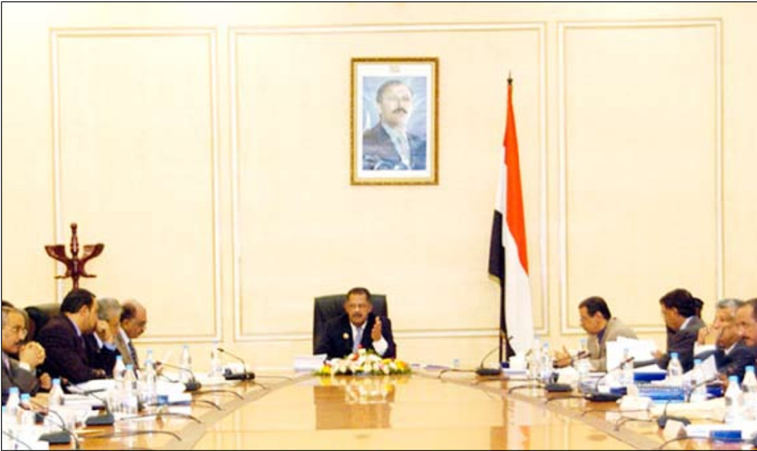
د. مجور يترأس اجتماع مجلس الوزراء

ناقش مجلس الوزراء في اجتماعه الأسبوعي أمس برئاسة رئيس المجلس الدكتور علي محمد مجور مذكرة نائب رئيس الوزراء للشؤون الاقتصادية وزير التخطيط والتعاون الدولي بشأن الخطوات الاجرائية والمؤسسية المرتبطة بانضمام اليمن إلى مبادرة الشفافية العالمية، وما تم إنجازه منها حتى الآن والخطوات الوطنية التكميلية اللازمة للانضمام إلى هذه المبادرة المتوقع خلال العام القادم.