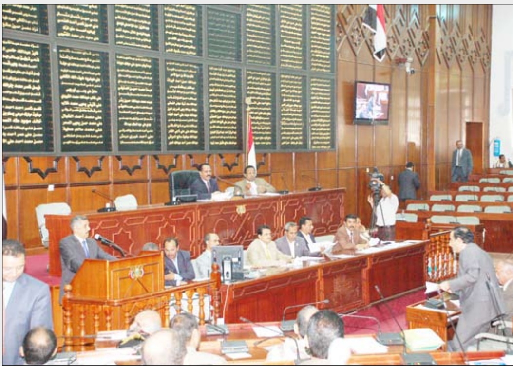
من جلسة مجلس النواب أمس

وافق مجلس النواب في جلسته المنعقدة أمس برئاسة رئيس المجلس يحيى علي الراعي على انضمام اليمن إلى اتفاقية المنظمة الدولية للاتصالات المتنقلة عبر الأقمار الاصطناعية (الامسو) بصيغتها المعدلة في عام 2008م.