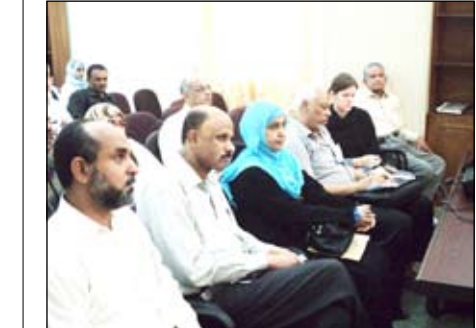
جانب من الحضور