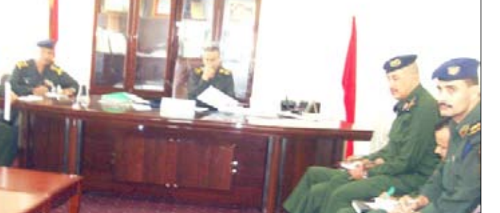
اجتماع مدراء ادارات امن تعز

تعز / نغام خالد : نظمته جمعية الأغابرة والأعروق الاجتماعية الخيرية أمس بالتنسيق مع صندوق رعاية وتأهيل المعاقين ورعاية وزارة الشؤون الاجتماعية والعمل في محافظة تعز حفل تسمية توزيع الأجهزة التعويضية لذوي الاحتياجات الخاصة (الدفعة الأولى بمديرية حيفان والتي استهدفت 55 معاقاً من الفنتين. وفي الاحتفال الذي تخللته فقرات غنائية وخواطر من قبل المعاقين أشاد الأمين العام للمجلس المحلي