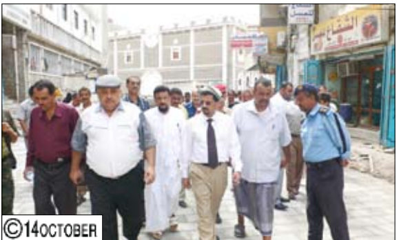
شائف خلال تفقده مشاريع خليجي (20)