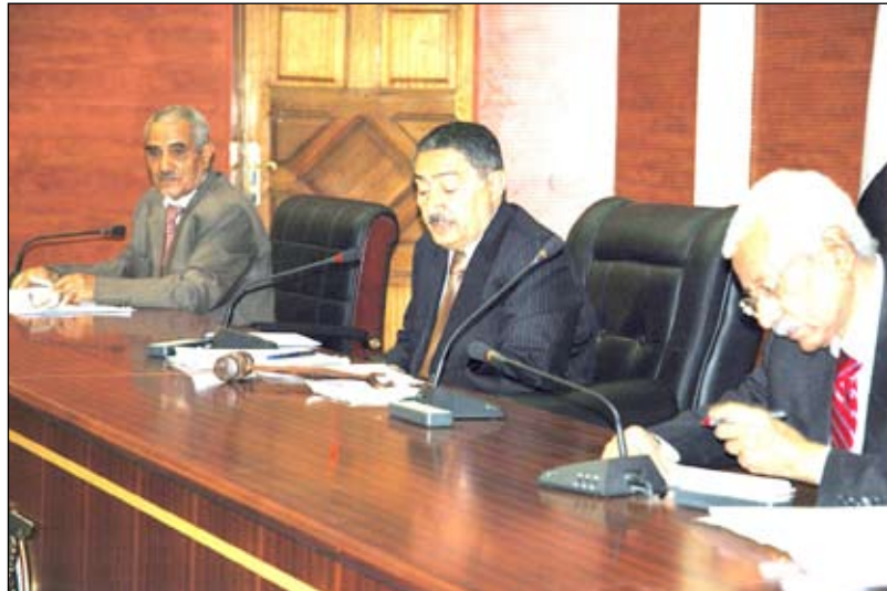
عبد الغني يترأس دورة مجلس الشورى

عقد مجلس الشورى أمس أول اجتماعات دورة انعقاده السنوية الثانية للعام الجاري برئاسة رئيس المجلس عبد العزيز عبد الغني الذي خصه لمناقشة موضوع « واقع البحث العلمي في اليمن وسبل تطويره ».