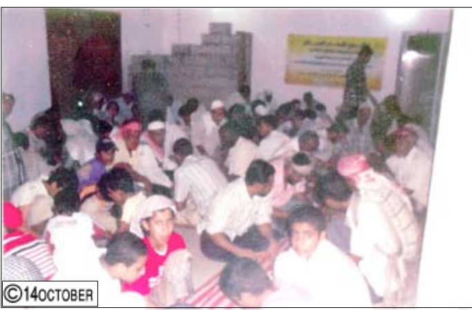
من نشاطات مؤسسة (الرفاه) للتنمية