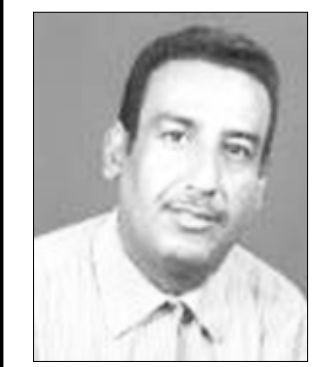
علي منصور مقراط

كانت الزيارة الميدانية التي قام بها فخامة الرئيس علي عبدالله صالح لمحافظات أبين مفاجئة جداً وأثارت جدلاً واسعاً في أوساط الناس عامة داخل المحافظة وسائر المحافظات الأخرى والسبب أنها جاءت بدون موعد مسبق أو تحضيرات واستعدادات وترتيبات أمنية وغيرها لا سيما في هذه الظروف المعروفة