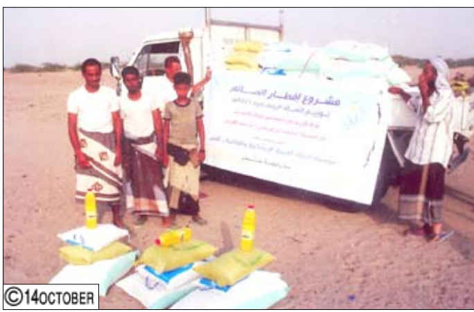
من نشاطات مؤسسة (الرفاه) للتنمية

إطار خطتها العامة، حيث قامت بتوزيع سلة غذاء متكاملة من الأرز والسكر والزيت والفيمتو والدقيق على أكثر من تسعمائة أسرة فقيرة في مختلف مديريات محافظة عدن، كما أقامت المؤسسة خلال شهر رمضان الماضي موائد إفطار لحوالي تسعة آلاف وثمانمائة شخص في عدد من المساجد والمراكز الثقافية ومراكز المعاقين، بالإضافة إلى إقامة موائد متنقلة في بعض مدن محافظة عدن وضواحيها وفي لبحج وأبين.