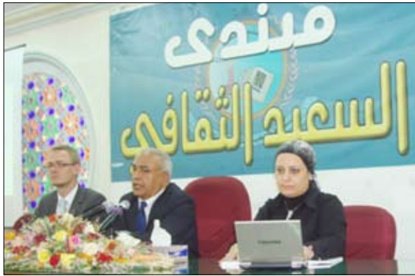
من محاضرة المؤلفات الأدبية الألمانية