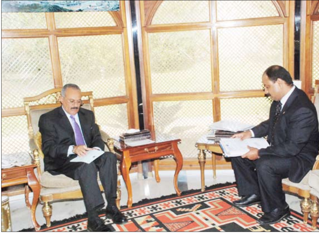
رئيس الجمهورية لدى لقائه لجنة معالجة قضايا الاراضي بعدن

اطلع فخامة الأخ الرئيس علي عبدالله صالح رئيس الجمهورية ومعه الأخ عبد ربه منصور هادي نائب رئيس الجمهورية على تقرير مدير مكتب الهيئة العامة للأراضي والمساحة والتخطيط العمراني في محافظة عدن شيخ بانافع، والمتضمن ما تم تنفيذه من قرارات لجنة معالجة قضايا الأراضي والتأمينات التي يتولى رئاستها الأخ نائب رئيس الجمهورية وما تم صرفه من أراض كتعويضات في قضايا التأمين وذلك في المخطط الواقع جنوب المصافي ومدينة الشعب لألفين و700 حالة.