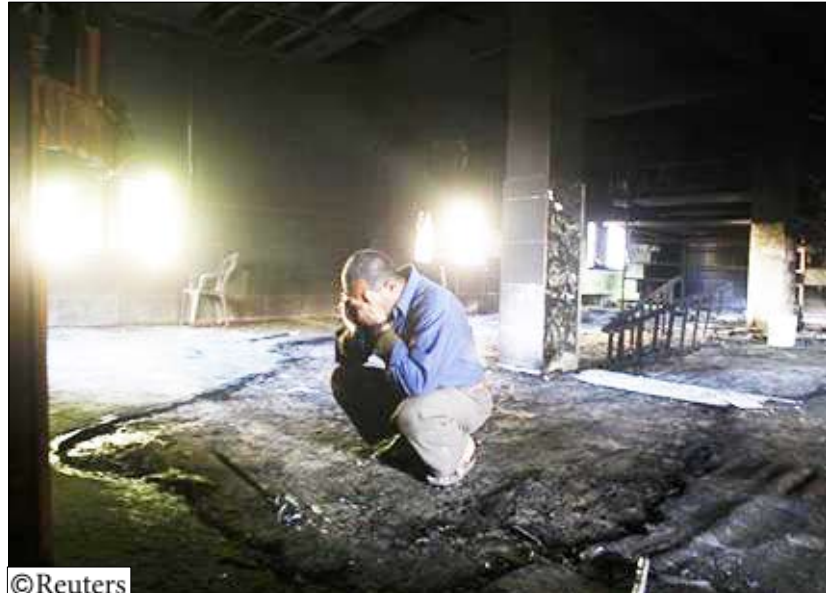
فلسطيني في مسجد اصرت فيه النار في قرية اللبن الشرقية يوم 4 مايو 2010.

رام الله (الضفة الغربية) 14 أكتوبر / رويترز : اتهم فلسطينيون مستوطنين إسرئيليين بإضرار النار في مسجد بالضفة الغربية المحتلة يوم أمس الاثنين في حادث تزامن مع الجهود التي تبذلها الولايات المتحدة لانتقاد محادثات السلام المتعثرة بسبب قضية البناء في المستوطنات الإسرائيلية. وقال مسؤول محلي في بلدة بيت فجار جنوبي مدينة بيت لحم ان مستوطنين يهودا اقدموا فجر يوم الاثنين على احراق مسجد البلدة وأن النيران التهمت 15 مصحفاً كما اتت على سجاد المسجد قبل ان يتمكن الأهالي من اخماد النيران. وقال علي ثوابته مدير بلدية بيت فجار في اتصال هاتفي مع رويترز «ستة مستوطنين جاؤوا في سيارة الساعة الثانية والنصف وداهبوا مسجد الانبياء على مدخل البلدة وقاموا بحرقه وكتابة شعارات بالعبرية منها الحمام رقم 18 . وأضاف «عندما رأى الناس النار في المسجد هرعوا اليه لاطفائه. كانت النيران اتت على السجاد إضافة الى 15 مصحفاً. هذه اول مرة يهاجم المستوطنون مسجد القرية. هناك مستوطنة بالقرب منا اسمها مجدل عوس. وقال الجيش الإسرائيلي الذي يحتل الضفة الغربية منذ حرب عام 1967 انه يحقق في الهجوم الذي وقع في بيت فجار قرب بيت لحم. وقالت المتحدث باسم الجيش اللتفنتات كولونيل افيثال لبيوفيتز لرويترز «هذا حادث خطير جدا نراه على درجة كبيرة من الخطورة ونعتزم العثور على المسؤولين عنه بأقصى سرعة ممكنة».