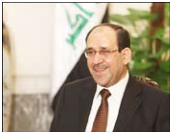
رئيس الوزراء العراقي المنتهية ولايته نوري المالكي.

التحالف الوطني...نحن لدينا تصورات الآن ونحن نعتبر ان ترشيح المالكي كان خطوة ايجابية.