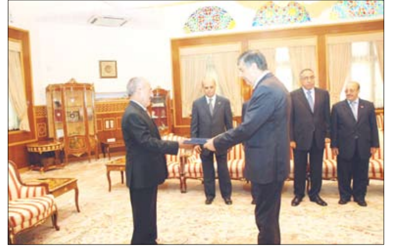
الرئيس يتسلم أوراق اعتماد عدد من السفراء