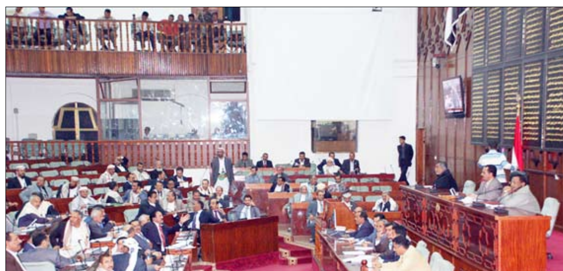
من جلسات مجلس النواب (من الازديف)