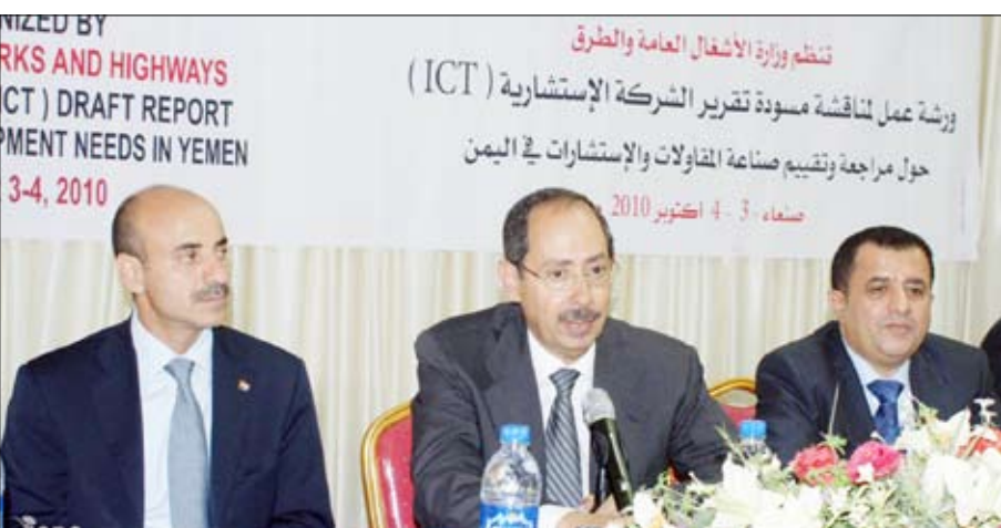
من ورشة العمل الخاصة بمراجعة مسودة تقرير الشركة الاستشارية (اي سي تي)

والاستشارات .. مؤكدا حاجة هذا القطاع إلى المزيد من التطوير .. معبرا عن أمله في أن تخرج هذه الورشة بنتائج وتوصيات فاعلة تصب في مصلحة تطوير القطاع وتحسين أدائه .