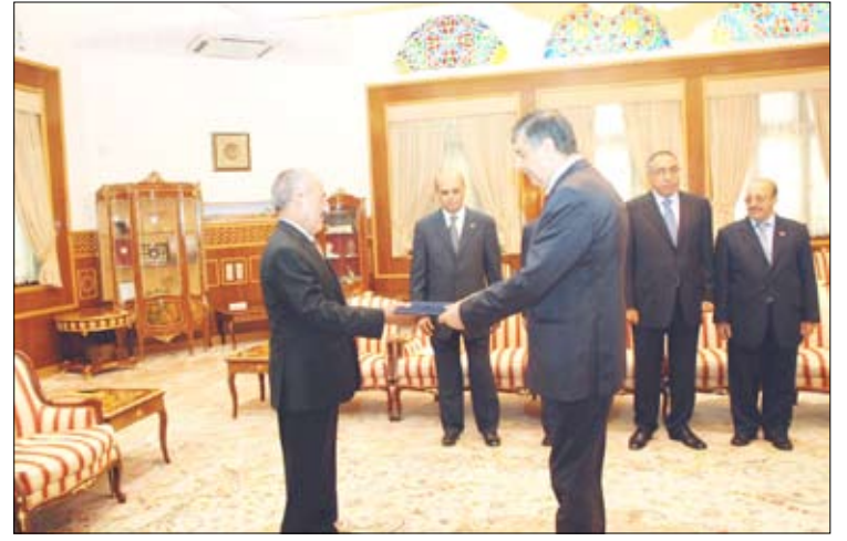
الرئيس يتسلم أوراق اعتماد عدد من السفراء