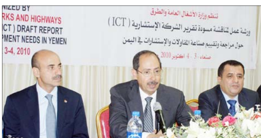
من ورشة العمل الخاصة بمراجعة مسودة تقرير الشركة الاستشارية (اي سي تي)

والاستشارات . مؤكداً حاجة هذا القطاع إلى المزيد من التطوير . معبرا عن أمه في أن تخرج هذه الورشة بنتائج وتوصيات فاعلة تصب في مصلحة تطوير القطاع وتحسين أدائه . من جانبها عرضت شركة المقاولات والاستشارات في اليمن والعمل هذه الورشة لتقييم ومراجعة صناعة المقاولات والاستشارات في اليمن والعمل على الارتقاء بها وتطويرها . مشيرة إلى اهتمام الحكومة بهذه الصناعة التي تمثل حجر الزاوية في عملية التنمية الشاملة . منوها بأهمية مراجعة كافة الجوانب المتعلقة بصناعة المقاولات من أجل خلق بيئة ملائمة ومستدامة للارتقاء بقطاع المقاولات والاستشارات . واستعرض الكرشمي المحاور التي تطرق إليها التقرير الأولي للشركة الاستشارية في الجوانب المؤسسية والموارد البشرية والتشريعية المنظمة لصناعة المقاولات والاستشارات والتوصيات وخطة العمل المستقبلية . مشيرة إلى أن الورشة ستقف أمام ما توصلت إليه الشركة الاستشارية المكلفة بمراجعة وتقييم قطاع المقاولات والاستشارات . وتتناول الورشة التي ينظمها على مدى يومين برنامج تنمية الطرق الريفية التابع لوزارة الأشغال العامة والطرق عدداً من المحاور تشمل على مراجعة شاملة لقطاع المقاولات والاستشارات في اليمن واحتياجات تطوير قطاع المقاولات والاستشارات والدعم المؤسسي والتغيير والحوكمة للشركات والمؤسسات والهيئات والجوانب التمويلية المتعلقة بصناعة المقاولات والاستشارات .