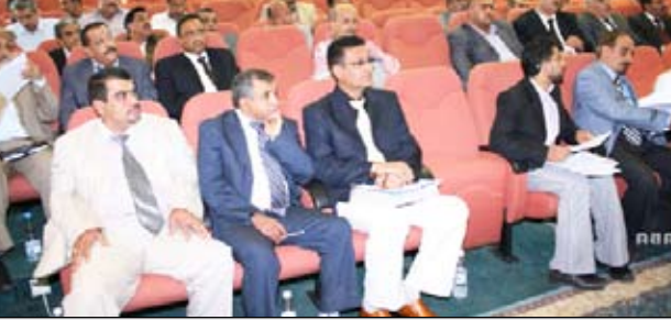
جانب من المشاركين في الاجتماع