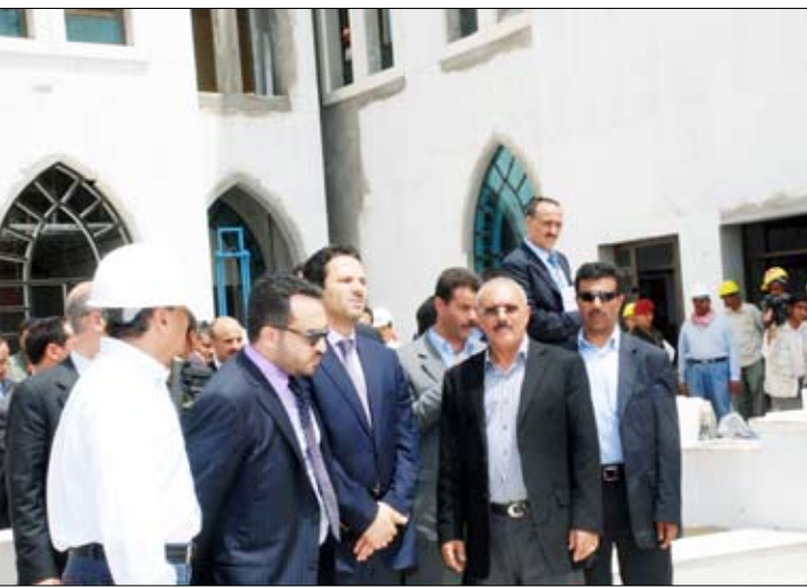
.. ويتفقد فنادق ايواء اللاعبين