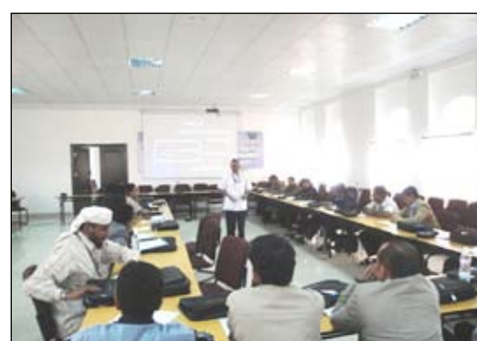
■ من فعاليات الورشة التدريبية للاعلاميين

وأشاد فخامته بتلك الانجازات وكذا بمستوى النظافة