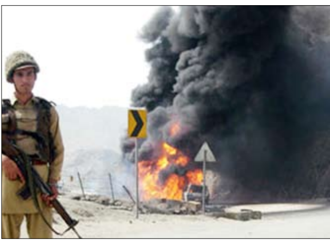
خلال إحراق شاحنات امداد لقوات الأطلسي

كما وقع هجوم ثالث الاثنين الماضي بالمروريات إلى أي مقتل خمسة مدنيين، حيث أكد الناتو أن طائراته أطلقت النار انطلاقاً من أفغانستان وأنه ليس لديه علم بسقوط ضحايا.