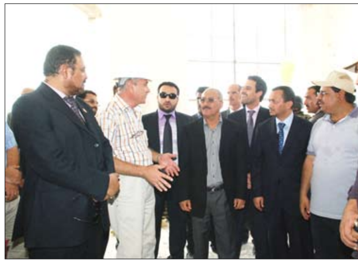
.. ويتفقد ملعب أبين