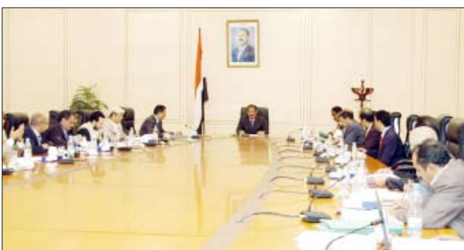
.. د. مجور لدى ترؤسه اجتماع مجلس إدارة صندوق إعمار صعدة أمس

صنعا / سيأ: ناقش مجلس إدارة صندوق إعمار محافظة صعدة في اجتماعه أمس برئاسة رئيس مجلس الوزراء الدكتور علي محمد مجور عدداً من المواضيع المتعلقة بإعادة إعمار ما خلفته حرب فنتنة التمرد والتخريب في صعدة وحرف سفيان وبني حشيش، والجهود المبذولة من قبل الصندوق بهذا الشأن. وقد ناقش المجلس تقرير الإدارة التنفيذية عن نشاط الصندوق للفترة من 18 يونيو حتى 30 سبتمبر 2010م . وأوضح التقرير مستوى تنفيذ القرارات السابقة لمجلس الإدارة بشأن الجوانب الخاصة بإعادة الإعمار وفقاً للأولويات المحددة من قبل المجلس وفي المقامة إعادة إعمار المنازل المتضررة والمنشآت العامة . مشيراً في الوقت نفسه إلى استكمال حصر الأضرار في مناطق صعدة القديمة وآل عقب والمقاش ودماج بشكل نهائي مبيناً بهذا الصدد أن إجمالي عدد المنازل