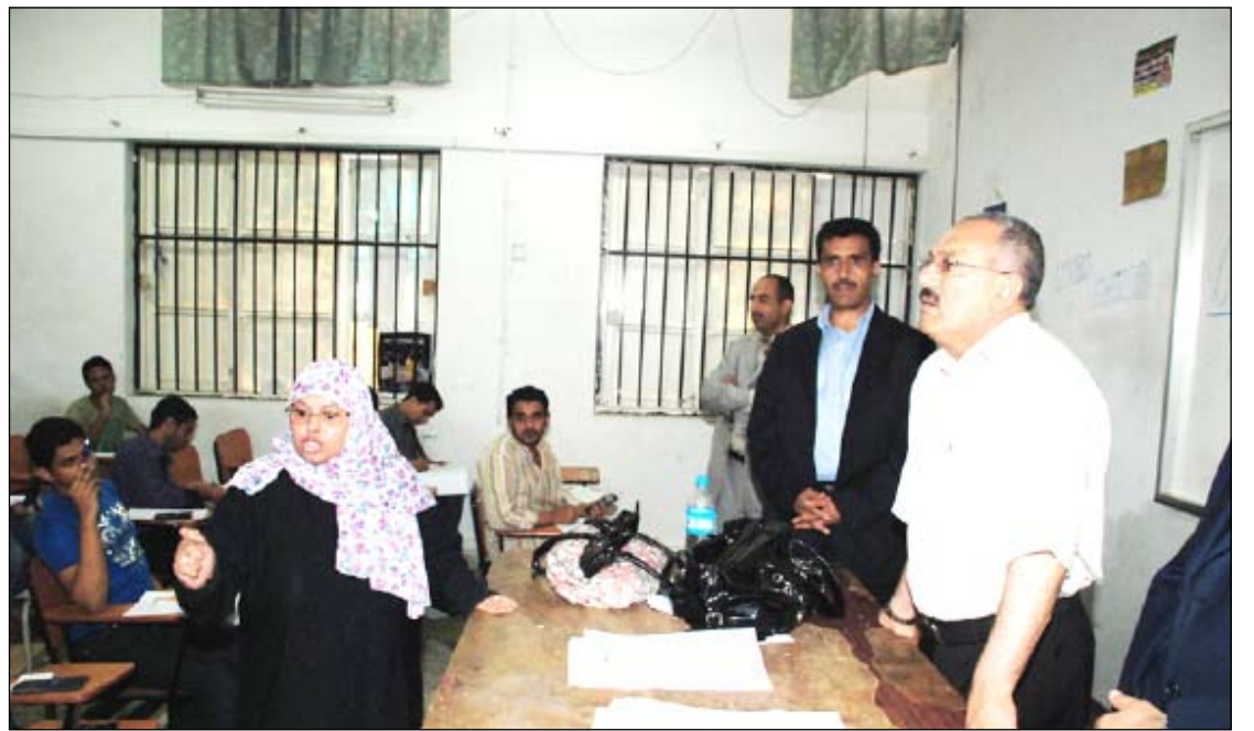
■ رئيس الجمهورية يتفقد كلية الهندسة