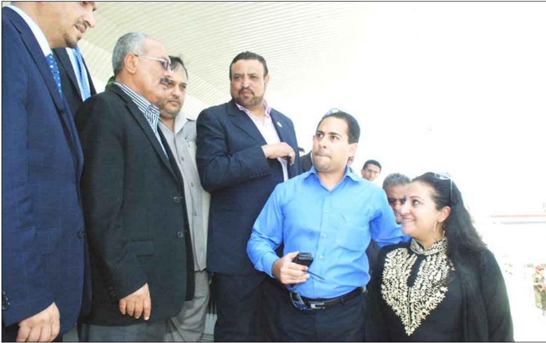
.. يستمع إلى شرح حول سير الاعمال في ملعب حقات