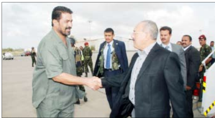
رئيس الجمهورية لدى وصوله مطار عدن الدولي وفي استقباله محافظ عدن أمس

عدن - أ.ب.س/ سيأ: أكد فخامة الأخ/ علي عبدالله صالح رئيس الجمهورية ان مشاريع خليجي (20) ستكون جاهزة ومنجزة في موعدها المحدد وهو الثلاثون من أكتوبر الجاري بحسب ما بلغه الوزراء المعنيون وان الترتيبات الأمنية والإجراءات الاحترازية التي تم اتخاذها لتأمين فعاليات بطولة خليجي 20 محكمة . وقال فخامته لوسائل الإعلام : « نحن وضعنا احتياطاتنا بما يكفل أن تسير الأمور في أبين بشكل أفضل ومطمئن، وليس هناك أي قلق من العناصر الإرهابية لتنظيم القاعدة فقد تم دحر تلك العناصر من المحافظة بشكل جيد، والأجهزة الأمنية تواصل ملاحقتها لتلك العناصر في أي مكان يتواجدون فيه سواء في أبين أو شبوة أو حضرموت أو غيرها وستستمر في متابعتهم حتى يتم تخلص شعبنا من هذه الآفة التي تسبب الأذى للأمن والاستقرار» . وأضاف فخامة الأخ الرئيس قائلاً: «نرحب بالأشقاء الخليجين والجمهور الخليجي في وطنهم الثاني اليمن، وسيكونون ضيوفاً أعزاء ومحل ترحاب من كل مواطن يماني شريف من أبناء شعبنا العظيم الذين سيكونون الحارس الأمين لضيوهم» . وكان فخامة الأخ الرئيس علي عبدالله صالح رئيس الجمهورية قد قام أمس بزيارات تفقدية للمشاريع الخدمية والإنمائية والمنشآت الرياضية الخاصة بخليجي (20) التي شارف تنفيذها على الانتهاء حالياً في محافظتي عدن وأبين والتي تبلغ كلفتها الإجمالية حوالي 120 مليار ريال . التفاصيل ص3