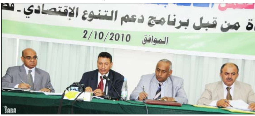
من ورشة العمل لتقييم القدرات التسويقية الزراعية

في اليمن إلى مساندة الجهود المبذولة في بلورة السياسات الخاصة بتطوير منظومة الإصلاحات الاقتصادية على القطاع الزراعي.