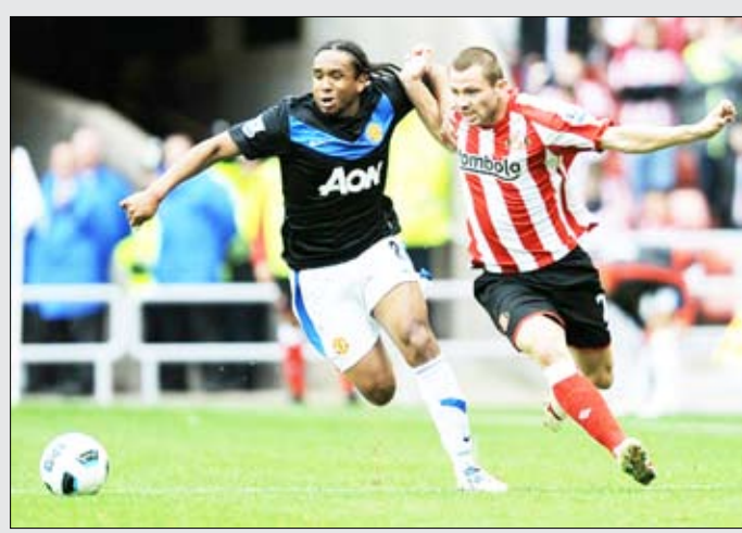
من لقاء مانشستر يونايتد وسندرلاند

لكن فان در فارت الذي سجل أحد الأهداف الأربعة لتوتنهام في مرمى توتني انشكبه الهولندي (1-4) الأربعة في دوري أبطال أوروبا. أدرك التعادل لأصحاب الأرض في الدقيقة الأخيرة من الشوط الأول بكرة رأسية بعد تمريرة من بيتر كراوتش. وفي الشوط الثاني أضاف فان در فارت هدفه الشخصي الثاني وهدف التقدم لفريق المدرب هاري ريدناب في الدقيقة الـ 75 بعد تمريرة أخرى من كراوتش.