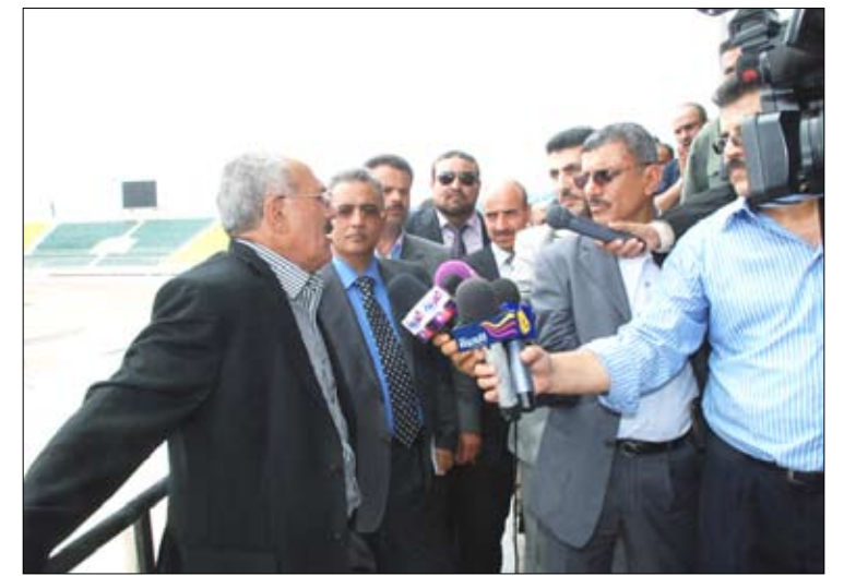
.. ويبدلي بتصريح لوسائل الإعلام