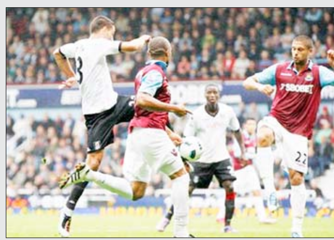
من لقاء فولهام وويستهام

الفريق اللندني إلى فوز 2-1. ووجد توتنهام نفسه متخلفاً أمام فريق المدرب الفرنسي جيرار هوييه منذ الدقيقة الـ 16 عندما تفوق أميل هيسكي على المدافع الفرنسي سيباستيان باسونغ قبل أن يعكس الكرة لمارك البريتون الذي أودعها شبك الحارس البرازيلي غوميش.