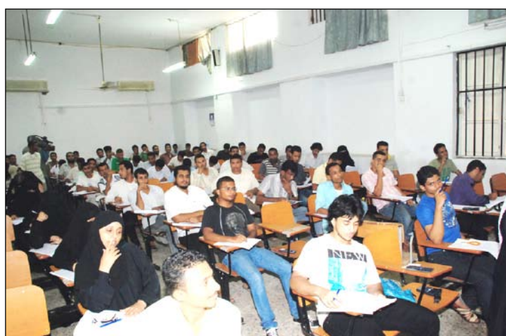
■ جانب من طلاب الكلية