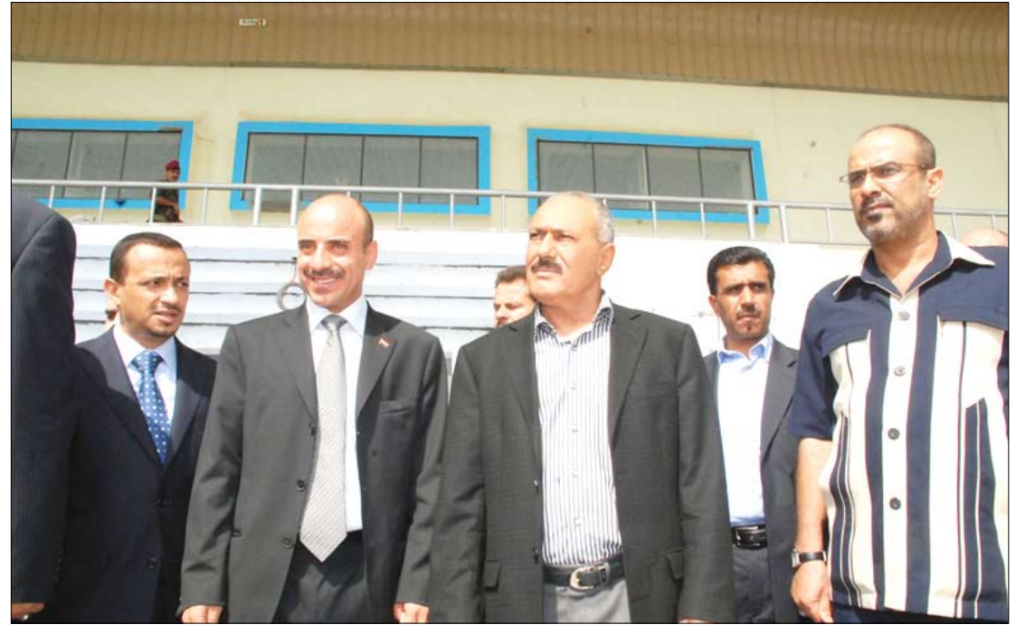
رئيس الجمهورية يزور ملاعب ومنشآت خليجي 20