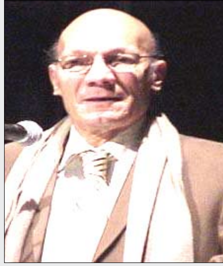
شعر/ عبد المعطي حجازي

والسماء خلاء وأهاج المدينة غرقى يموتون تحت المجاعة ويصيحون فوق المآذن أن الحوانيت مغلقة وصلاة الجماعة باطلة، والفرنجة قادمة فالنساء النجاء! ووقفت على شرفات المدينة أشهدا، وهي تشحب بين يدي كطفل، ويختلط الرهج المتصاعد حول مساجدها بالبكاء