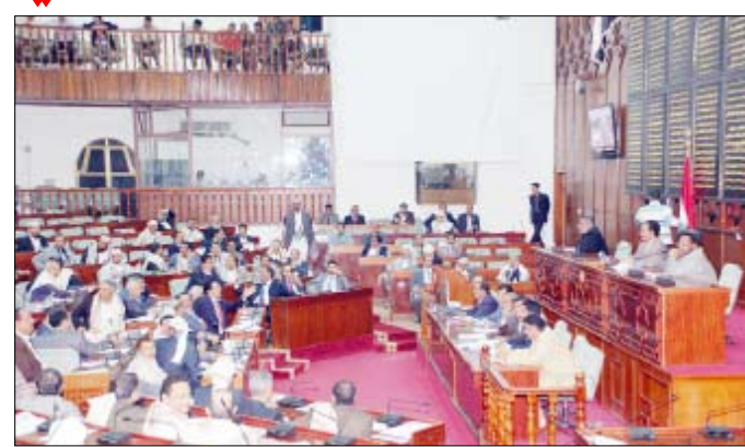
من جلسة مجلس النواب أمس

صنعا / سيأ: واصل مجلس النواب في جلسته أمس برئاسة رئيس المجلس يحيى علي الراعي استعراضه لتقرير لجنة التجارة والصناعة عن نتائج دراستها لمشروع قانون حماية الإنتاج الوطني من الآثار الناجمة عن الممارسات الضارة في التجارة الدولية. وقد قصد القانون بالإغراق في تطبيق أحكام هذا القانون تصدير منتج ما إلى الجمهورية بسعر أقل من السعر المماثل في مجرى التجارة العادية للمنتج المشابه حين يوجه للاستهلاك في البلد المصدر أو بلد المنشأ ما يتسبب في إلحاق الضرر المادي بالمنتجين المحليين أو التهديد بإحداث الضرر المادي لهم أو الإعاقة المادية للصناعة محلية. وقصد بالدمع في تطبيق أحكام هذا القانون كل إعانة أو مساهمة مالية مباشرة أو غير مباشرة تمنح للمنتج المستورد إلى الجمهورية من قبل دولة المنشأ أو أي هيئة عامة فيها أثناء تصديره إلى الجمهورية بحيث يتسبب في إلحاق