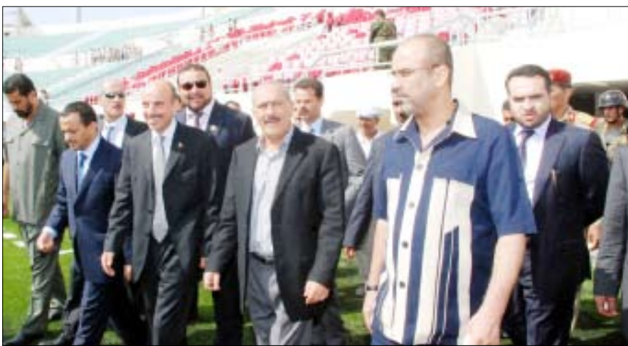
.. ويتفقد ملاعب خليجي (20)