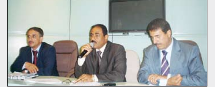
وزير الكهرباء يتحدث خلال الاجتماع

شيكات مؤجلة إلى ما بعد تاريخ 25 من كل شهر، واستمرار فترة توزيع الفواتير لمدة ثلاثة أيام كحد أقصى، بحيث يبدأ التحصيل من اليوم الثالث لإصدار الفواتير، إلى جانب وضع خارطة للتحصيل لتوضيح المبرعات الأكثر تحدياً والمبرعات الأكثر مديونية.