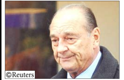
شيراك أول رئيس فرنسي يواجه تهما جنائية