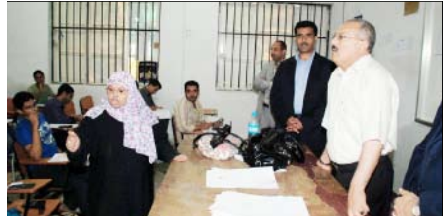
رئيس الجمهورية لدى تفقده كلية الهندسة بجامعة عدن أمس