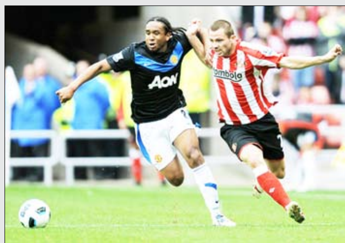
من لقاء مانشستر يونايتد وسندرلاند

لكن فان در فارت الذي سجل أحد الأهداف الأربعة لتوتنهام في مرمر توتني انشكبه الهولندي (4-1) الأربعة في دوري أبطال أوروبا. أدرك التعادل لأصحاب الأرض في الدقيقة الأخيرة من الشوط الأول بكرة رأسية بعد تمريرة من بيتر كراوتش. وفي الشوط الثاني أضاف فان در فارت هدفه الشخصي الثاني وهدف التقدم لفريق المدرب هاري ريدناب في الدقيقة الـ 75 بعد تمريرة أخرى من كراوتش.