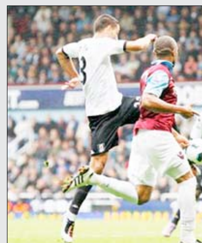
من لقاء فولهام ويستهام

ورفع توتنهام رصيده إلى 11 نقطة في المركز الخامس بفارق الأهداف عن أرسنال الثالث ومانشستر سيتي الرابع الذي يلعب اليوم مع نيوكاسل، وعن وست بروميتش البيون السادس الذي تعادل مع بولتون بهدف ليجيس موريسون (78)، مقابل هدف للسويدي يوهان الماندر (64). ونجح إيفرتون في تحقيق فوزه الأول هذا الموسم بعد ثلاث هزائم وثلاثة تعادلات بتغلبه على مصيفه برمنغهام بهدفين لروجر جونسون (54 خطأ في مرمر فريقيه) والأسترالي تيم كاهيل (90). وانتهت مواجهة درسي العاصمة بين وستهام وجاره فولهام بالتعادل بهدف للفرنسي فريدريك بكيون (51)، مقابل هدف للألماني كلينت ديمبسي (33)، فيما تغلب ستوك سيتي على بلاكبيرن روفرز بهدف لجوناثان ولترز (48). وحسم ويلغان مواجهة القاع مع صيفه ولفرهامبتون وحقق فوزه الثاني بهدفين للإسباني جوردو غوميز (65) والكولومبي هوغو روداليجا (86) في مباراة لعب خلالها الخاسر بعشرة لاعبين بعد طرد كارل هنري (11). وتستكمل المرحلة اليوم الأحد بمباراة ليفربول وبلاكبول، إلى جانب مباراتي مانشستر سيتي ونيوكاسل، وتشلسي وأرسنال.