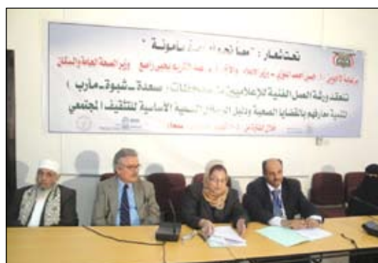
خلال افتتاح الورشة التدريبية للإعلاميين