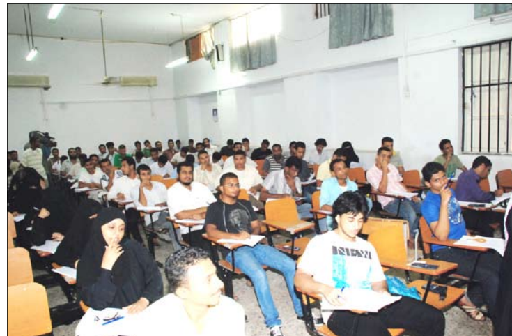
جانب من طلاب الكلية