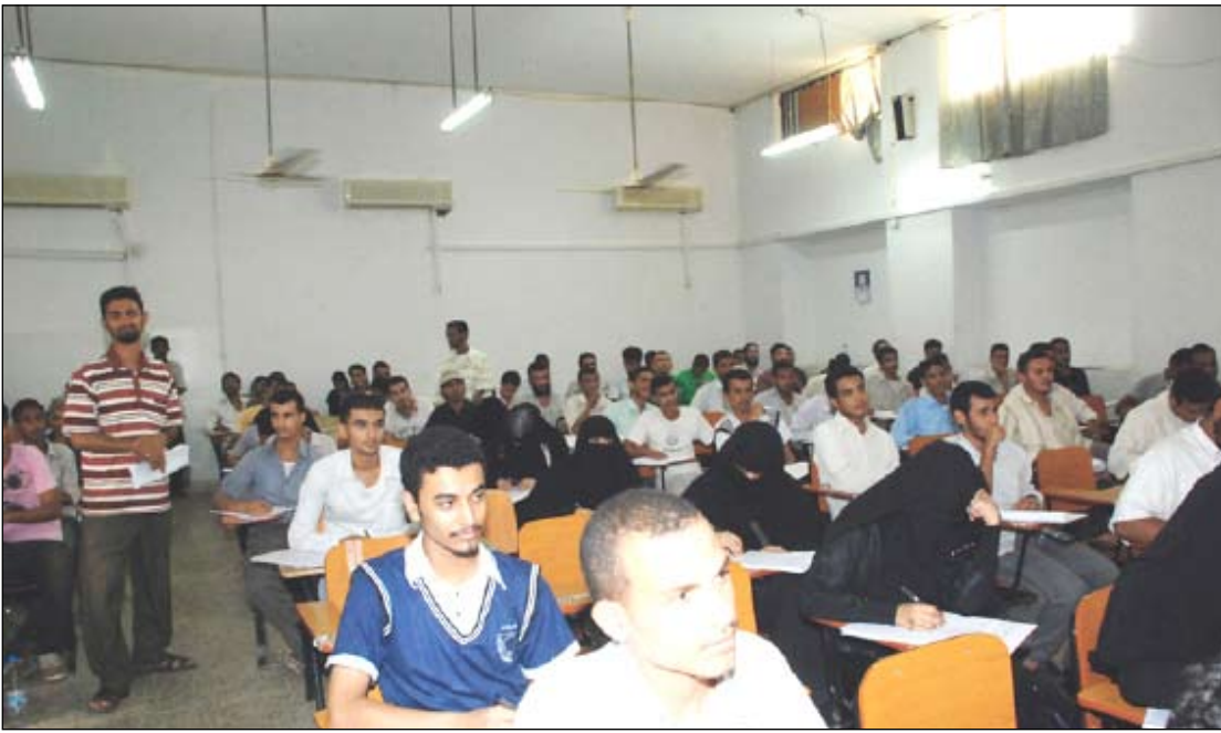
جانب من طلاب الكلية