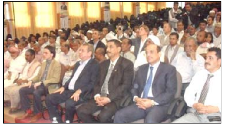
الوزير العيدروس في الحفل الفني والتكريمي