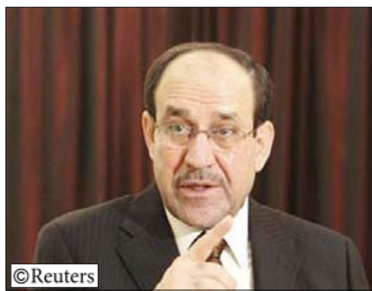
رئيس الوزراء العراقي نوري المالكي

وحضرت منظمة بدر التي تسيطر على نحو 11 مقعداً في البرلمان الاجتماع بينما لم يحضره المجلس الاعلى الاسلامي العراقي. وقال ريدر فيسر المحلل بموقع هيسطوري بالالكتروني «كل شيء يتوقف على حجم التكتل الشيعي الذي يدعم المالكي. يوم الاثنين الماضي كانت هناك مؤشرات على أن المجلس الاعلى الاسلامي العراقي ينشق. اذا فعل هذا حقاً فإن احتمالات أن يكون المالكي رئيساً للوزراء ستصبح أقل». ومضى يقول «اذا أصبح المالكي المرشح لمنصب رئيس الوزراء داخل اطار عمل تحالف شيعي طائفي فان احتمالات أن تقاطع العراقية ستكون كبيرة لأن لها الكثير من التحفظات عليه على المستوى الشخصي». وأظهرت الأزمه مدى عمق الانقسامات وأثارت المخاوف من أن انتشار أعمال العنف واراقة الدماء على نطاق واسع التي كادت أن ترمز للعراق في 2006 و 2007 قد تستأنف اذا استبعدت إحدى طوائفه من الحكومة أو حرمت مما تعتبره نصيباً عادلاً من السلطة. وقال عبد المهدي «ليفعلوا ما يريدون وليحسموا امرهم إن اردوا. نحن قلناها صراحة باننا لن نشارك في حكومة لا تضم دولة القانون والتحالف الكردستاني والقائمة العراقية».