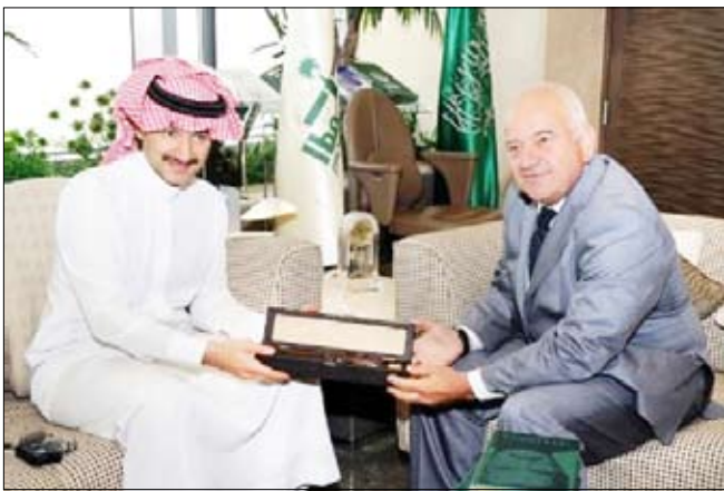
الأمير الوليد بن طلال مع السيد راديو بويوف

استقبل الأمير الوليد بن طلال بن عبد العزيز آل سعود، رئيس مجلس إدارة شركة المملكة القابضة في مكتبه بالرياض السيد راديو بويوف نائب وزير خارجية بلغاريا. وحضر اللقاء من جانب شركة المملكة القابضة الدكتورة نهلة العنبر المساعدة التنفيذية الخاصة لرئيس مجلس الإدارة. وفي بداية اللقاء، شكر راديو بويوف الأمير لإتاحته الفرصة للقاء به، كما قدم دعوة للأمير الوليد إلى الاستثمار في بلغاريا وزيارة بلاده مرة أخرى والنظر في فرص الاستثمار المتاحة هناك. وخلال اللقاء تناول الطرفان بعض المواضيع الاقتصادية وقطاع السياحة وتطرق إلى الوضع الاقتصادي الحالي في بلغاريا وجهود البلاد في جذب الاستثمار الخارجي، كما سلم سموه خطاباً من محافظ مدينة كازانلاند لعرض فرص استثمارية. وفي نهاية اللقاء، ودع الأمير بويوف محملاً إياه بحياته لفخامة رئيس بلغاريا، وقدم هدية تذكارية له.