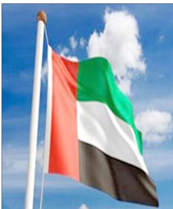
العلاقات بين البرلمان العربي ونظيره الأوروبي.

الاتحاد البرلماني الدولي إلى رئيسة البرلمان العربي بحضور المؤتمر الثالث لروساء البرلمانات في العالم في مقر الأمم المتحدة بجنيف. وتبحث لجنة الشؤون الاقتصادية والمالية مؤتمر البنية التشريعية والقانونية للاستثمار والتحكيم التجاري في الوطن العربي، وسبل دعم وتعزيز الاستثمار وتنظيم منتدى عربي للحماية التشريعية في مشاريع البنية التحتية وتقرير الدورة الثانية للمجلس الوزاري العربي للمياه، وإقامة منتدى عربي للمياه وقضية الجفاف والأمن القومي الغذائي العربي وتنمية وتشيط السيادة.