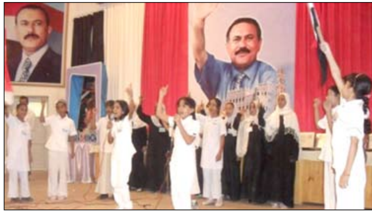
من فقرات الحفل