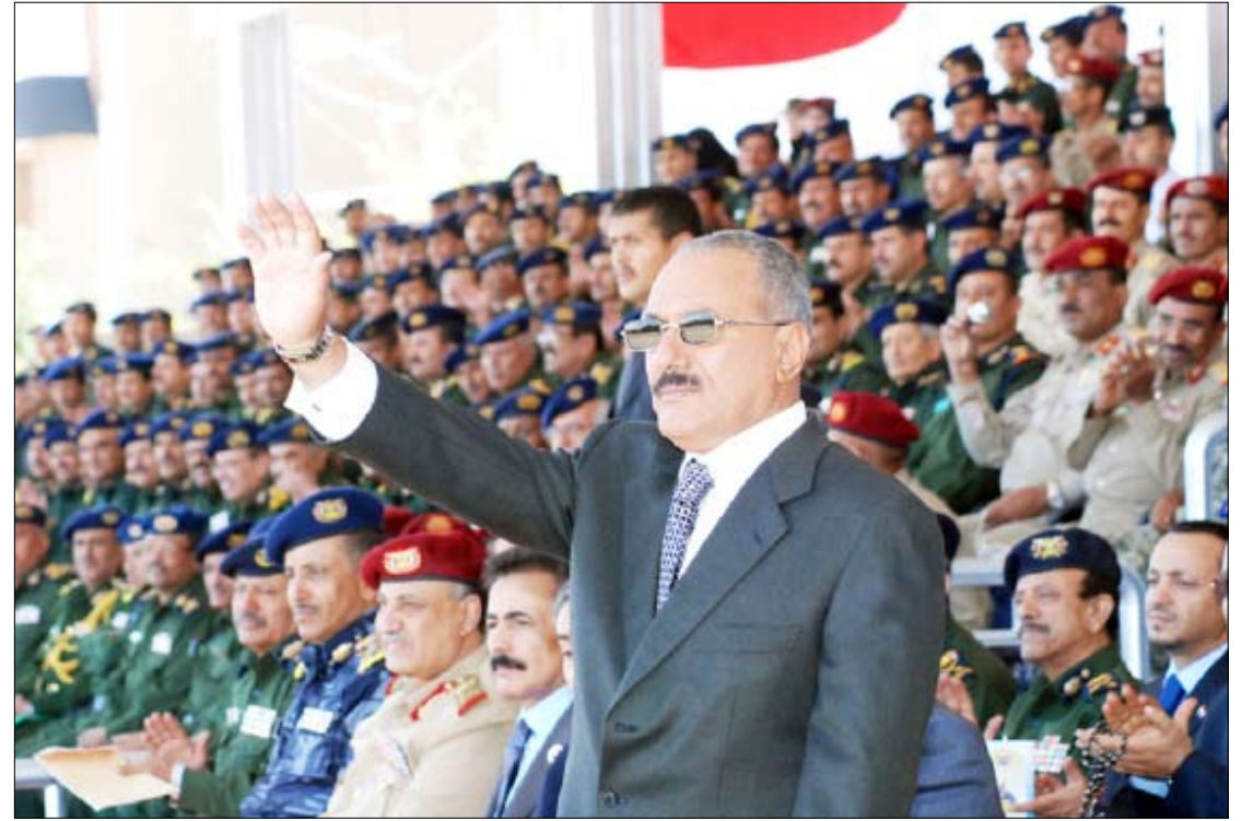
رئيس الجمهورية يحضر حفل تخرج عدد من دفع كلية الشرطة