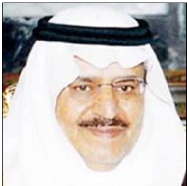
نايف بن عبد العزيز آل سعود

على مستقبلهم، وتأثيره في محاربة التطرف والغلو.