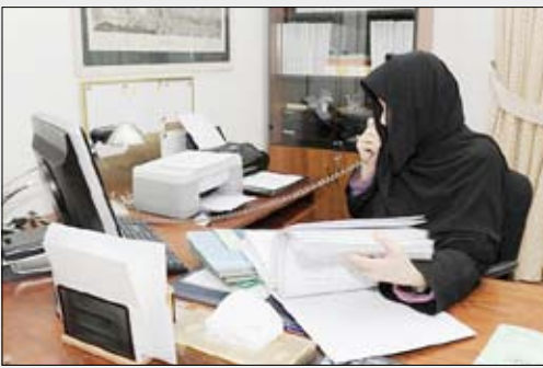
سيدة أعمال سعودية

تملكها نساء. ويبلغ حجم رؤوس الأموال النسائية في المملكة 60 مليار ريال، كما تبلغ قيمة الاستثمارات العقارية باسم السعوديات نحو 120 مليار ريال، فيما قدرت دراسات اقتصادية حجم اموال السعوديات المستثمره في الخارج بنحو 100 مليار ريال. البحث يقدم صورة مغايرة للمرأة السعودية حين تقتحم مجالات استثمار جديدة، وجريئة، ولا تتشابه مع الاستثمارات التقليدية التي تستثمر معظم سيدات الأعمال فيها، كالمشاغل والمدارس ومراكز التدريب. ويعرفنا على المقاولات التي تمارس أعمال البناء