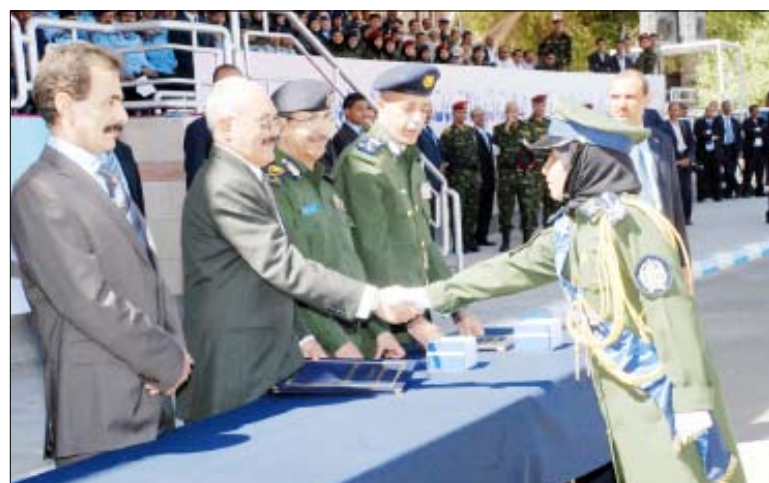
رئيس الجمهورية أثناء حضوره حفل تخرج الدفعة الأولى (شرطة نسائية) بكلية الشرطة أمس .. ويكرم إحدى خريجات الكلية