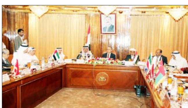
■ من افتتاح الدورة الـ (26) للأمانة العامة لمراكز الوثائق والدراسات الخليجية أمس

وأشار مدير مكتب رئاسة الجمهورية إلى الروابط المشتركة التي تجمع اليمن وأشقائه في الجزيرة والخليج والسيل الكفيلة بتعزيز روابط الجوار وروح الأخوة العربية والإسلامية والمصالحة المشتركة، والأولويات المتطابقة، وتنامي المصالح المتبادلة على نحو مستمر كنتاج حتمي للوشائج الاجتماعية والترابط الجغرافي.