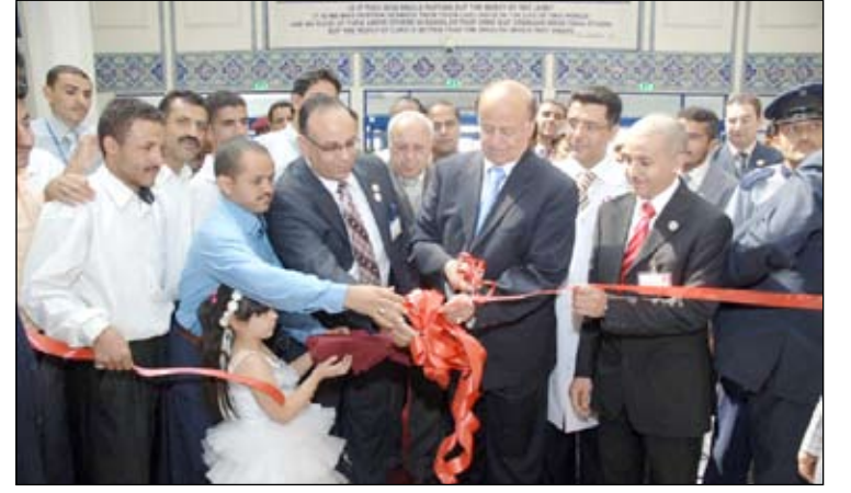
نائب الرئيس لدى افتتاحه الأقسام