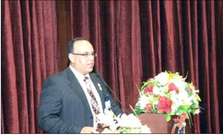
المدير التنفيذي خلال إلقاءه كلمته في الاحتفال