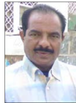
■ حسن عبده علي

في ظل قائد حكيم هو الرئيس علي عبدالله صالح. فهنيئاً لنا هذا العيد المبارك.