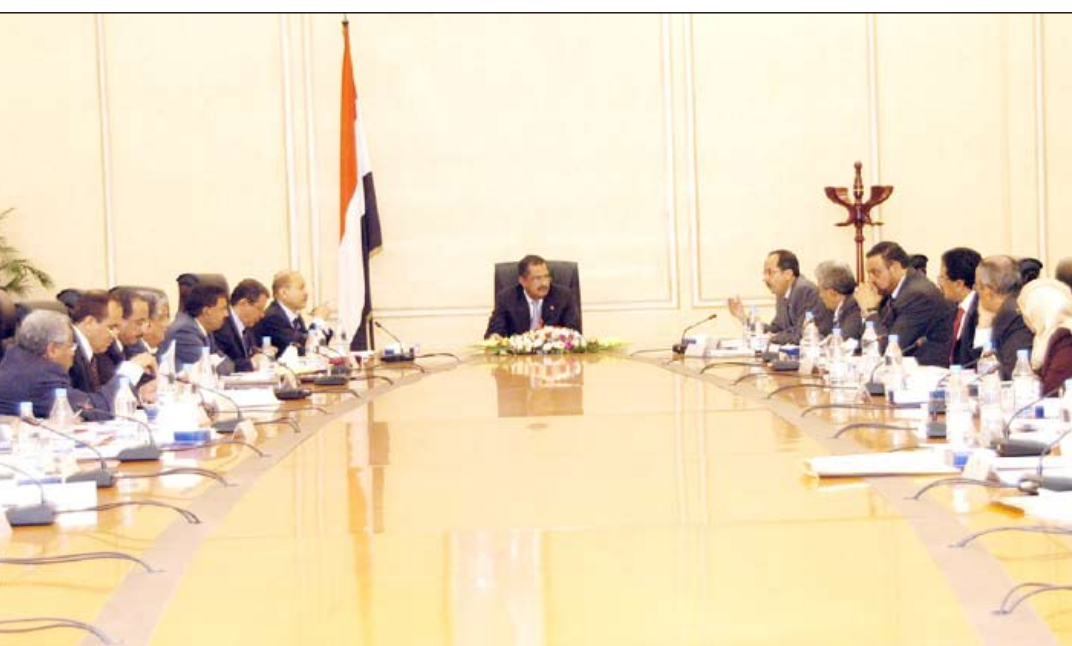
د. مجور خلال ترؤسه اجتماع مجلس الوزراء أمس

المشروع الذي تمت مراجعته من قبل اللجنة الوزارية برئاسة وزير الخدمة المدنية والتأمينات يهدف إلى تأطير الجانب التنظيمي للمنطقة الحرة عدن في ضوء قرار مجلس الوزراء رقم 1/ لسنة 2010م بشأن إلغاء الهيئة العامة للمناطق الحرة ونقل التزاماتها إلى المنطقة الحرة عدن ما من شأنه تعزيز الدور الرئيسي لهذه المنطقة في الإسهام بفاعلية في تعزيز وتطوير قدرات الاقتصاد الوطني على استقطاب الأنشطة الاقتصادية وجذب الاستثمارات إليها طبقاً للقانون والخطة العامة للدولة.