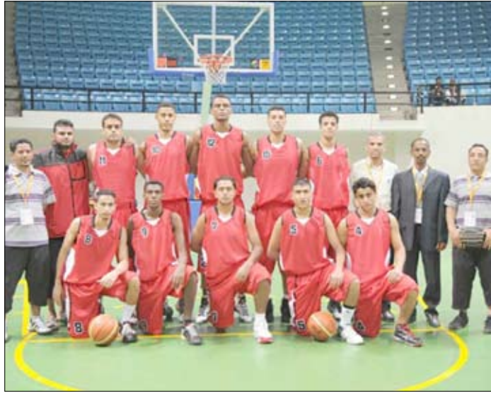
صنعاء / محمد البحري / بشر سنان : تصوير / عبد الرحمن حوييس :

يخوض منتخبنا الوطني لناشئي كرة السلة بالعاصمة صنعاء تمام الخامسة مساء على صالة 22 مايو الدولية اللقاء الأهم والأبرز والأقوى أمام نظيره منتخب إيران وذلك توافرا لفعاليات نهائيات آسيا لكرة السلة الـ21 التي تحتضنها بلادنا خلال الفترة من 22 سبتمبر حتى الأول من أكتوبر القادم بمشاركة ( 16 ) دولة آسيوية تتنافس على لقب البطولة وعلى المراكز الثلاثة المؤهلة لكأس العالم .