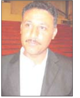
صنعاء / ساء :

ويبدأ المنتخب الوطني للكونغ فو بصنعاء اليوم الأربعاء معسكرا تدريبيا مغلقا استعدادا للبطولة العربية الثالثة للشباب والثانية للنادية والمدربين عادل والمراكز التي تحتضن منافساتها العاصمة صنعاء منتصف أكتوبر المقبل .