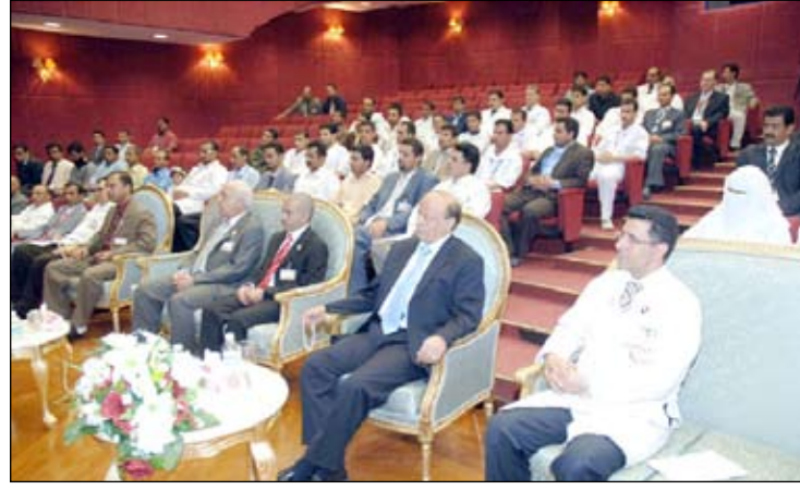
.. خلال حضوره الاحتفال