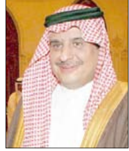
سلطان بن فهد

الرياض / ماتعاب : أكد الأمير سلطان بن فهد، الرئيس العام لرعاية الشباب بالسعودية ورئيس مجلس إدارة الاتحاد العربي لكرة القدم، أن مشاركة المنتخب السعودي في بطولة الخليج القادمة في اليمن ستكون بالمنتخب الأول. وقال الأمير سلطان بن فهد في تصريح صحفي عقب ترؤسه الاجتماع السادس والأربعين للجنة التنفيذية بالاتحاد العربي لكرة القدم: «يلاحظ أن مدرب المنتخب الأول اختار لمعسكر النساء أكثر من 36 لاعبا وواجهنا أسبانيا بالإضافة إلى العديد من المنتخبات العالمية، وإلى اللاعبين المصائبين وهؤلاء اللاعبين بالإضافة إلى اللاعبين المصائبين سيكونون ضمن اختيارات المدرب للفريق الأول وكذا إذا كان هناك نجوم جدي رأي المدرب أن يستعين بهم».